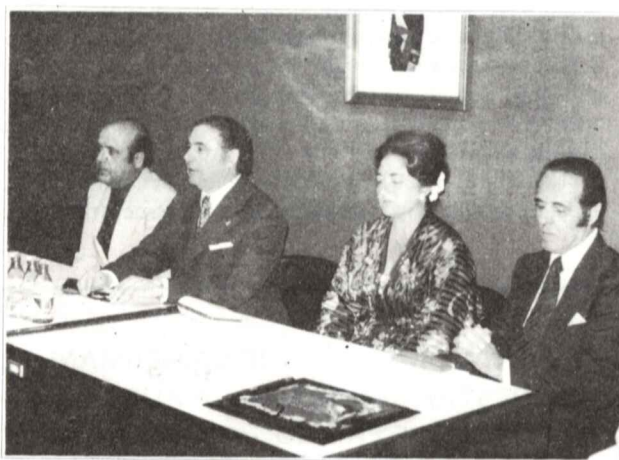
Se celebró el Acto Literario con motivo del Premio "Alcalá - Zamora" y Galardón "García Copado" (Información en página 10).

EL COLEGIO Y E-HOGAR "VIRGEN DE LA CABEZA"