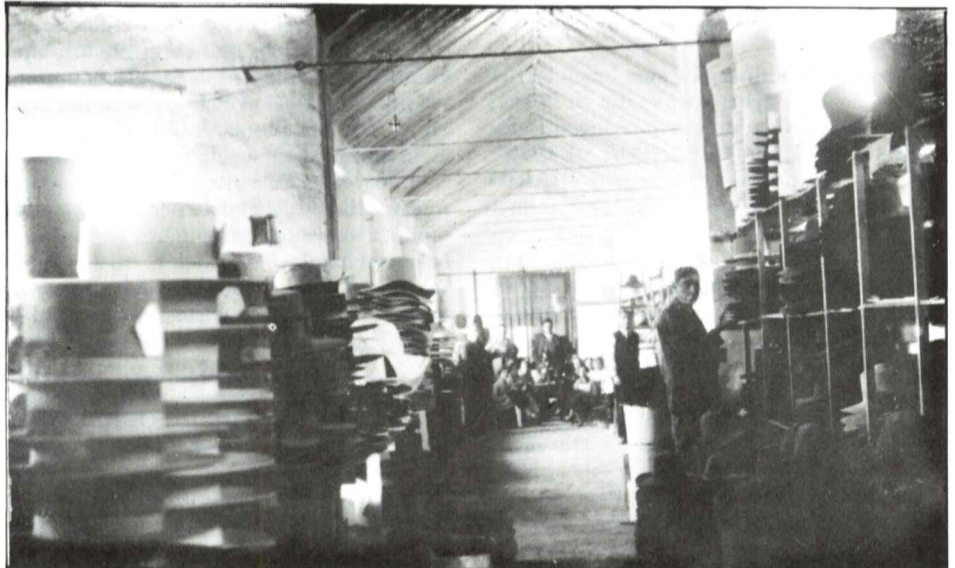
Fábrica de sombreros de Priego