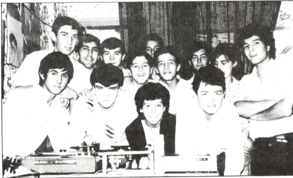
Componentes de Radio Tiñosa

Para otros expertos, consultados por ADARVE, en síntesis las interferencias de las efemes en televisión se deben, por un lado, al uso arbitrario y anárquico de las frecuencias de la banda FM, y por otro, a la falta de equipamientos de cierta calidad que a través de acualizadores supriman los armónicos (interferencias). Como posible vía de solución, se apunta bien al aumento de potencia del reemisor de TVE, bien a que las emisoras locales de FM no emitan a más vatios que el repetidor de televisión, evidentemente desde el punto de vista técnico, desde el político, la Junta de Andalucía tiene la última palabra.