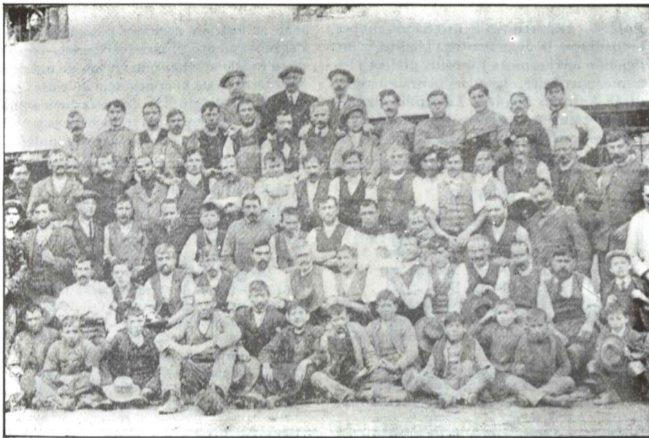
Trabajadores de la fábrica de sombreros "San Luis" de Priego