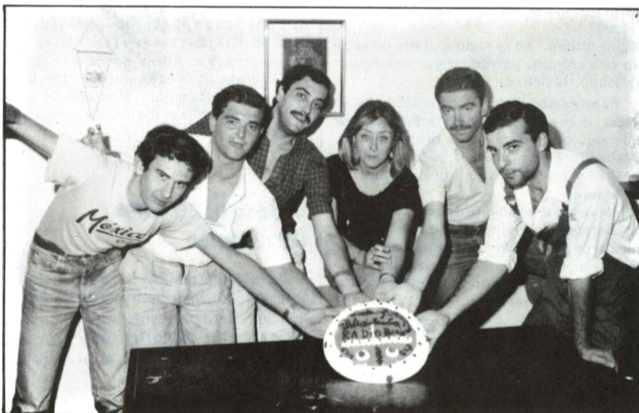
Los locutores de Radio Priego han celebrado el pasado mes de septiembre el primer aniversario de la emisora.