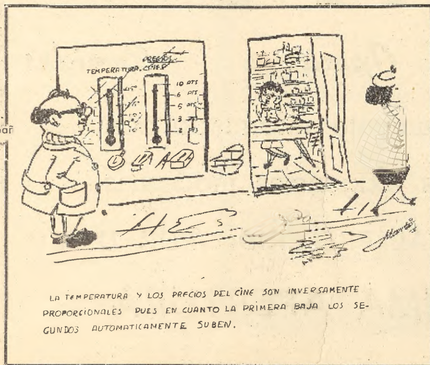
LA TEMPERATURA Y LOS PRECIOS DEL CINE SON INVERSAMENTE PROPORCIONALES PUES EN CUANTO LA PRIMERA BAJA LOS SEGUNDOS AUTOMATICAMENTE SUBEN.

Las mejores horas de este otoño, son las que se pasan en el incomparable