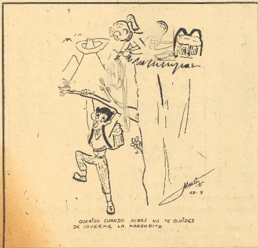
QUERIDO CUANDO SUBAS NO TE OLVIDES DE COVERME LA MARGARITA