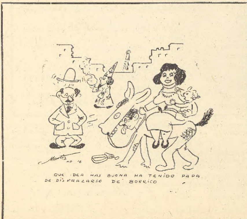
QUE IDEA MAS BUENA HA TENIDO PAPA DE DISFRAZARSE DE BORRICO