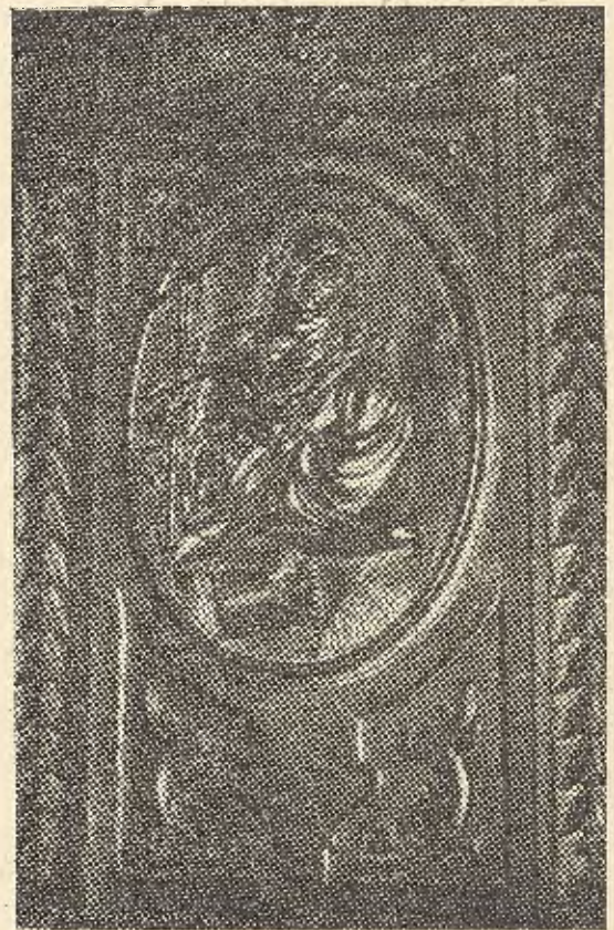
Pedrajas. San Felipe. Coro de Cabra

Incorporado nuevamente Pedrajas a la vida artística prieguense hace, por aquéllos años, los interiores de la Iglesia de San Francisco, Aurora, Angustias, Mercedes y San Pedro y el exterior de la segunda Iglesia antes citada, en la que se observa el gran parecido con las portadas de Estepa. Una enfermedad le tiene postrado en el año 1772, y, en unión de su esposa, hace testamento mancomunado instituyendo herederos a los cinco hijos que por entonces había en el matrimonio (3). Repuesto de la grave enfermedad termina el encargo que le había hecho el Pa-