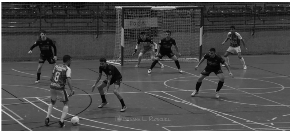
Instantes de un partido del Boca

El juvenil aún debe jugar 6 partidos de liga, dos de ellos atrasados, en las próximas 4 semanas, teniendo el reto de alcanzar la 4ª plaza. Un equipo que ha ido de menos a más y que las dos últimas jornadas ha obtenido dos victorias, 6-0 frente al Poli Ejido y 4-3 ante San Pedro Alcántara, 2º clasificado.