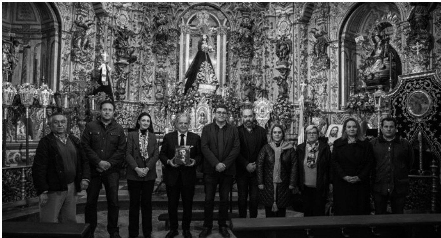
El Presidente de Diputación de Córdoba visitando la capilla de Jesús Nazareno