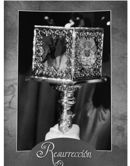
Portada de la revista "Resurrección"