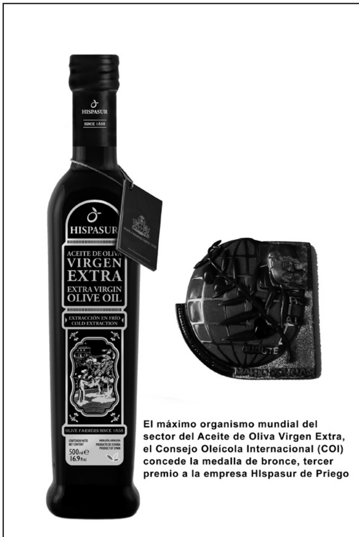
El máximo organismo mundial del sector del Aceite de Oliva Virgen Extra, el Consejo Oleícola Internacional (COI) concede la medalla de bronce, tercer premio a la empresa Hispasur de Priego