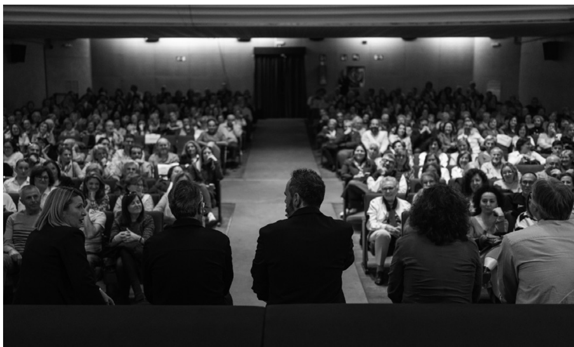
Director y protagonistas de el corto "Tumbas vecinas" ante el público comentando el corto

El corto se ha presentado ya a varios certámenes obtenido éxito en cada uno de ellos y posibilidades de optar a premios importantes en certámenes de cine.