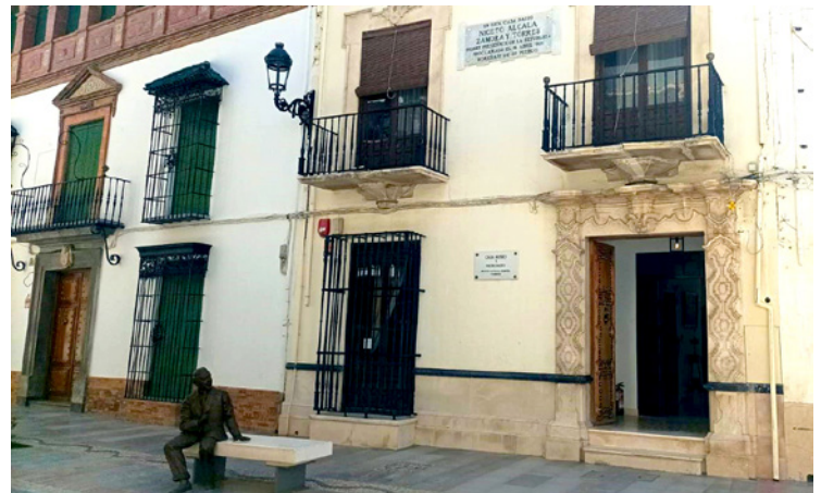
Fachada principal del Patronato Niceto Alcalá-Zamora.