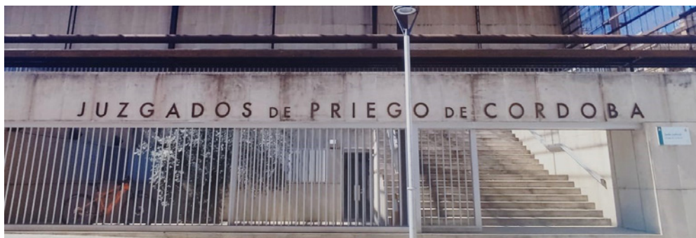
Juzgado de Priego

A pesar de que en el citado pleno el propio Alcalde también manifestó que no había que darle mayor recorrido, por estimarlos dentro del ámbito personal, la comparecencia en sede judicial del denunciado ha estado acompañada por los servicios jurídicos de la Diputación Provincial de Córdoba, entidad ejerciente