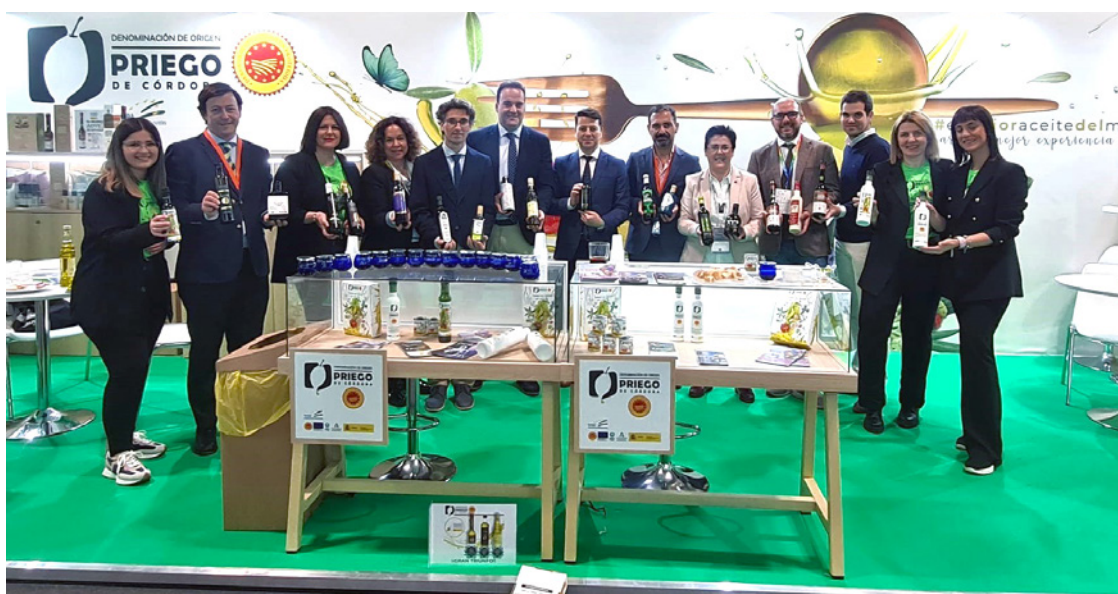
La DOP Priego de Córdoba recibe un gran éxito en el Salón Gourmets.

Como es costumbre, la D.O.P. Priego de Córdoba concluyó su participación en la feria con un gran número de visitantes en su stand, todos interesados en conocer más sobre sus aceites. Este alto nivel de interés se considera un éxito en la misión de promover y difundir la cultura del aceite, así como en el objetivo de dar a conocer las características y atributos que hacen únicos a estos AOVes de excelente calidad con Denominación de Origen Priego de Córdoba.