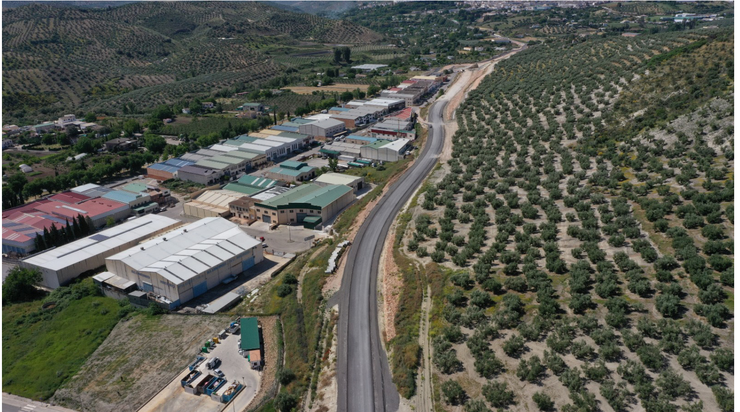
Vista aérea del último tramo de la nueva variante A-333 a su paso por el Polígono de la Vega.