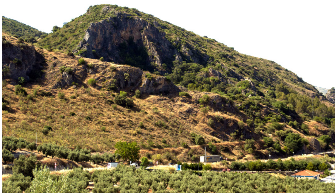
Lugar donde anidan las águilas perdiceras en las Angosturas.

En su momento, la delegación territorial de Sostenibilidad, Medio Ambiente y Economía Azul emitió un informe vinculante relativo a la Autorización Ambiental Unificada (AAU) del Proyecto de la Variante de las Angosturas. El mismo establecía que la actuación se consideraba viable desde el punto de vista ambiental, aunque adoptando medidas correctoras relativas a la mejora del hábitat del entorno de área de nidificación del águila perdicera . En concreto, planteaba la corrección de los tendidos eléctricos que no se encontraran adaptados frente a la colisión y electrocución de aves, ya que esta medida se considera actualmente como la más eficaz para disminuir la mortalidad de la especie, de acuerdo con el programa de actuaciones