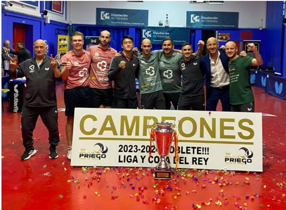
El equipo Cajasur al completo celebrando los dos títulos más importantes de la temporada en España.