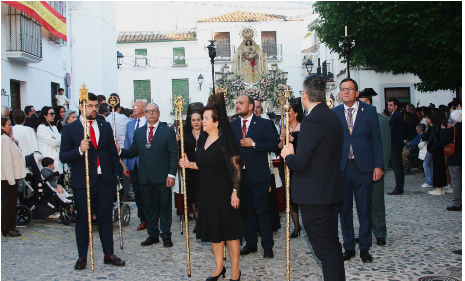
Salida procesional de la Virgen de la Caridad durante sus Fiestas de Mayo.