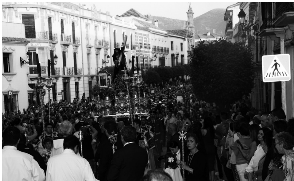
Impresionante vista en la Carrera de Álvarez poblada de ciudadanos.

El lunes 27 de mayo se inició el besapié a Nuestro Padre Jesús Nazareno, el cual se prolongó hasta el miércoles 29, teniendo lugar el día 28 la Santa Misa de Acción de Gracias y la presentación de los niños a Nuestro Padre Jesús Nazareno.