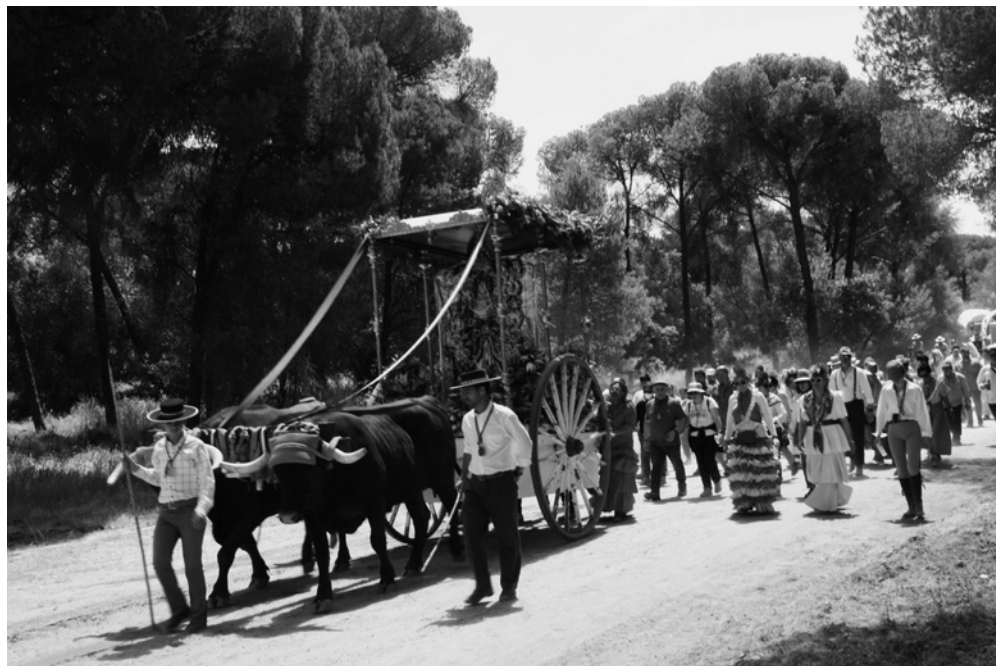
El Simpecado del Rocío de Priego por las Arenas llegando a Villamanrique para su presentación oficial.

El pasado sábado 11 de mayo tras la misa de romeros cantada por el coro Compases Rocieros y oficiada por el párroco de la Parroquia de Nuestra Señora de la Asunción, Ángel Cristo Arroyo, los rocieros de Priego iniciaban su camino hacia la Blanca Paloma.