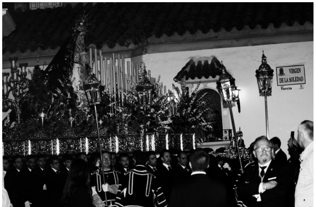
La Virgen de la Soledad durante la procesión a su paso por la calle que da su nombre.

Y para concluir las fiestas el lunes se celebraba el Solemne Besamanos a la Virgen de la Soledad concluyendo por este año las fiestas de la Hermandad.