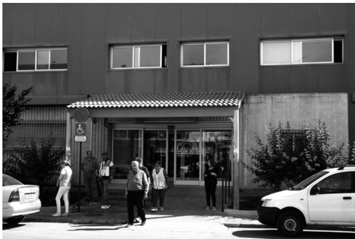
Entrada principal del Centro de Salud.

de Priego engloba el Centro de Salud de Priego, 3 consultorios locales ( Almedinilla, Carcaubye y Fuente Tojar) y 9 consultorios auxiliares ( Aldea de la Concepción, Castil de Campos, El Cañuelo, Esparragal, Fuente Grande, Las Lagunillas, Las Sileras, Zagrilla y Zamoranos).