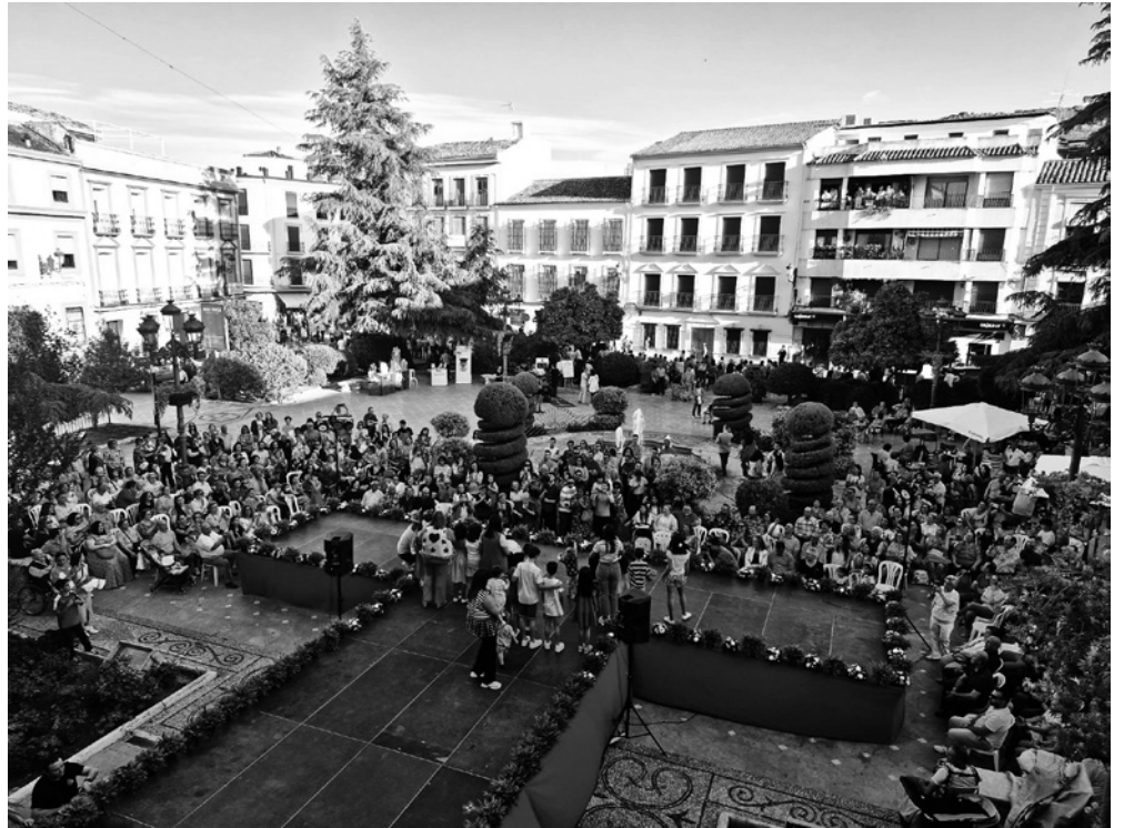
Vista aérea del desfile de moda.

Especialmente emotivos fueron los desfiles de las personas del taller jaramago (Albasur), convirtiendo la pasarela en una pasarela inclusiva, o las 3 modelos senior que desfilaron como auténticas profesionales de la pasarela. Otro momento crucial del desfile consistió