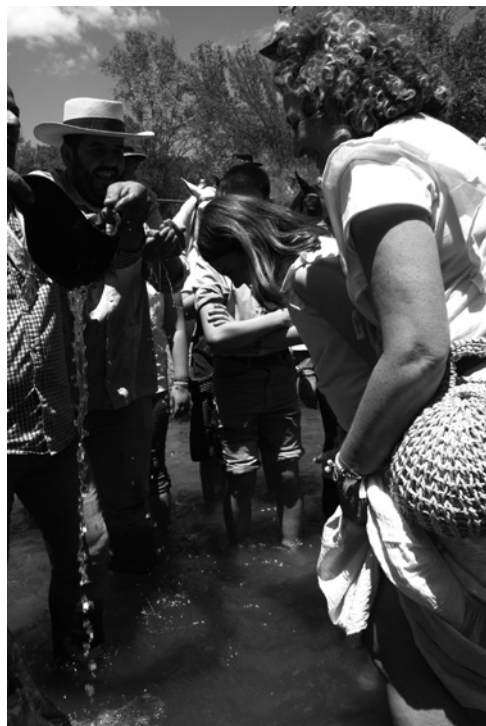
Bautizo rociero de una joven prieguense en el Quema.