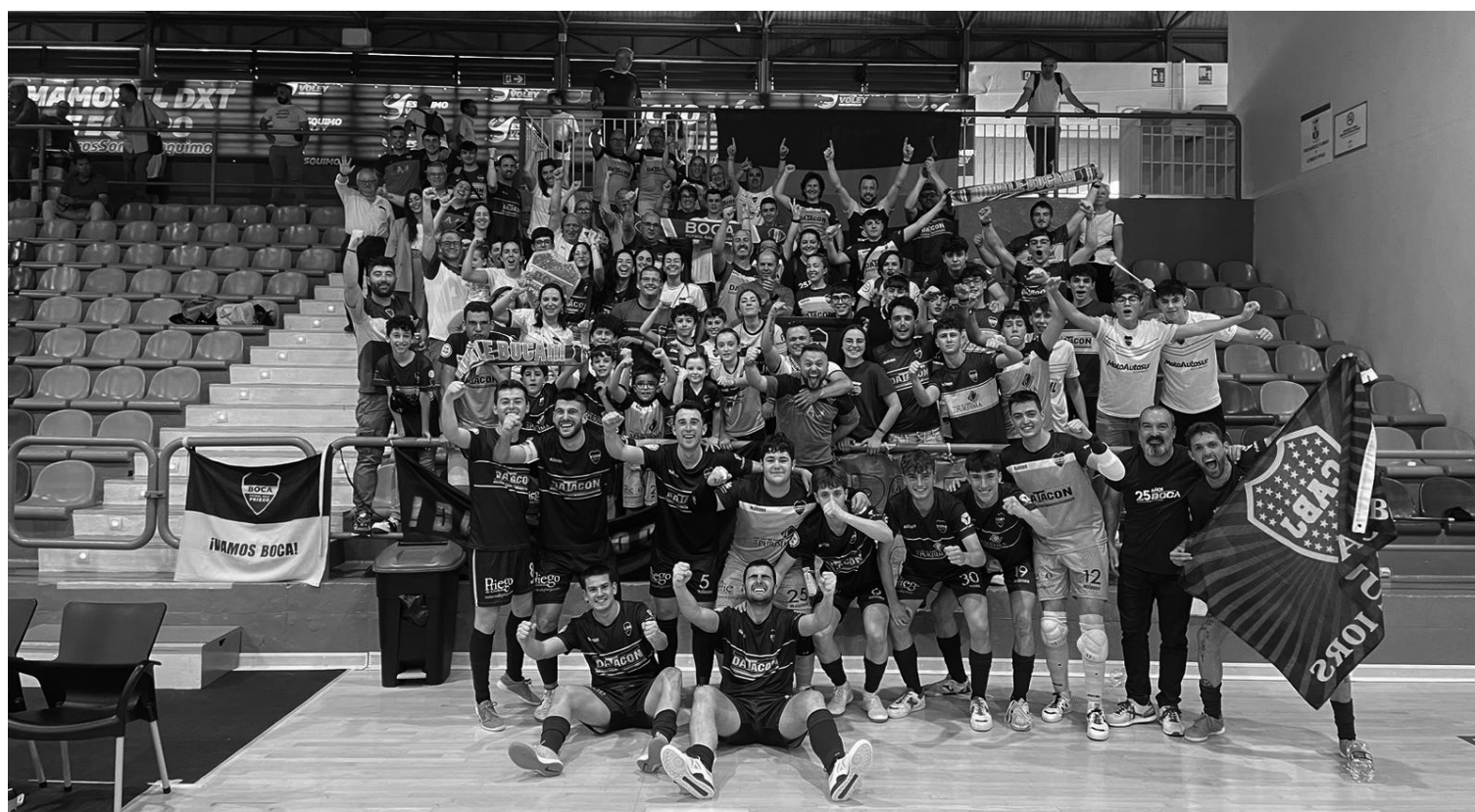
Afición del Boca FS Priego.

Con la temporada llegando a su fin, el club se encuentra cerrando competiciones y haciendo valoración de todo lo vivido desde que comenzamos el 1 de agosto.