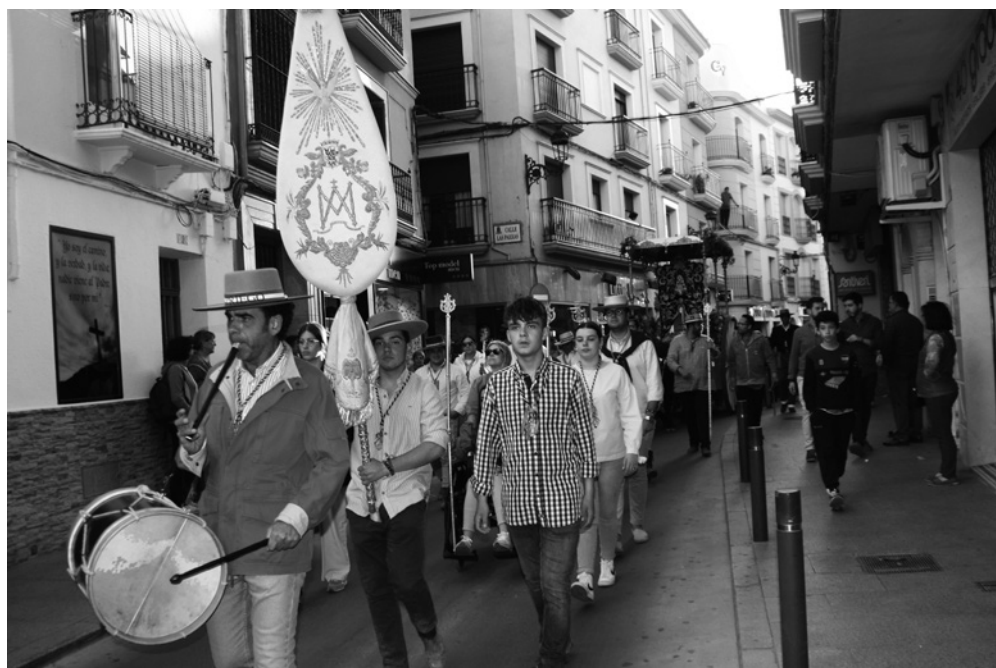
Llegada de la Hermandad del Rocío a Priego.