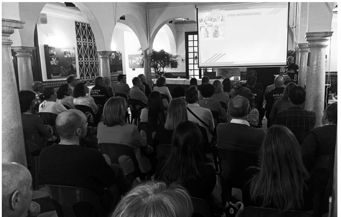
Asistentes a la presentación.

“En esta función de la educación vial, mostramos nuestro respaldo a todo lo que sean iniciativas en función de la educación vial, que en realidad es una educación de prevención para evitar la delincuencia de menores, e incluso de adultos en materia de seguridad vial de tráfico”. Concluyó el Fiscal Decano de