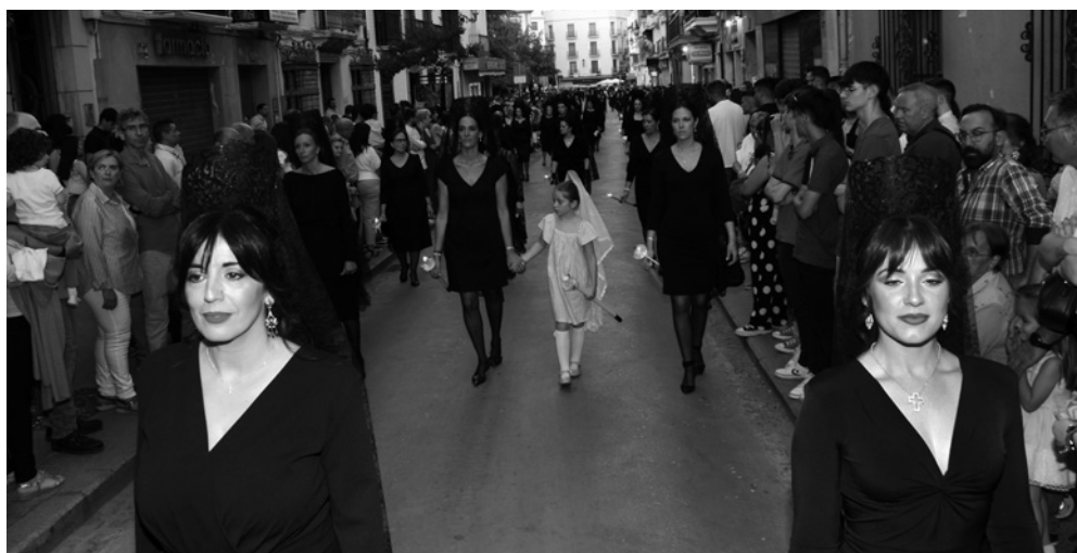
Más de un centenar de mantillas acompañaron a Jesús Nazareno.