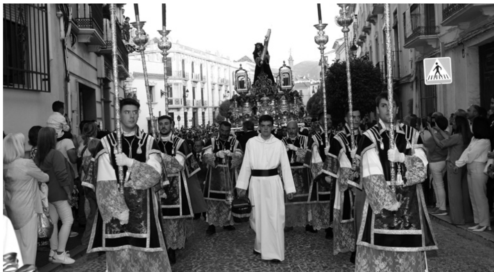
Jesús Nazareno en la Carrera de Álvarez.