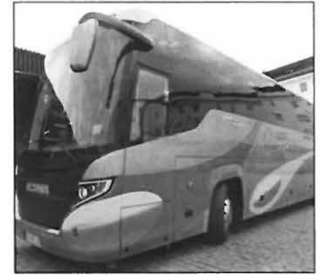
Autocares Carrera cubrirá el recorrido

En ADARVE nos regocijamos de esta nominación en la creencia de que viene a reafirmar que la honradez, la honestidad y la objetividad son atributos fundamentales e imprescindibles para el ejercicio de la libertad de prensa, lo que ha permitido que ADARVE, un modesto medio de comunicación local, perviva en la sociedad prieguense desde hace más de 70 años.