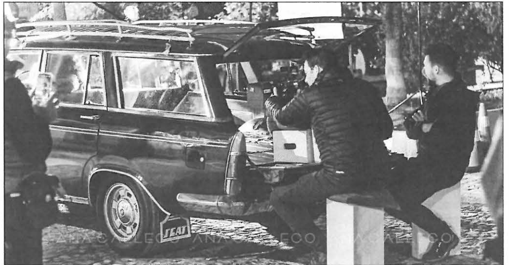
Imagen del rodaje de la película.