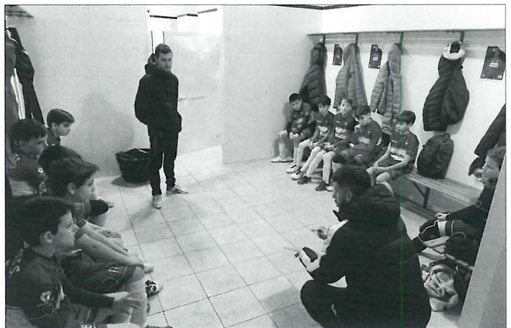
Charla de los entrenadores al equipo alevín

Finalmente, el equipo alevín, que se en-