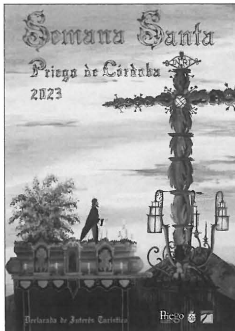
Cartel de Semana Santa