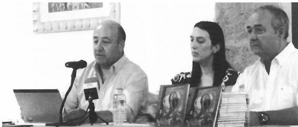
Presentación novela Alba