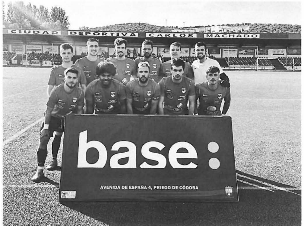
Jugadores del equipo prieguense

Salieron los prieguenses dispuesto a romper el infortunio que los acompaña y se fueron decididos en los primeros compases del partido hacia la portería