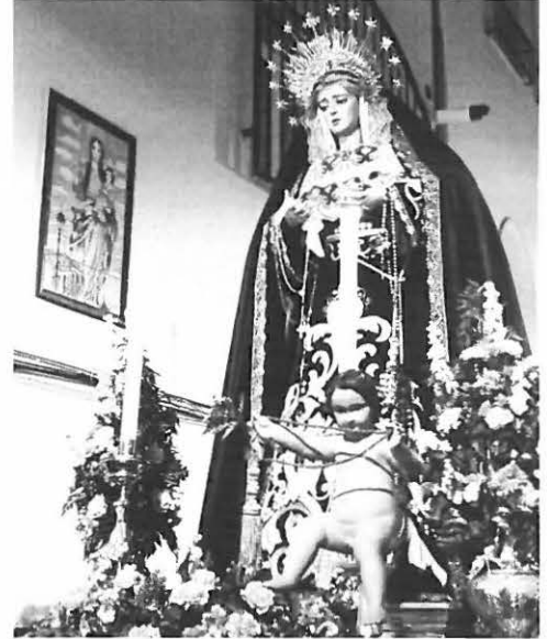
Virgen de los Dolores Nazarena procesionando por su barrio

El último día de triduo, domingo 8 de octubre, comenzaba con la procesión de María Santísima de los Dolores Nazarena a primera hora de la mañana por las calles del barrio, rezándose el Santo Rosario, acompañaba por numerosos devotos y con los sones de los Hermanos de la Aurora, quienes después acompañarían de igual modo la eucaristía, la cual fue presidida por Ángel Cristo Arroyo, párroco de la parroquia de Nuestra Señora de la Asunción. Aunque el desfile procesional no fue muy concurrido, el paso de la imagen de la Virgen por las calles del barrio fue muy emotivo para sus vecinos, ya que pudieron verla y disfrutarla desde la proximidad y en las puertas de sus casas.