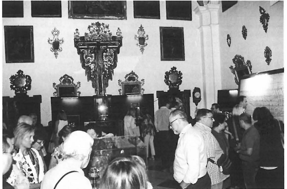
Público asistente a la inauguración de la exposición 300 años de Caballero y Góngora