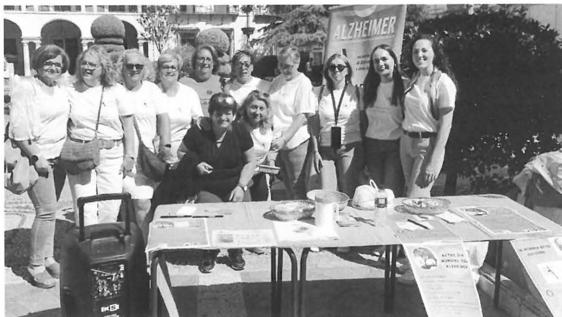
Miembros y familiares de la Asociación de Alzheimer.

Este año, en el Día Mundial del Alzheimer, bajo el lema