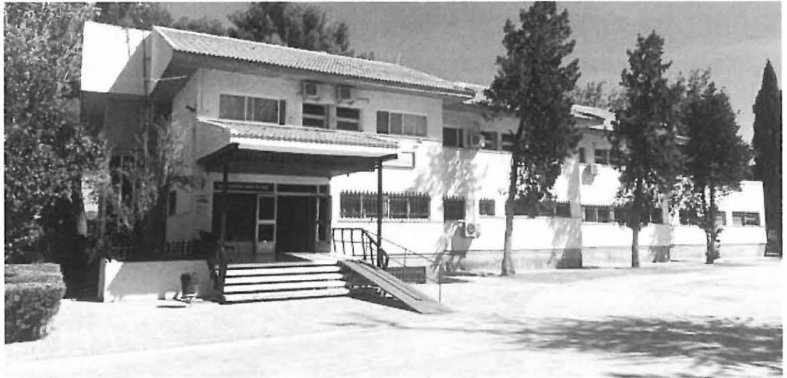
Entrada principal de la residencia Luque Onieva

destacadas están la futura sustitución del CEIP Cristóbal Luque Onieva (tres millones de euros), y la ya finalizada ampliación de espacios en el IES Carmen Pantión, para el nuevo ciclo formativo de Cocina y Gastronomía, así como la instalación de ener-