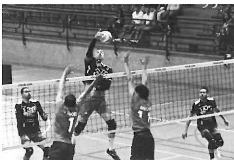
Mate del jugador del Unicaja

El primer set sorprendió de inicio a un Melilla Ciudad del Deporte que seguramente lo que esperaba era otro planteamiento