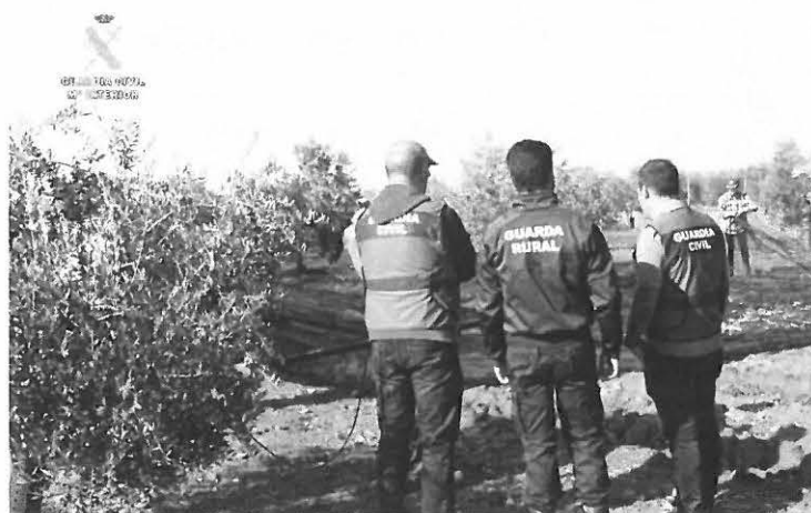
Agentes rurales y Guardia Civil inspeccionan una finca.