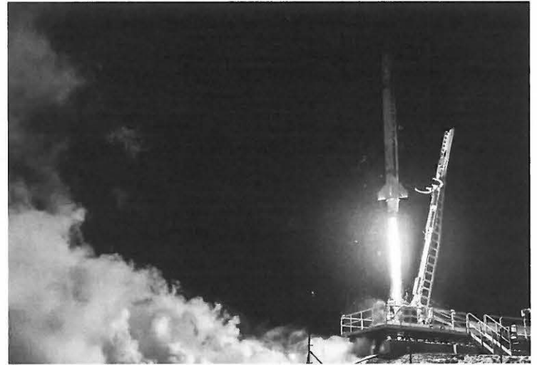
Lanzamiento del cohete Miura 1

Tras el año del máster en Inglaterra, vuelvo a España, a pesar de tener varias ofertas de trabajo en Reino Unido. Esta decisión la tomé puesto que el año que pasé en Inglaterra fue justo en medio de la pandemia de la COVID-19, y me hizo darme cuenta de lo importante que es poder tener cerca a la familia y a los amigos, y por eso