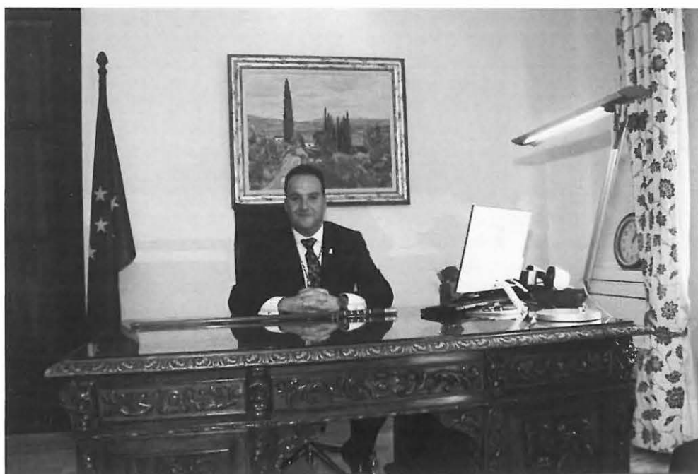
El alcalde en su despacho

¿Es cierto que a principio de legislatura hizo usted un pacto con los tres portavoces de la oposición para que fuese una legislatura sin fuertes broncas y discusiones y el ambiente en los plenos fuese más