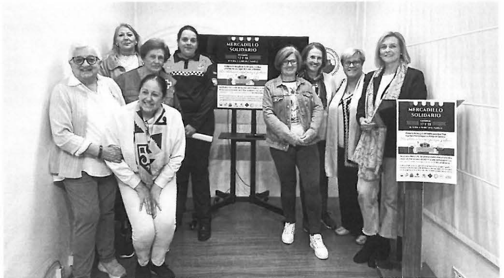
Componentes de las distintas asociaciones que participan en el mercadillo solidario

La historia de esta campaña solidaria se remonta a dos exitosas campañas anteriores que se llevaron a cabo por iniciativa de las religiosas del Sagrado Corazón, en respuesta a situaciones de emergencia. La primera campaña se organizó en octubre de 2021 en solidaridad con las víctimas de la erupción del volcán en la Palma, mientras que la segunda se realizó en marzo de 2022 en apoyo a las personas afectadas por la guerra en Ucrania. En esta ocasión, la campaña se enfoca en el apoyo a las entidades locales que han experimentado un aumento en la demanda de ayuda por parte de las familias locales. El evento cuenta con la colaboración de la