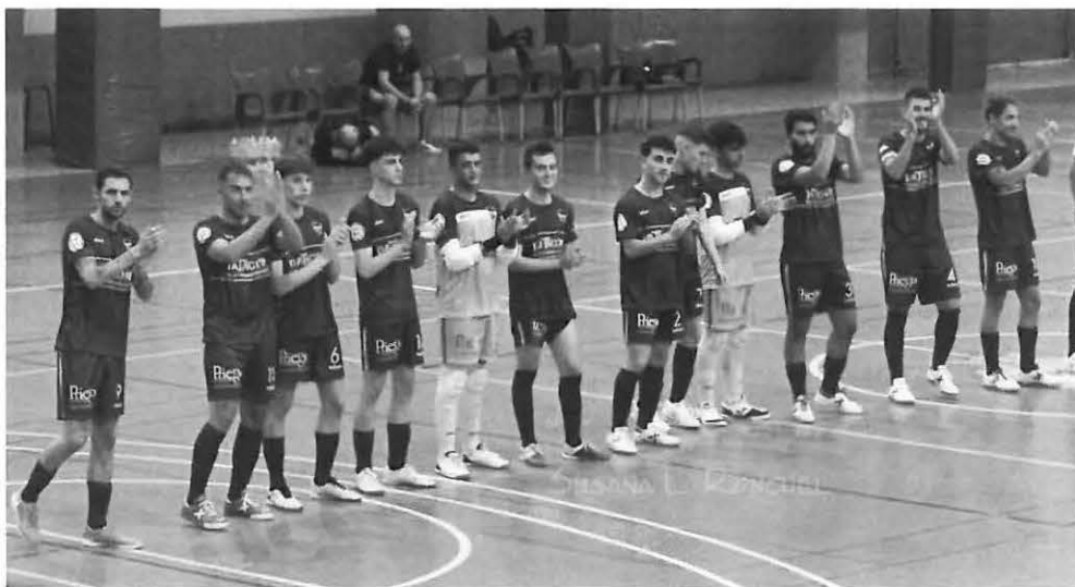
Equipo de Boca F.S. antes del inicio del partido.

Os invitamos a todos a vivir este deporte con nosotros cada fin de semana en el Pabellón de deportes “Rafa López”.