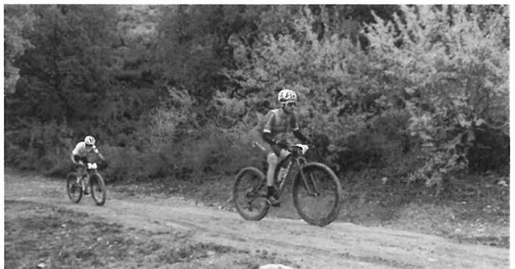
Corredores por la ruta de carrera