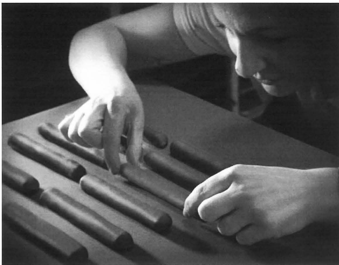
Elaboración manual del típico bollo "Turrolate"

Y para concluir, aunque queda un largo camino por recorrer, puedo afirmar que me siento orgullosa de haberme decidido a tomar el testigo como fabricante de Turrolate y ser continuadora