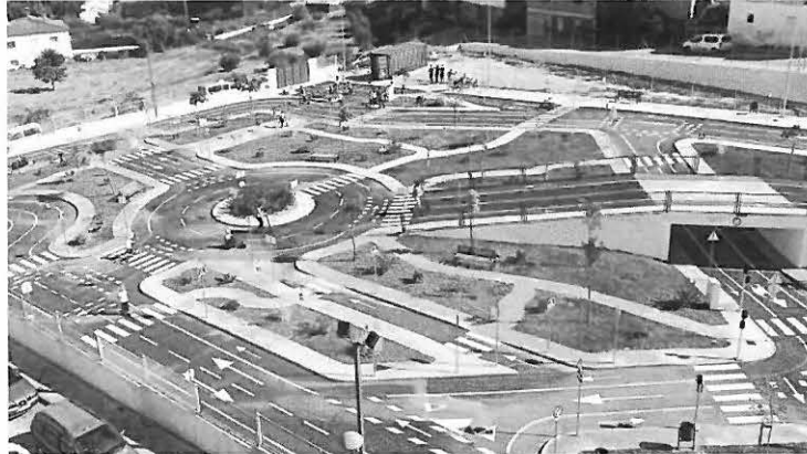
Vista aérea del parque infantil de tráfico