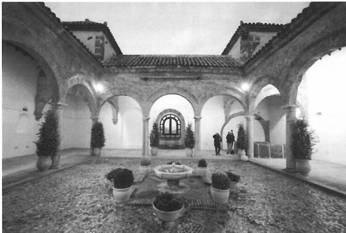
Vista nocturna de las Carnicerías Reales

En la planta sótano, se disponen dos carriles electrificados suspendidos de la bóveda mediante cables de acero. Se incluyen proyectores