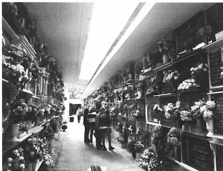
Cementerio de Priego el día de los difuntos

Dentro de la delegación de juventud se llevaron a