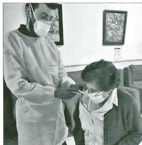
Vacunación de una residente para la covid-19

En mis años de sacerdocio, han sido los momentos de más impotencia que he vivido. Y junto a esa impotencia, el miedo de los contagios, y de las posibles muertes que gracias a Dios no se dieron, el contrato de más trabajadores, el gasto de material covid... hicieron que más de 70.000 euros del fondo de la fundación se gastarán, viéndonos en la necesidad de pedir. Nunca me ha dado vergüenza pedir, menos aún si es para los necesitados, y el hospital S. Juan de Dios lo necesitaba y teníamos que hacerlo. Y una vez más, la gente buena de este pueblo y de muchos otros sitios salieron en nuestra ayuda; empresas, hermandades, familias... aportando su granito de arena. Hoy, desde estas líneas os lo agradezco de corazón. En cambio, como un regalo del cielo la Fundación Mármol no ha tenido ningún contagio a lo largo de todo este tiempo. Sin duda están siendo momentos difíciles, pero siempre encontramos en la fe y en la esperanza, un motivo para seguir adelante.