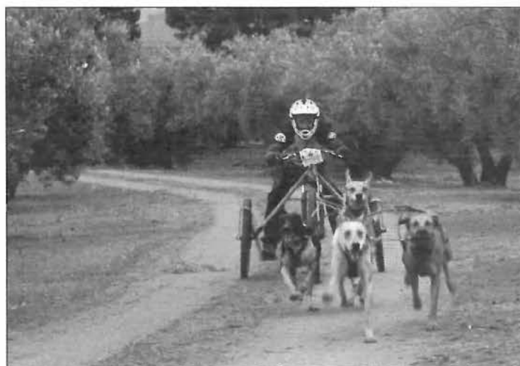
Instantes de la prueba