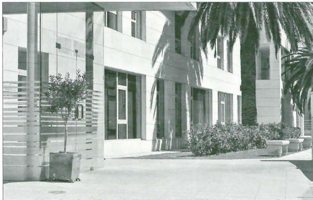
Residencia Arjona Valera