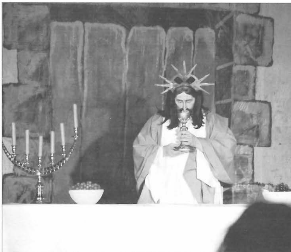
Representación del Prendimiento

La humanización del personaje de Jesús, interpretado por el párroco o el sacerdote de la iglesia de San Francisco, es otra de las