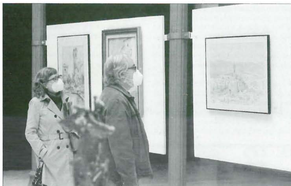
Visitando la exposición