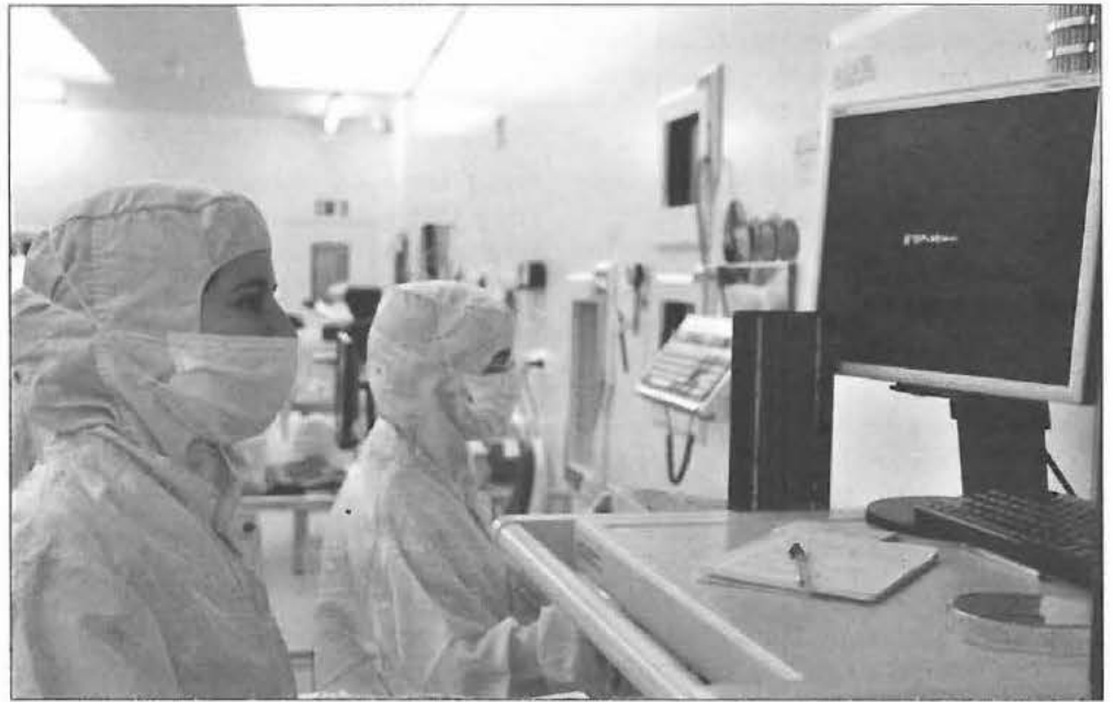
Trabajando en la Sala Blanca

Pues fíjate, en concreto la investigación que hemos publicado en la revista Nature Materials , nos ha llevado más de 7 años. De hecho, la investigación ya había empezado antes