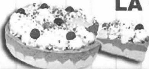
TARTA NEVADA DE TURRÓN