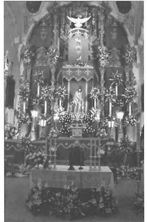
Altar de la Columna

Con la llegada del fin de semana, el retablo se vestía de un abundante exorno floral, como es tradicional, y compuesto por liliums y gladiolos en tonalidad blanca. Co-