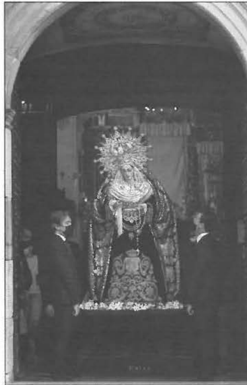
Virgen de la Soledad

Recogía el testigo la hermandad columnaria, comenzando el septenario a Jesús en la Columna el lunes, 17 de mayo. Para ello, la