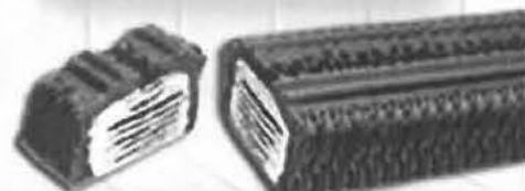
CRUJIENTE CHOCO Y NATA

ESTE AÑO SÓLO LAS ENCONTRARÁS EN CARRERA DE LAS MONJAS 13 FRENTE ALMACENES SILES