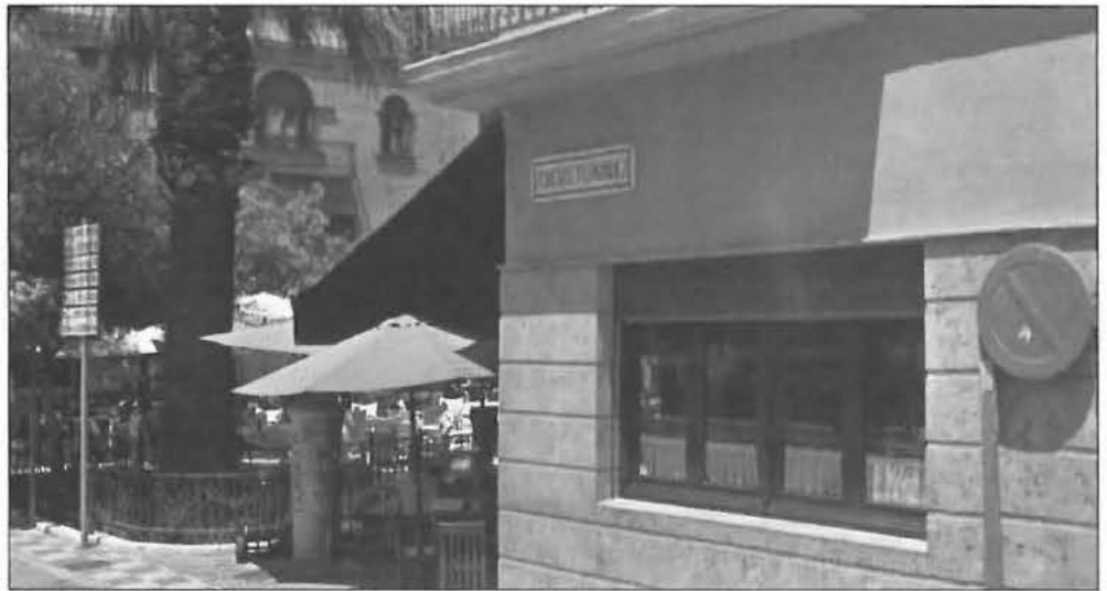
Calle del Teniente Fernández en Cabra

Cuando se fumaron el cigarro el pastor se levantó, antes de irse mi padre le dio varios celtas cortos, lo cual agradeció el muerto viviente con muestras de afecto. Aquella conversación se me quedó grabada, nada sabía yo de