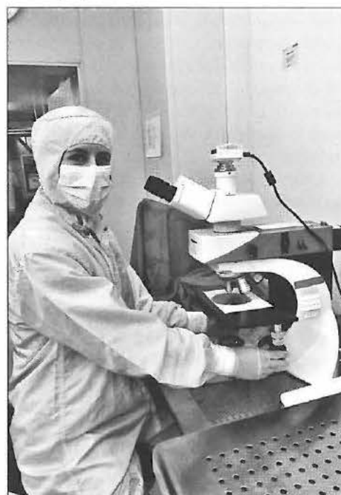
Inspeccionando unas muestras en el microscopio óptico en la Sala Blanca