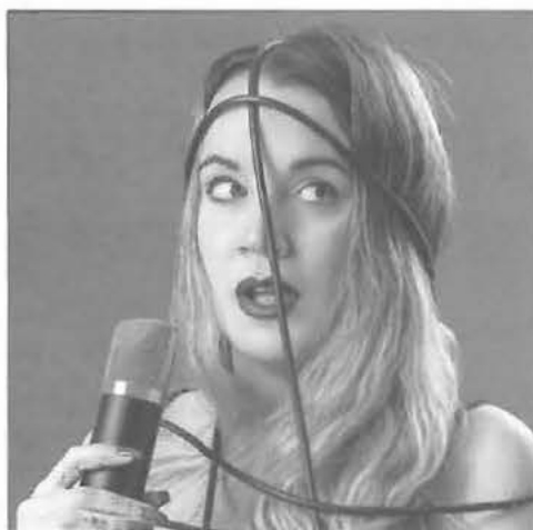
La cómica Martita de Graná