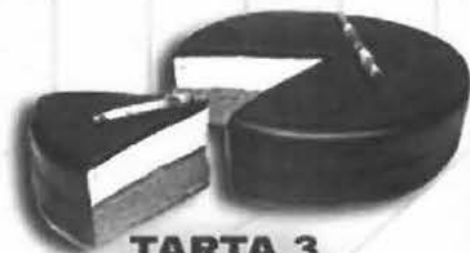
TARTA 3 CHOCOLATES