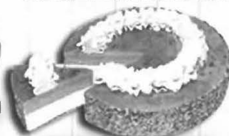
TARTA AL WHISKY