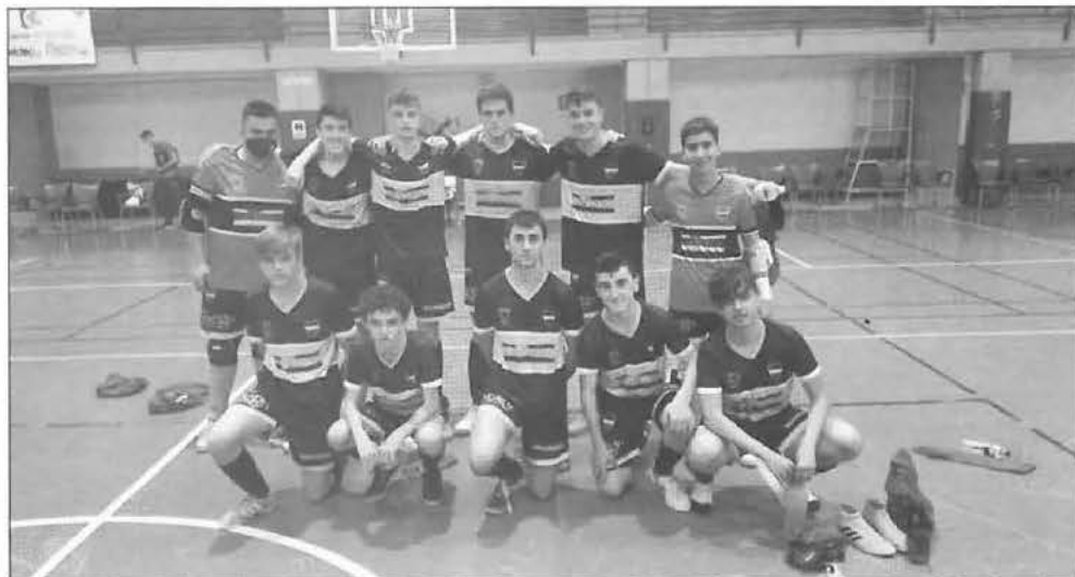
Equipo cadete del Boca FS Priego