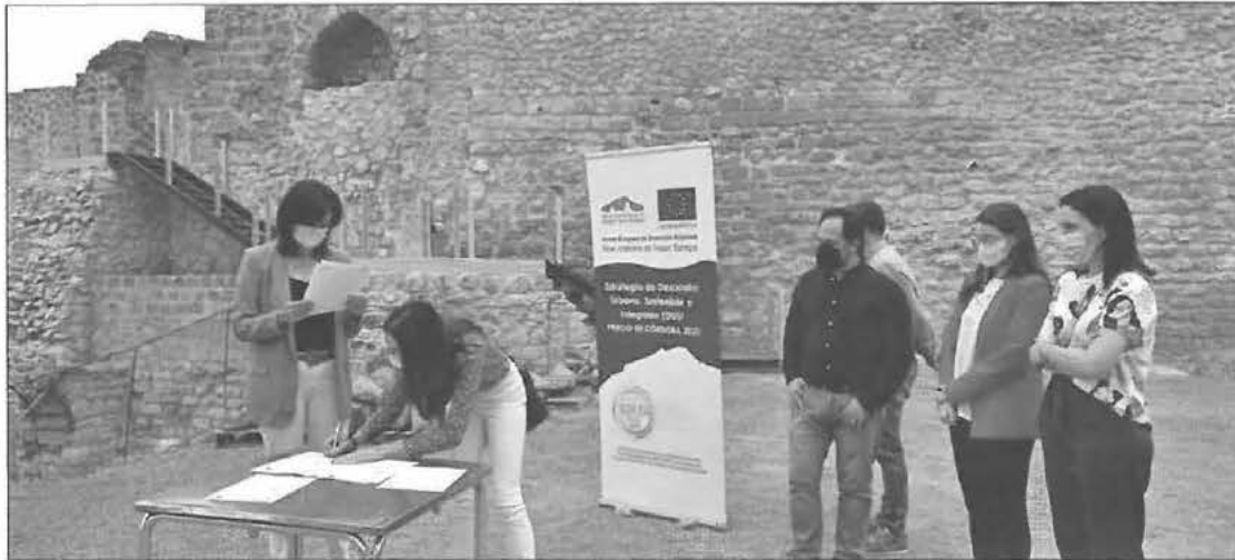
Recepción de las obras