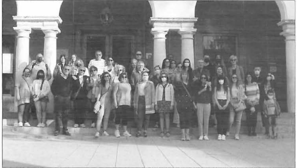
Recepción del grupo Comunicar en el Ayuntamiento