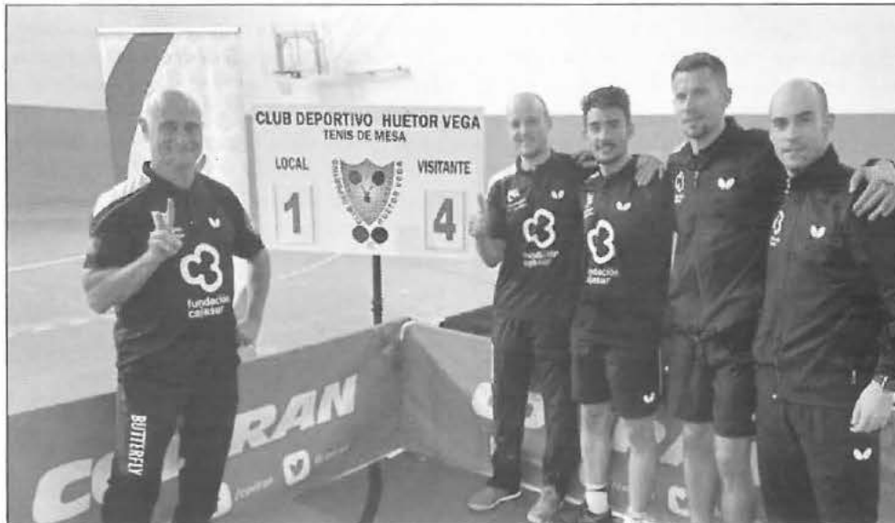
El entrenador y los jugadores tras terminar el encuentro