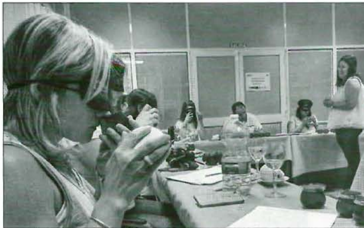
Curso de cata (foto de archivo)

El curso, teórico-práctico, se realizará en la sede de su Denominación de Origen, Avda. Niceto