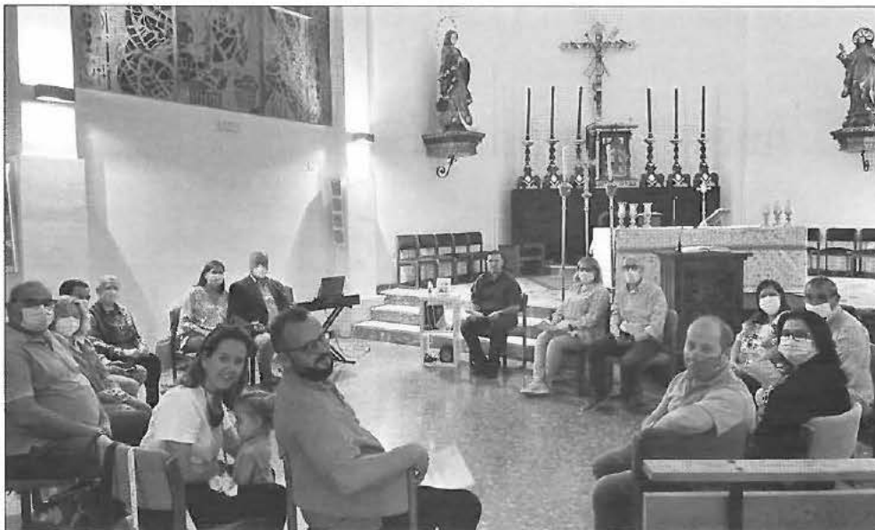
Una de las reuniones de catequesis en la Trinidad