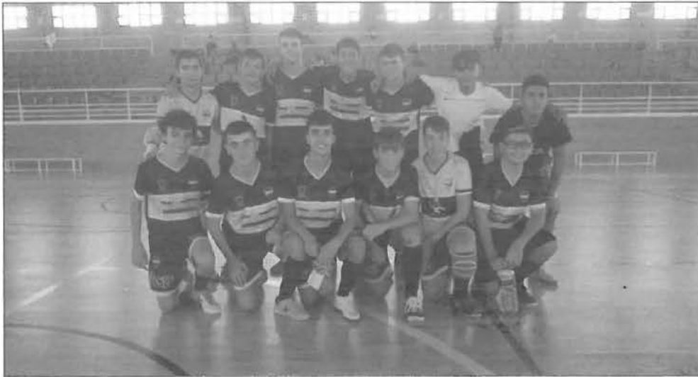
Equipo cadete del Boca FS Priego