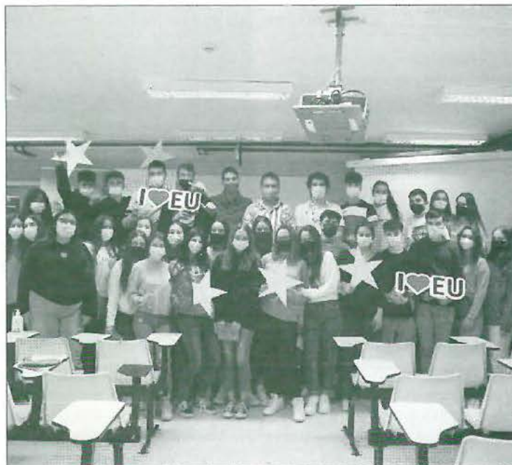
Jornada llevada a cabo en otro municipio

Las actividades se enmarcan dentro del plan de actividades de la Red de Información Juvenil de Andalucía (RIEA) y están subvencionadas por la Consejería de Presidencia, Administración Pública e Interior. La actividad está impulsada por la Diputación y organizada por la Academia de Debate Aljefe.