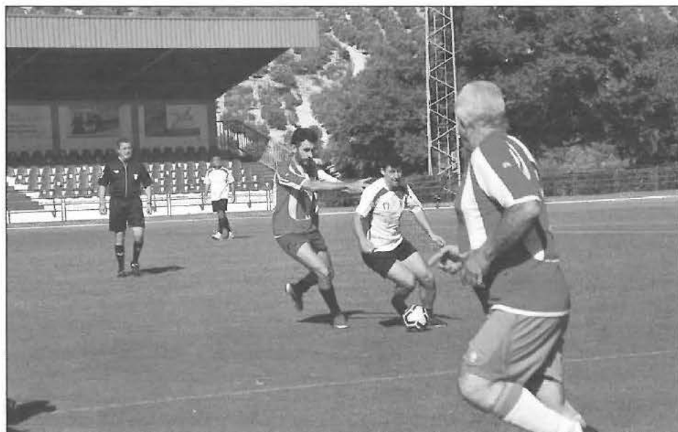
El defensa del Veteranos de la Milana disputa un balón entre dos jugadores del Bar Tomasín

En cuanto al resultado del partido al final de los dos tiempos, cada uno de ellos de 40 minutos, el marcador del campo de fútbol mostraba un 2-1 a favor del Club Bar Tomasín, no obstante, y aunque fuese el partido amistoso, estuvo lleno de polémica sana, al no validarse un gol legal que hubiese supuesto el empate del partido y por tanto la prórroga o penaltis.