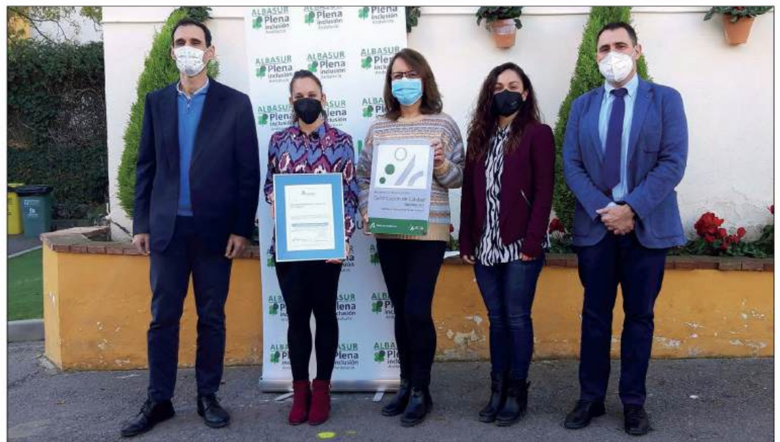
Representantes de Albasur recibiendo el reconocimiento