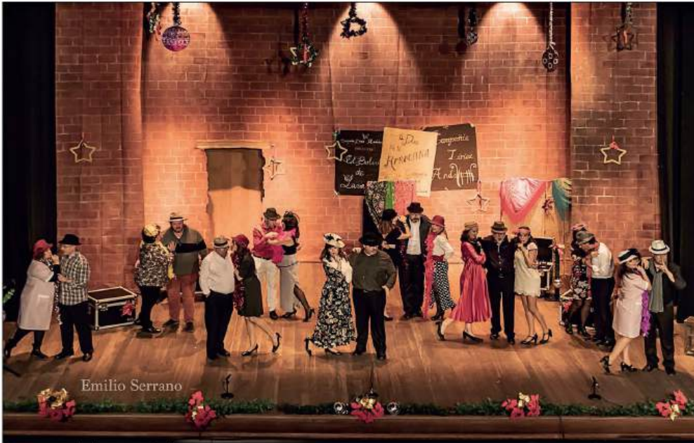
Momento del espectáculo