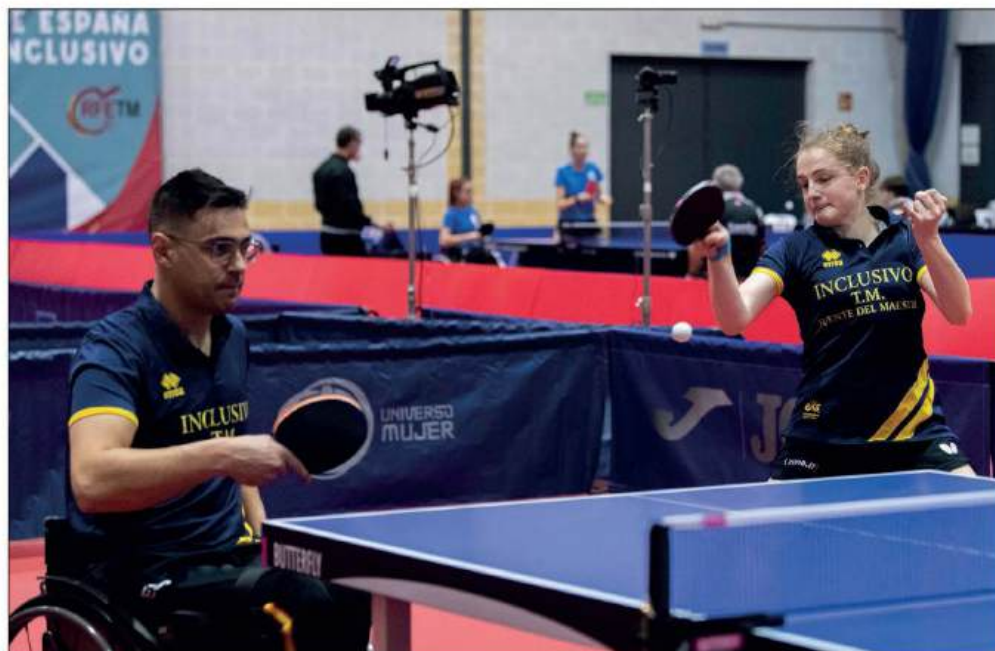
El equipo campeón, CTM Villafranca, disputando un punto