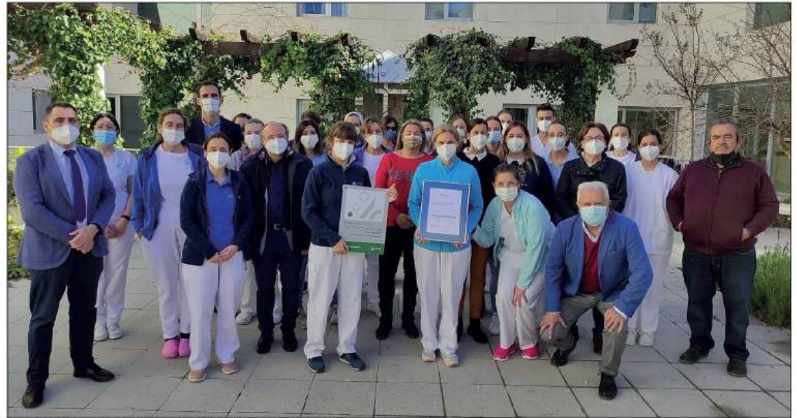
Representantes de Arjona Valera posando con el reconocimiento

La Fundación Arjona Valera ha finalizado con éxito el proceso de certificación de sus servicios con el logro de un nivel Avanzado para sus residencias de Mayores y Personas con Discapacidad Gravemente Afectadas y para el Centro de Día San José. El equipo evaluador ha comprobado la calidad de los procesos del centro en aspectos como la seguridad, la intimidad, los servicios de soporte y el trabajo en equipo de sus profesionales, poniendo de relieve su alto grado de implicación y el esfuerzo realizado, destacando que todo este recorrido se haya llevado a cabo precisamente en estos meses tan duros de pandemia. Entre las fortalezas de la Fundación Arjona Valera se han destacado las siguientes: la seguridad del paciente, el uso de nuevas tecnologías, el control y seguimiento sobre los servicios de soporte, la buena iluminación natural del centro y especialmente la implicación, el trato, la cercanía y la cordialidad con que los profesionales del centro se