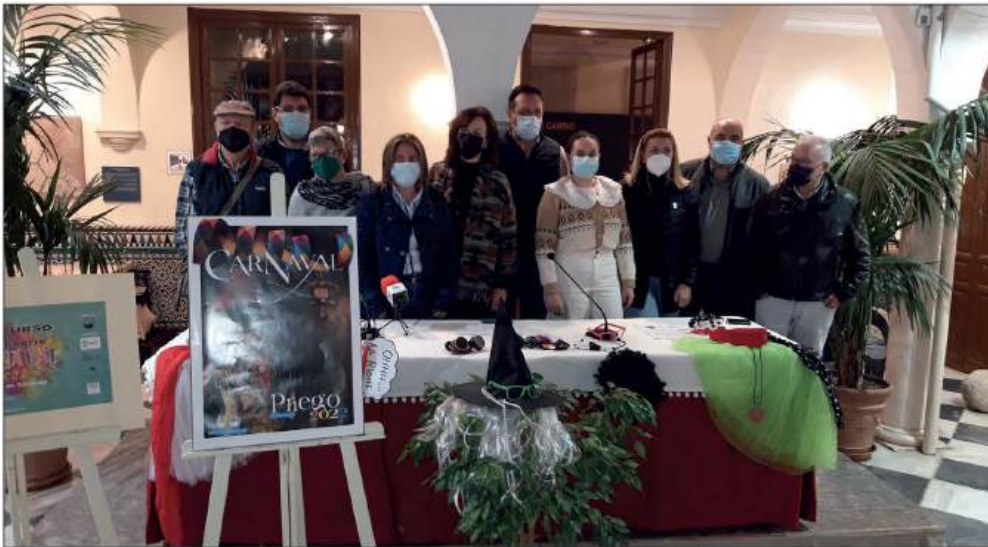
Acto de presentación del cartel