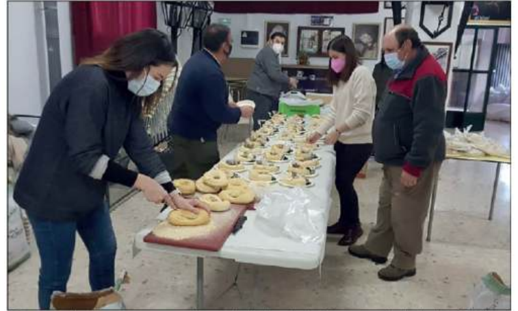
Entregando las roscoes en la candelaria de la Hermandad de los Dolores