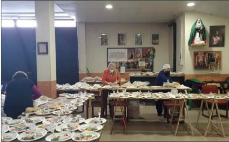
Preparación de las roscoes de la Hermandad de la Paz