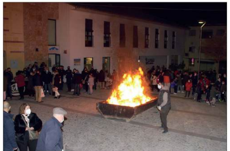
Candela de la Hermandad de la Soledad