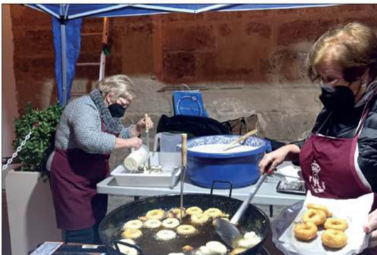
Friendo buñuelos en la candelaria de la Hermandad de la Caridad

Por último, el día 2 de febrero fue la Hermandad de la Soledad en la plaza de San Pedro, con una gran hoguera central y la distribución de las roscoes bendecidas acompañadas de bacalao, aceitunas y turrolate.