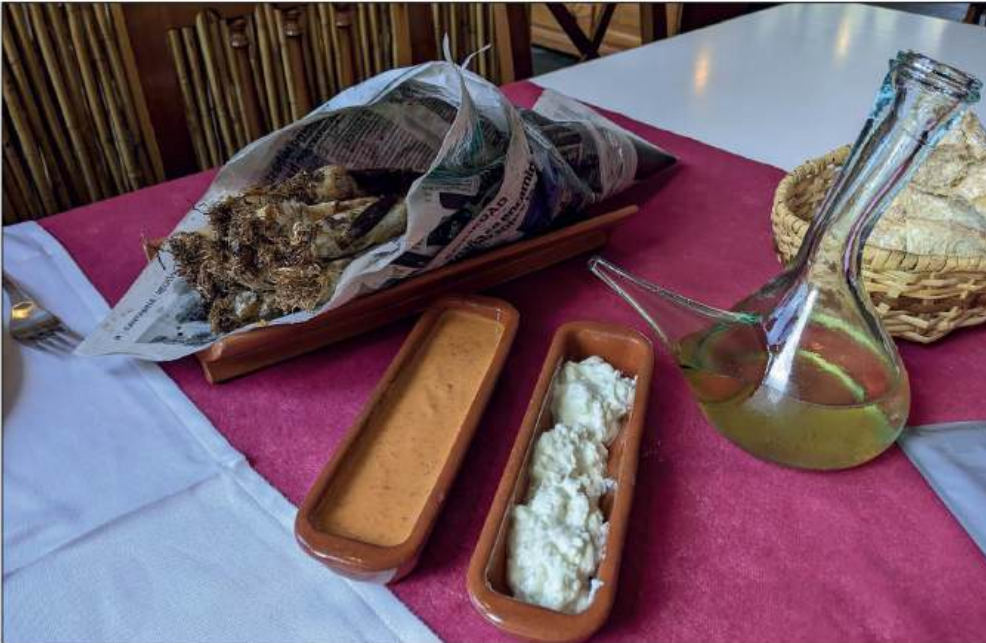
Calçots, salsa romescu (lo mejor del plato), alioli y el traicionero porrón de cava

Es curioso que cuando me preguntan mis aficiones siempre voy a lo fácil de «el cine, la música y salir con los amigos» o, si estoy más en confianza, admito mi afición desmedida por el origami, pero nunca cito la gastronomía. Y eso que creo que hasta el Papa de Roma sabe de mi afición a la gastronomía... o lo sabría si se diese una vuelta por mi Instagram o por alguna de las comidas que organizo en casa. Invitado está y que sepa que el chimichurri y la pasta frola se me dan de lujo. Ahí lo dejo.