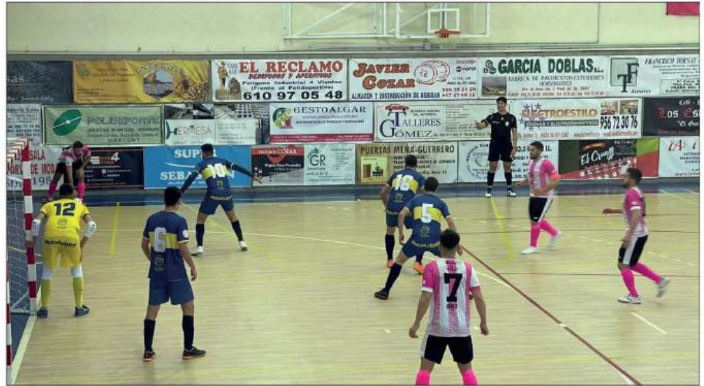
Boca FS Priego jugando en su partido a domicilio frente al Prado del Rey

En cuanto al equipo senior , que no estaba atravesando una buena racha, en parte debido a la acumulación de lesiones y sanciones, ha podido recuperar a su plantilla al completo y ha conseguido una importante victoria en su visita al Futsal Prado de Prado del Rey (Cádiz). Fue un partido muy intenso donde se llegó al descanso con empate a dos goles en