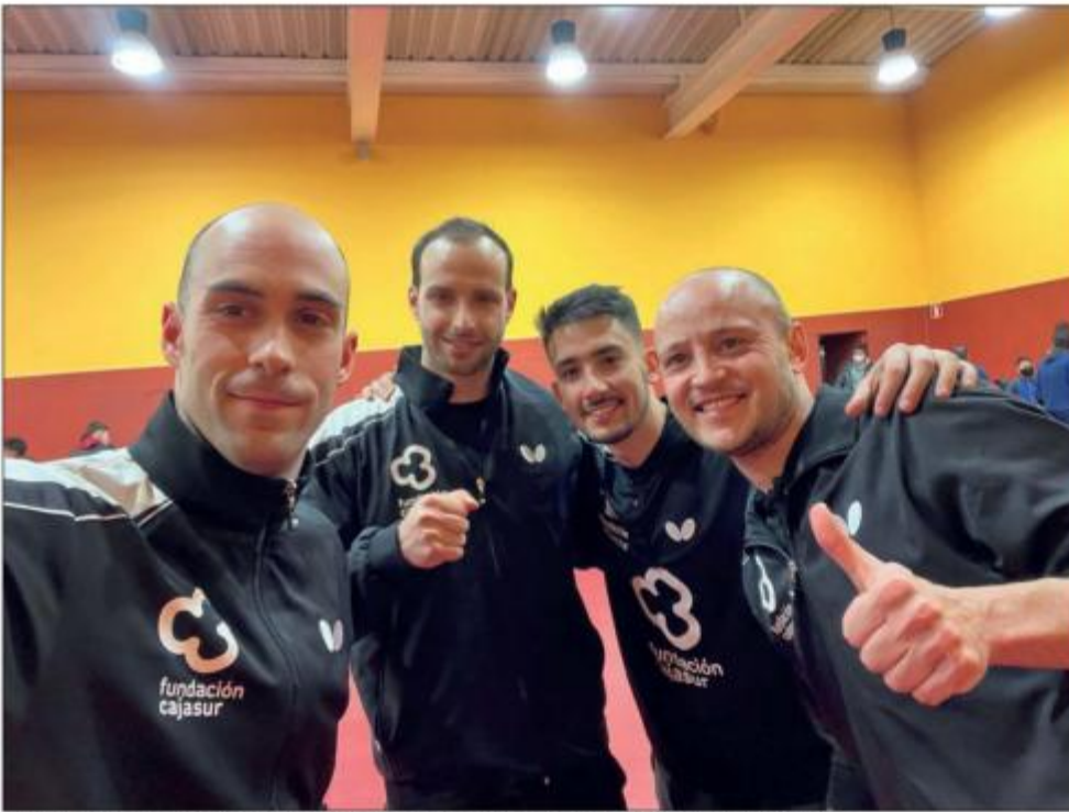
Los componentes del Cajasur Priego tras la victoria en San Sebastián de los Reyes.