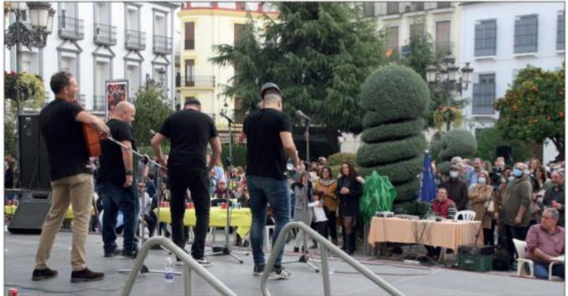
La actuación de Piquislavis congregó a un numeroso público en el Paseillo

La Rellená es una celebración carnavalesca que mezcla la música y la gastronómica. Este año la fiesta musical ha estado amenizada por el grupo Piquislavis, formada por componentes de la chirigota de Cádiz de «El Sheriff». Como complemento estrella sobresalió la degustación del famoso «relleno de Carnaval», un embutido típico de Priego que se confecciona con carne picada, miga de pan y huevos ade-