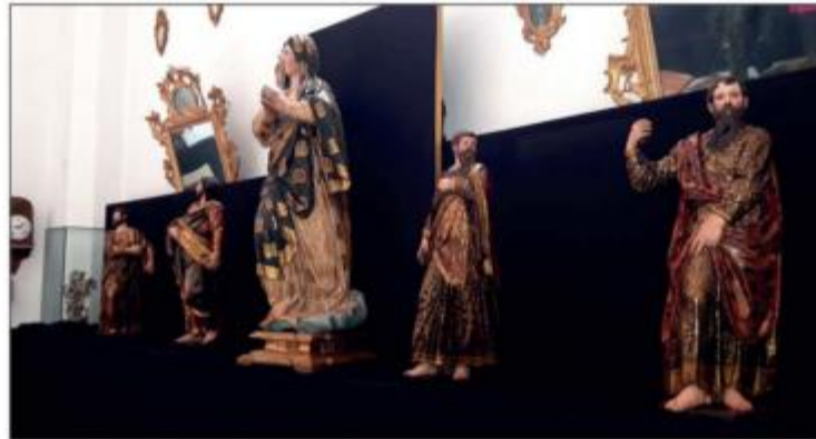
Exposición de las imágenes del retablo