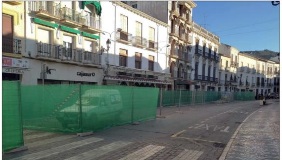
Vista del estado actual de las obras

Las obras, cuya denominación oficial es «Rehabilitación integral y puesta en valor de la calle Río de Priego de Córdoba» tendrán una duración de once meses y van a abarcar una renovación completa de las infraestructuras y servicios presentes en la calle Río. Esto abarca, entre otras: red de abastecimiento y distribución de agua potable, red de saneamiento separativa de aguas pluviales y residuales, red de riego y el soterramiento de las líneas eléctricas aéreas, para mejorar el impacto visual de esta calle tan singular del municipio. Así mismo, se ejecutará la urbanización en superficie de la calle según las directrices marcadas por el Área de Urbanismo del Ayuntamiento, según las