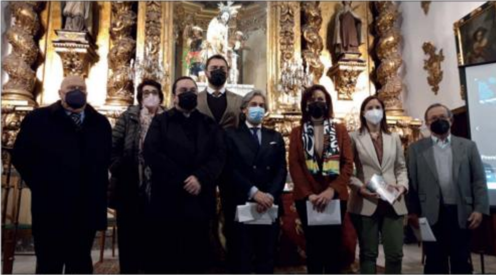
Autoridades civiles y religiosas presentes en el acto