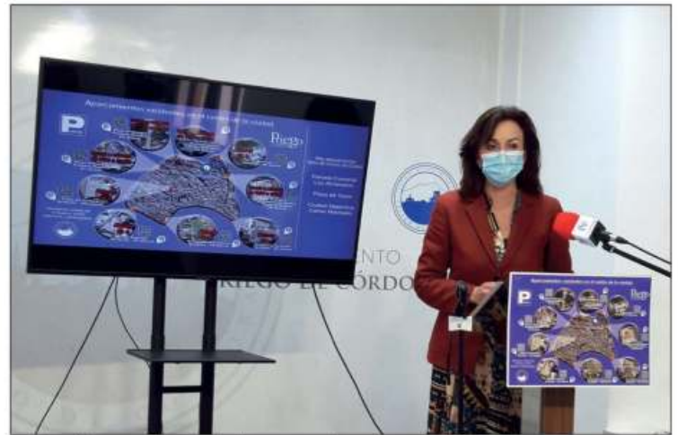
La alcaldesa en la rueda de prensa de presentación del mapa

24 horas, están los de la calle Cañada con 25 plazas, los de la calle Cardenal Cisneros con 39 y los de la Casa de la Cultura, que antes solamente era para uso del Conservatorio, estimándose entre 35 y 40 plazas de aparcamiento. A ellos habría que sumarle los existentes en la