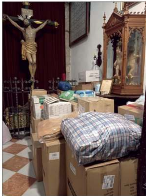
Donación organizada por la Hermandad de la Caridad

Pues me gustaría decir que para mí todo esto es muy duro. Yo no estoy preparada para una cosa así... Solo quiero agradecer al pueblo de Priego la ayuda que nos ha prestado y pedirle que no nos olvide.