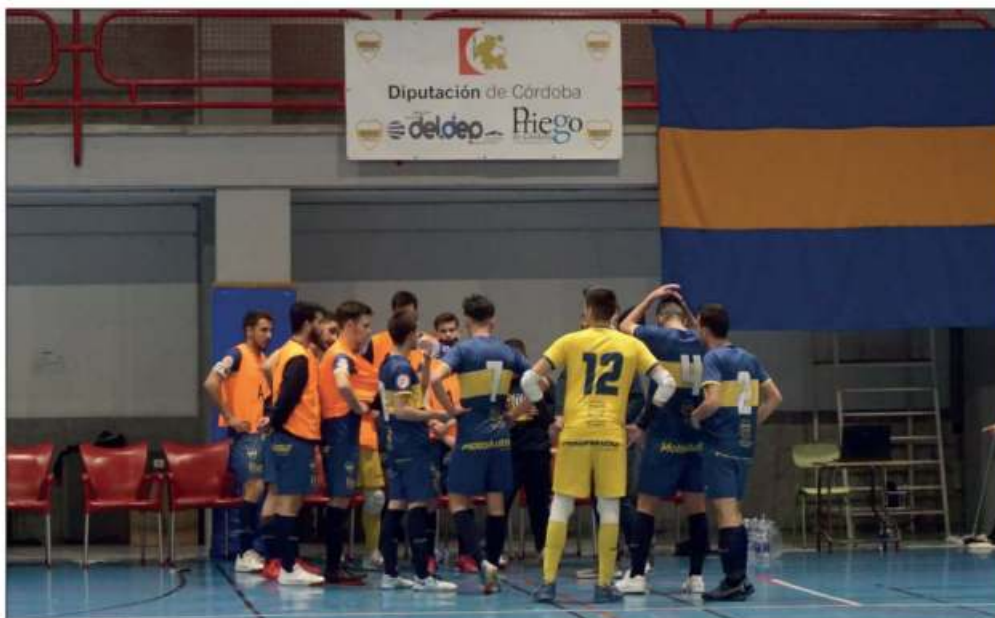
Boca FS Priego en su partido en casa frente a Prado del Rey

En cuanto al equipo cadete, continúa liderando su grupo tras obtener un empate