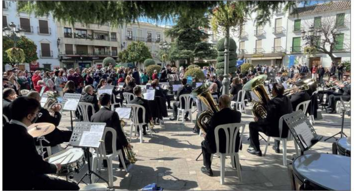
Concierto de la banda de la EMMD en el Paseillo