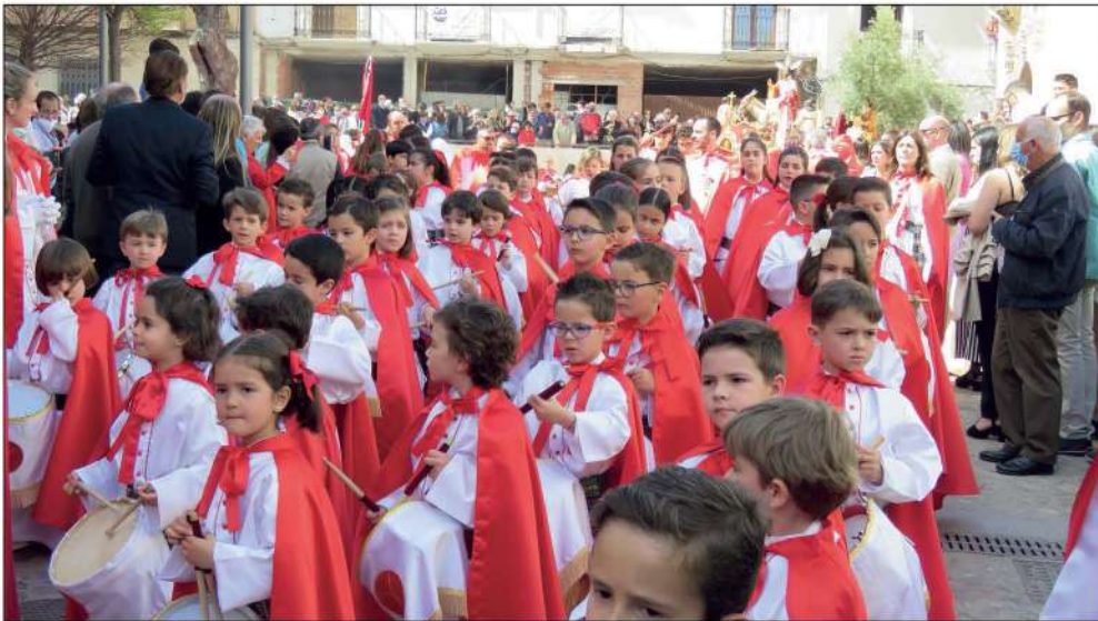
Banda infantil de la Pollinica