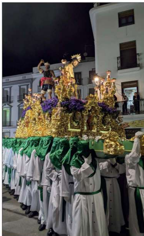
Jesús en la Columna

El Jueves Santo volvió a lucir el sol y la Archicofradía de Jesús en la Columna pudo realizar su estación de penitencia. Este año la Virgen de la Esperanza estrenó una nueva candelera en su trono y estuvo acompañada musicalmente por la Banda de la Escuela Municipal de Música y Danza de Priego. Por su parte, el cuerpo de costaleros de Jesús en la Columna lució nuevas túnicas. Asimismo, la cofradía de los Dolores pudo