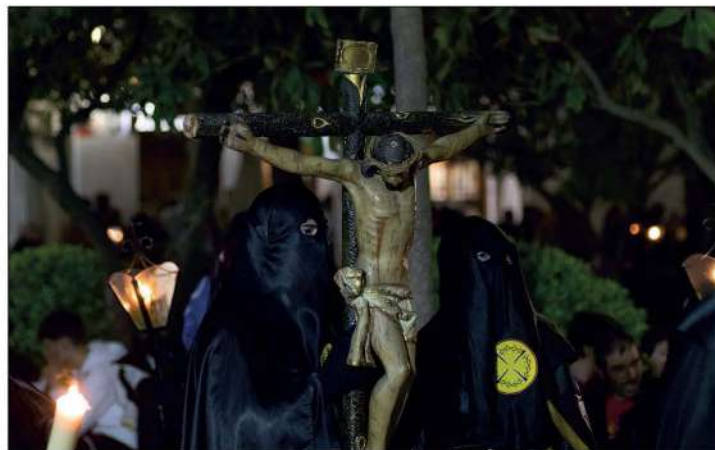
Penitentes en el Santo Entierro

En la tarde noche, la hermandad de las Angustias y de la Soledad realizaron recorridos completamente opuestos, si bien llegaron a coincidir en su último tramo en diferentes lados del Paseillo. Debido a las obras en la calle Río, la Virgen de las Angustias no pudo salir de su templo habitual y hubo de hacerlo de la iglesia de las Mercedes. En cuanto al paso del Descendimiento, la complicada salida del colegio de las Angustias debido a su envergadura volvió a retrasar un año más el comienzo de la estación de Penitencia. En cuanto a la hermandad de la