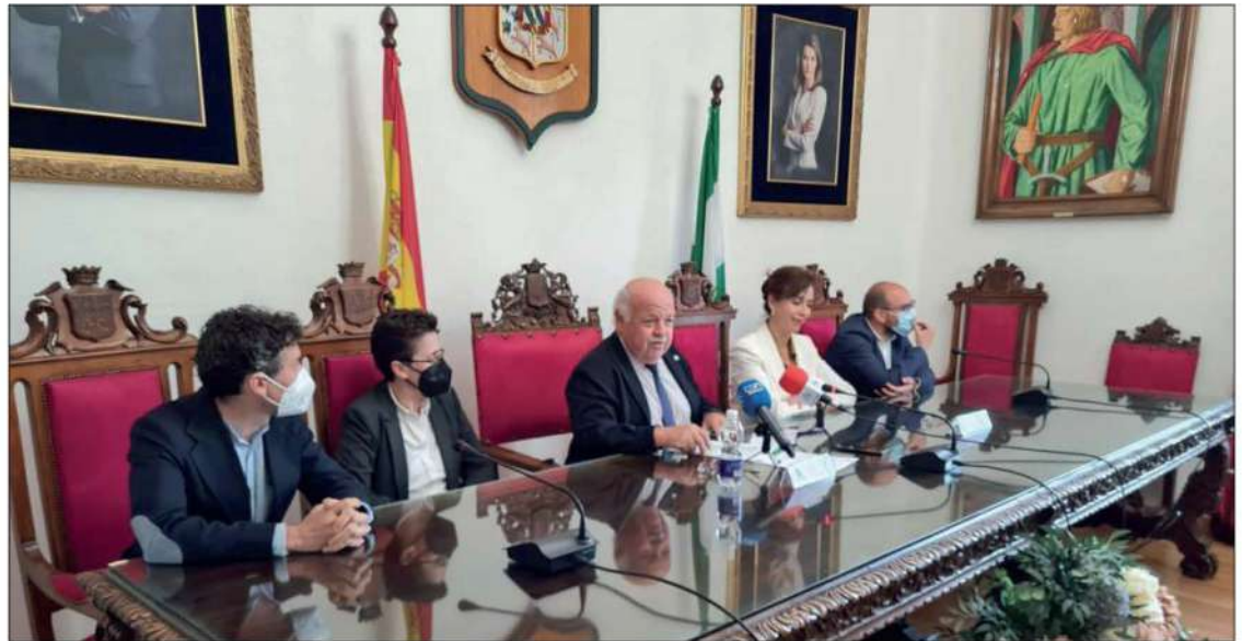
El consejero de Salud y Familias, Jesús Aguirre, en la sala de plenos del ayuntamiento

El Ayuntamiento de Priego, con este protocolo se compromete a facilitar la regularización catastral y registrar la parcela donde estará ubicado el nuevo centro