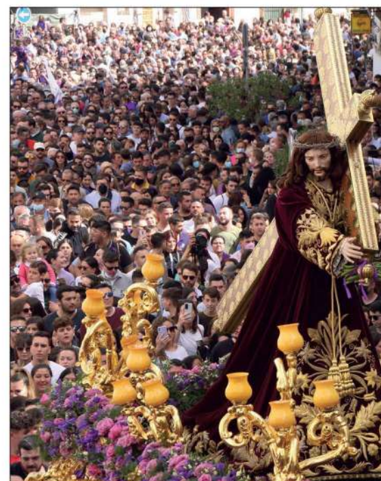
Jesús Nazareno en el paso ligero

El Miércoles Santo , el Prendimiento realizaba su primera representación tras ser declarado Bien de Interés Cultural por la Junta de Andalucía. Sin embargo, la hermandad del Mayor Dolor vio truncada su salida por la lluvia antes de estar la procesión al completo en la calle, por lo que tuvo que regresar con celeridad a su templo.