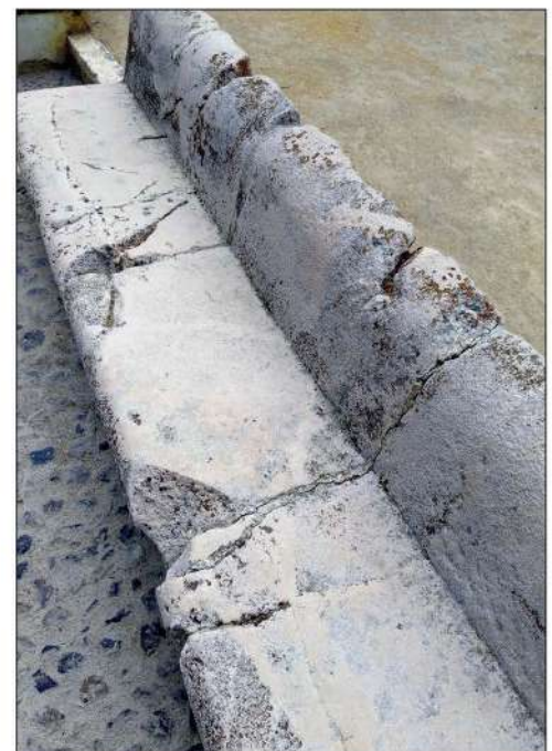
Estado anterior de los bancos

nes de temperatura en esta zona son muy grandes, ocasionan a menudo la rotura de fragmentos de la piedra. Otro factor de deterioro son las heladas invernales que provocan cuando en las grietas hay agua un aumento de volumen de la misma y en consecuencia su fractura y degradación.