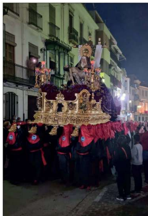
Virgen de las Angustias