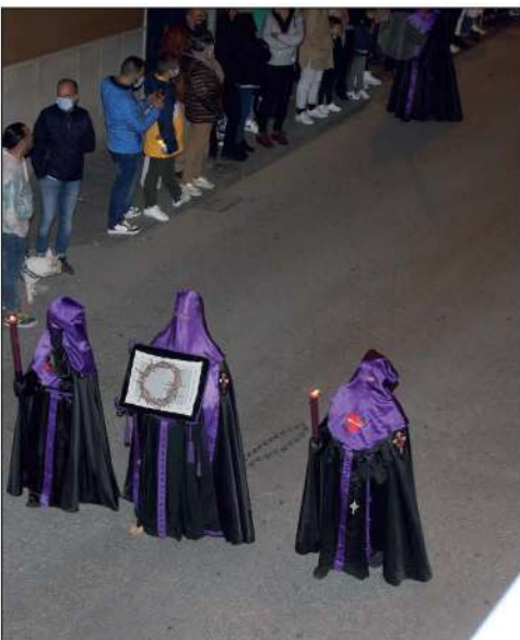
Penitentes de la hermandad de los Dolores

La suspensión por la pandemia de covid-19 de los desfiles procesionales en 2020 y 2021 motivó que la Semana Santa 2022 se viviera con especial intensidad en nuestra localidad. Por otro lado, la climatología permitió la realización de la mayoría de las estaciones de penitencia, eso sí, marcadas por el obligado cambio de recorrido debido a las obras de la calle Río. La lluvia solo impidió la salida de la Caridad en la noche del Martes Santo e hizo que el Mayor Dolor tuviera que regresar a su templo sin haber completado siquiera la salida.