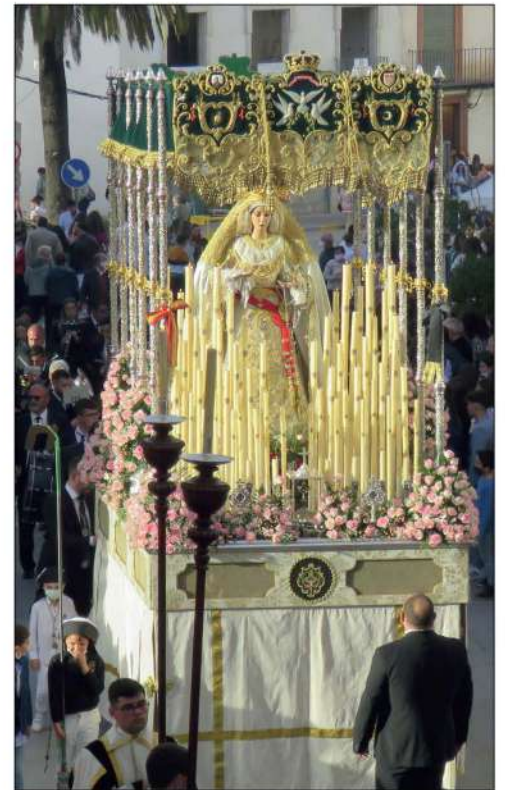
Virgen de la Paz a su paso por el Palenque

El Martes Santo , la hermandad de la Caridad se vio obligada a cancelar su estación de penitencia, aunque acogió en la parroquia de la Asunción a un gran número de asistentes que pudieron ver desfilar a sus titulares acompaña-