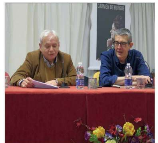
Miembros de AfoPriego durante la presentación

Una nota curiosa del libro es que el lector puede escuchar la versión que el autor comen-