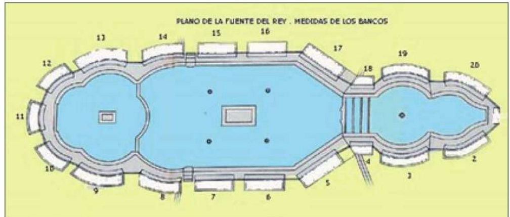
Medidas de los bancos

Cuando se terminó la Fuente se construyeron a su alrededor un conjunto de bancos de piedra para que los vecinos se sentaran a disfrutar de tan bello espectáculo. Los bancos están tallados en un bloque de piedra de caliza blanca. Se colocaron y se realizaron adaptados a la silueta de la misma, en unos casos curvos, en otros rectos, los situados en el centro y por último los hay que combinan las dos opciones. Hemos podido comprobar durante la restauración de las atar-