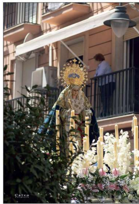
Virgen de la Cabeza

Soledad, ofreció una bella estampa en su paso alrededor del Paseo de Colombia. El acompañamiento musical de la Banda Sinfónica Soledad Coronada a su titular fue tan acertado como siempre. Por su parte, el Santo Entierro lució imponente en su tradicional urna.