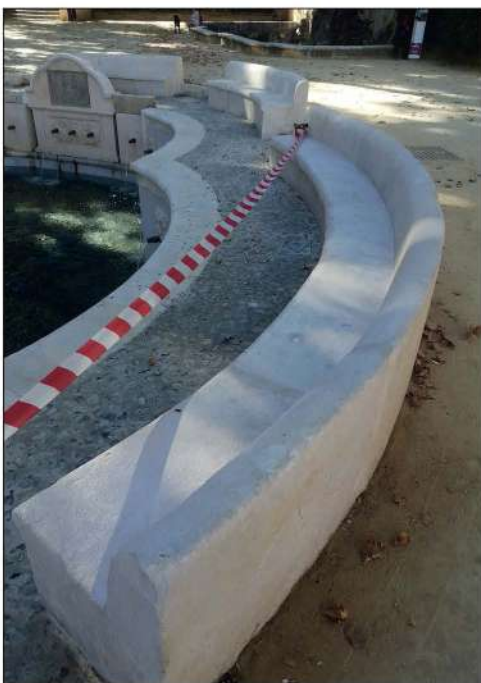
Bancos tras la restauración

Hay que destacar las numerosas lascas o capas de defoliación de la superficie de la piedra producidas por la acumulación de sales del suelo, que suben por el interior del material y se depositan en la superficie. Son las sales causantes del mayor deterioro al actuar constantemente provocando la caída de minúsculos fragmentos de piedra, debilitando su superficie. Son los causantes de la pérdida de detalles y del redondeado de las mismas y actúan conjuntamente con los otros factores de deterioro descritos. No podemos olvidar la acción humana que también intencionadamente o no, hace que se produzcan alteraciones. Se localizan grabados de varios tipos realizados con elementos metálicos de diversa índole. Localizamos numerosos puntos frecuentados