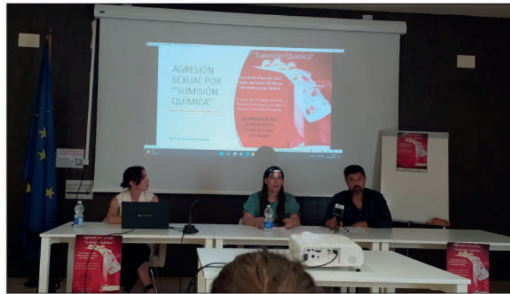
Charla en el CIE del pasado 26 de mayo

Los agresores operan de distintas formas para cometer este delito. La primera, sería administrando la sustancia psicoactiva para anular la voluntad de la víctima, es decir teniendo un comportamiento proactivo. Y la segunda de ellas, conocida como vulnerabilidad química, se produce cuando el agresor se apro-