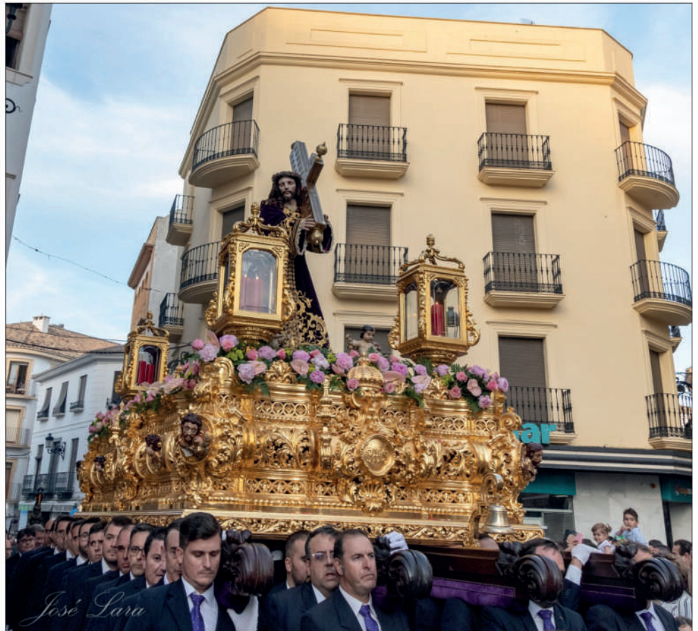
Jesús Nazareno a su paso por la plaza de Andalucía