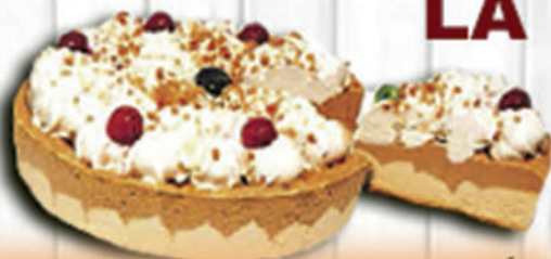
TARTA NEVADA DE TURRÓN