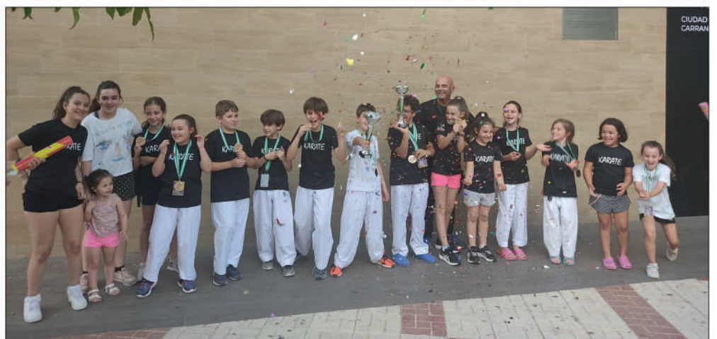
Deportistas del Shotokan Villoslada tras el campeonato

Por la tarde, tuvo lugar el Trofeo de Andalucía de equipos , en el cual los dos equipos mixtos presentados por el club se hicieron con