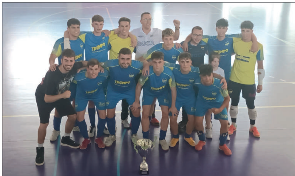
El equipo juvenil posando con el trofeo

Peor suerte corrió el equipo cadete , también campeón de su liga, y que por tanto, disputó igualmente la eliminatoria de ascenso a Primera andaluza, pero cayendo en este caso por 7-4 frente al San Pedro de Alcántara. Tampoco tendría fortuna el equipo infantil en la final de la Copa Diputación, saliendo derrotado por 7-1 frente al Córdoba F.S.