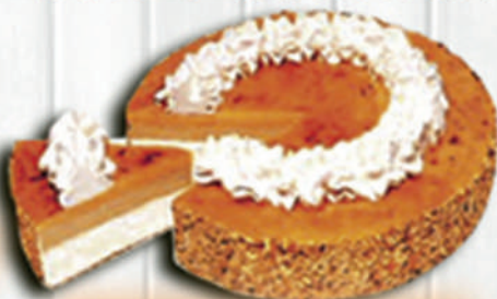
TARTA AL WHISKY