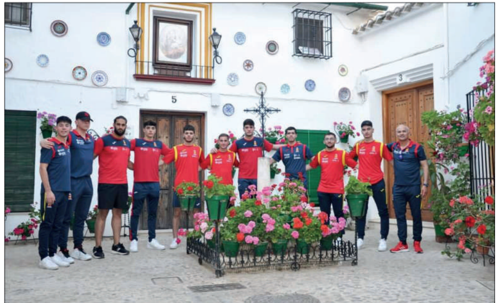
El equipo sub21 de kárate visitando nuestra localidad