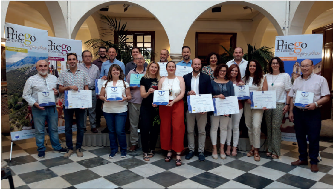
Empresas y profesionales distinguidos junto a las autoridades municipales