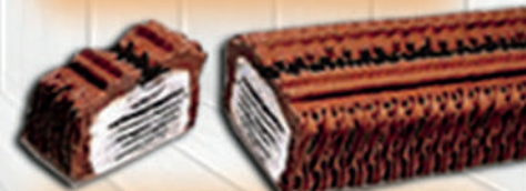
CRUJIENTE CHOCO Y NATA

ESTE AÑO SÓLO LAS ENCONTRARÁS EN CARRERA DE LAS MONJAS 13 FRENTE ALMACENES SILES