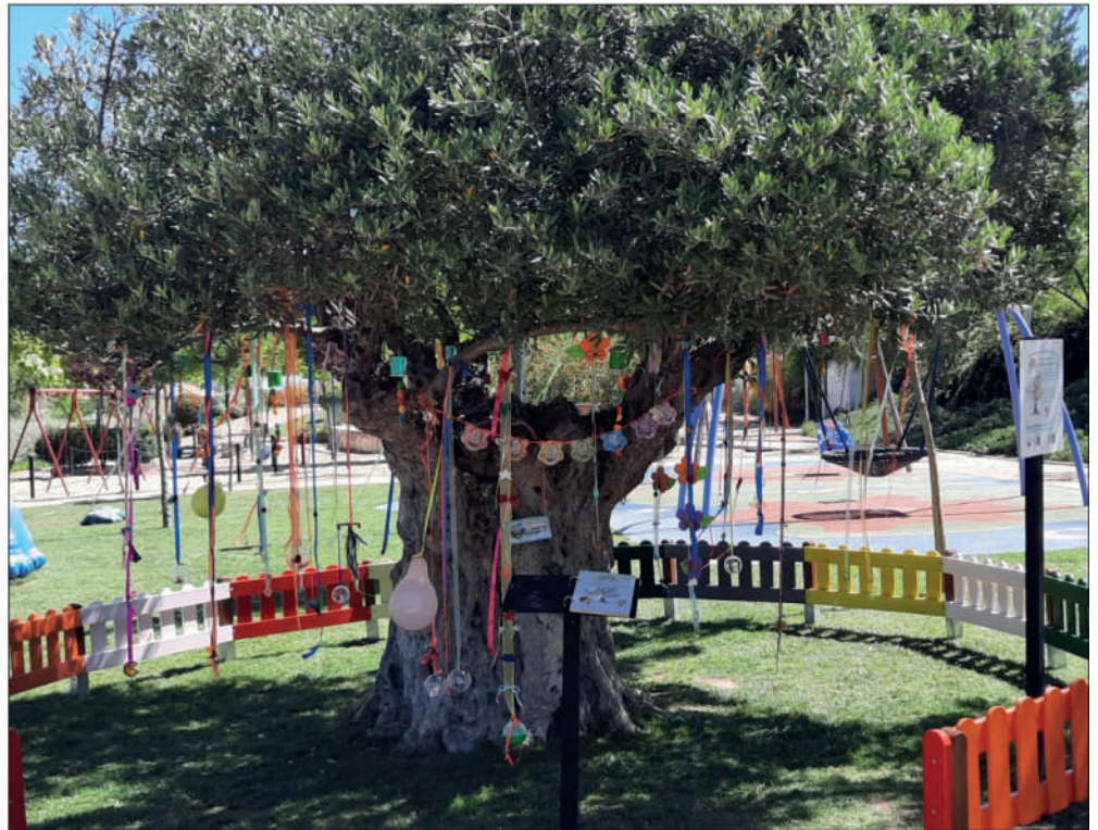
Tronquito, el árbol de los chupetes

Tras escribir mi primer cuento infantil «El virus del pilla-pilla», que queda incluido en otro de los proyectos llevados a cabo durante el confinamiento en nuestra ciudad, y en el que se narran las peripecias de la pandilla de «Covid», unos traviesos bichitos que no paran de perseguir a todos los niños y