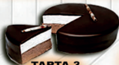
TARTA 3 CHOCOLATES