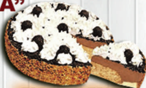
TARTA DE TRUFA