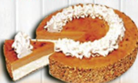
TARTA AL WHISKY