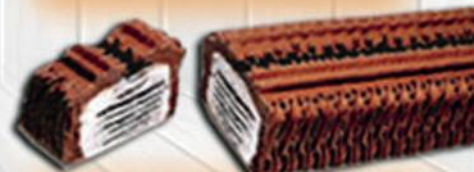
CRUJIENTE CHOCO Y NATA

ESTE AÑO SÓLO LAS ENCONTRARÁS EN CARRERA DE LAS MONJAS 13 FRENTE ALMACENES SILES