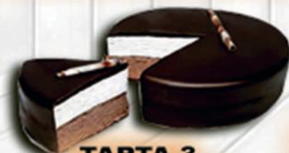
TARTA 3 CHOCOLATES