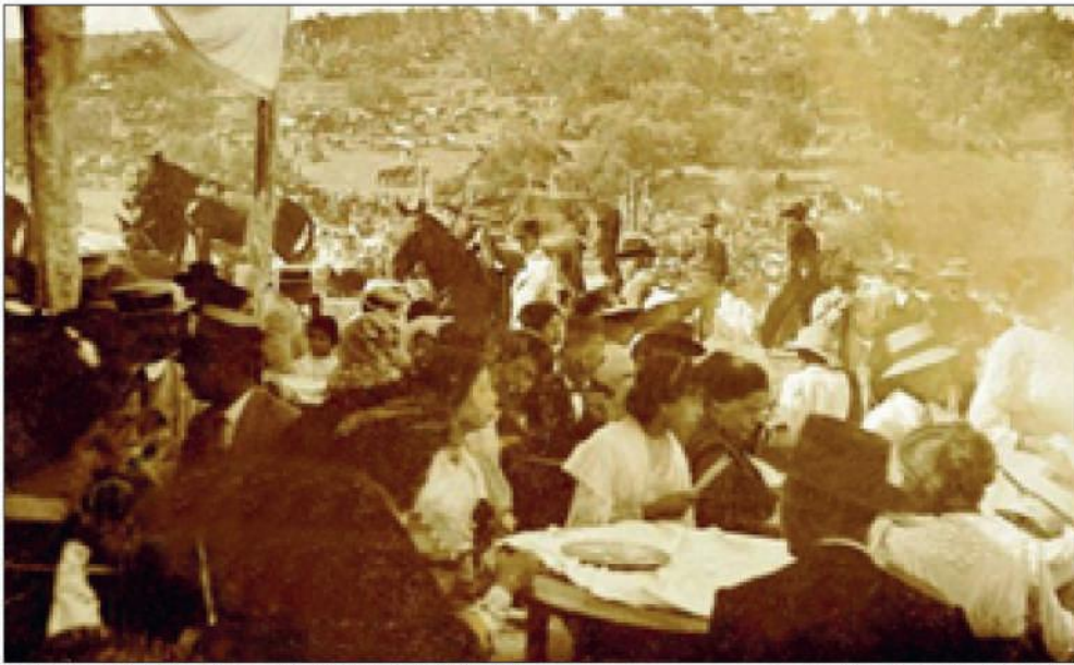
La feria del ganado a principios del siglo XX.