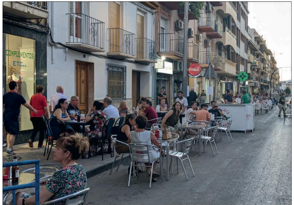
Ambiente en la Avenida de España

La programación de actividades en la calle fue variada: photocall, fotomatón, actividades infantiles (pintacaras, globoflexia, castillo hinchable) conciertos de grupos