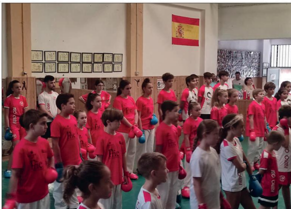
Alumnos del CD Shotokan Villoslada en Málaga

Una jornada de convivencia donde los alumnos pudieron practicar sus habilidades además de afianzar los valores de compañerismo y esfuerzo intrínsecos a este deporte.