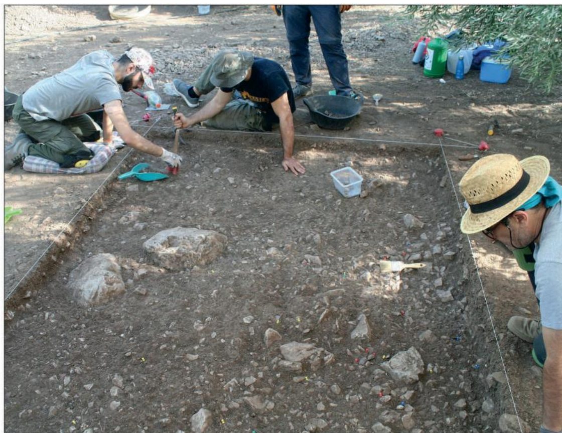
Trabajos arqueológicos realizados en Zamoranos

El Cerro del Cercado es representativo de los yacimientos al aire libre (y no en cueva) que cuentan con una ocupación del Neolítico Antiguo, es decir, del momento en el que se asentaron las primeras comunidades agrícolas en el sur de la península ibérica (VI milenio a.C.). En nuestra comarca estos emplazamientos suelen ser cerros o