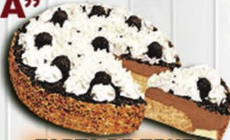
TARTA DE TRUFA