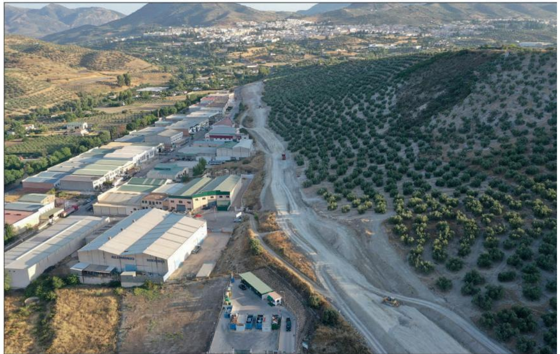
Vista aérea de las obras