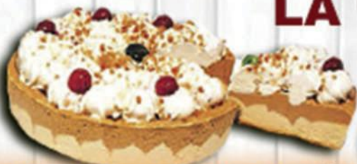
TARTA NEVADA DE TURRÓN