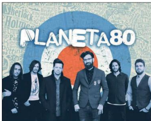
Planeta 80 cerrarán la Feria el día 5.

En la Caseta Municipal: 18:00 h. VELADA DE JAZZ. CONCIERTO-JAM SESSION «ASOCIACIÓN JAZZ P.C.».