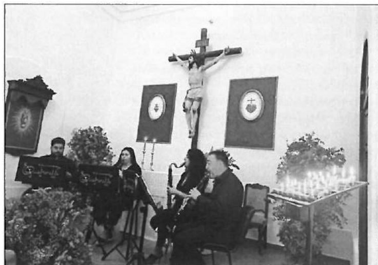
El cuarteto Quatrenette en su concierto de música fúnebre

En el apartado musical, los días 28 y 29 tuvo lugar el III Festival de la Canción Turismo de Priego, una actividad organizada por la Delegación de Festejos, mientras que el día 31, cuarteto Quatrenette ofreció un concierto de música fúnebre en la capilla del Cementerio, actividad organizada por el área de Cultura.