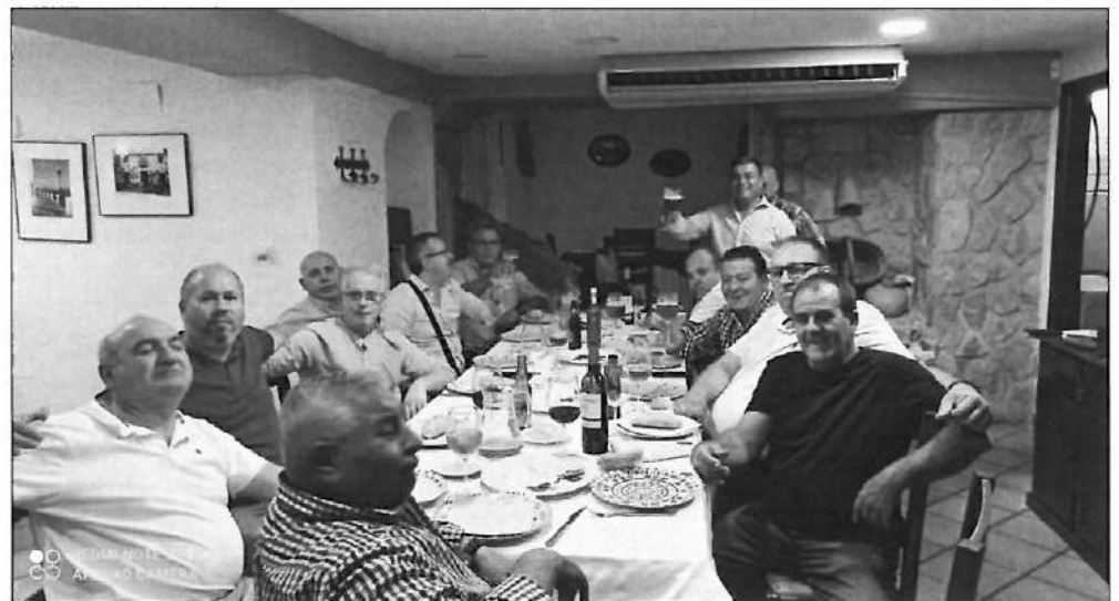
Encuentro celebrado el pasado mes de octubre