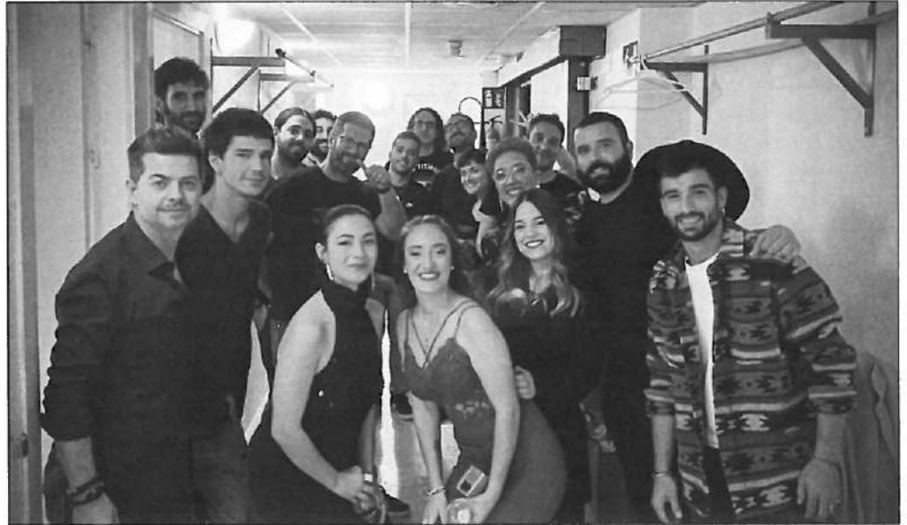
Los finalistas antes de comenzar la gala

Para la fase inicial, cada participante debía mandar, en cualquier formato de video, un tema original o versión. Los videos remitidos se han ido visionando progresivamente a través de las redes sociales. La fase final, previa selección de 8 de los participantes, se desarrolló en directo en el Teatro Victoria ce-