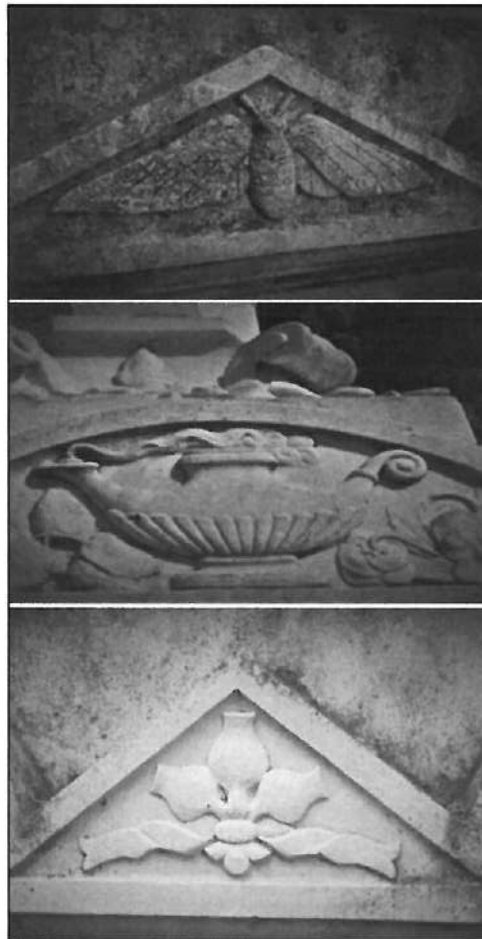
Símbolos de la polilla, lucerna y adormidera en el cementerio de Priego

Al entrar a nuestro cementerio la calle principal más ancha y rodeada de cipreses nos conduce hacia la cruz y la Capilla. Es en este espacio donde se encuentran los principales panteones familiares que mayor riqueza orna-