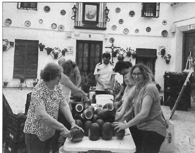
Vecinos de la Villa realizando la decoración

También el senderismo tuvo un lugar destacado en esta III Semana de Ánimas, incluyendo en su programación una ruta de senderismo Ermita de San Miguel, actividad organizada por la Delegación de Medio Ambiente el día 29.