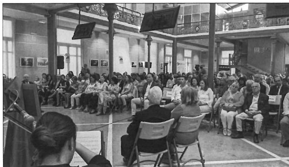
Público asistente al acto

lo largo de su vida tuvo varios reconocimientos: Prieguense del Año 2003, Medalla de Plata de la Ciudad 2004 y de la Subbética 2010.