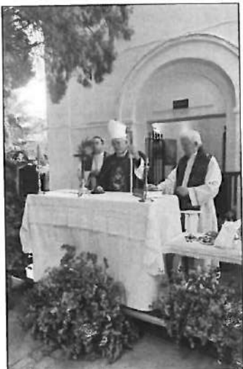
El obispo de Córdoba oficiando la Misa de Difuntos