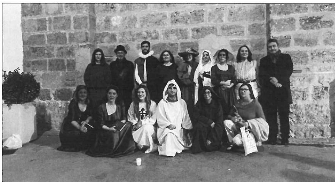
El grupo de teatro Argamasa en la actividad Pretérta Villa

Ha sido una programación amplia y caracterizada por la diversidad de actividades, motivo principal por el que numerosas personas han participado en ellas.