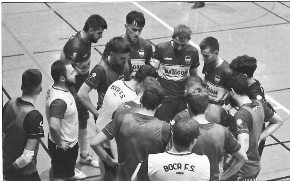
Tiempo muerto en el partido frente al CD Deporte y Ocio

También le ha costado encontrar la senda del triunfo al equipo cadete , el cual se reencontró el pasado fin de semana -jornada 7- con la victoria frente al Miragenil por 6-3, tras haber cosechado dos derrotas consecuti-