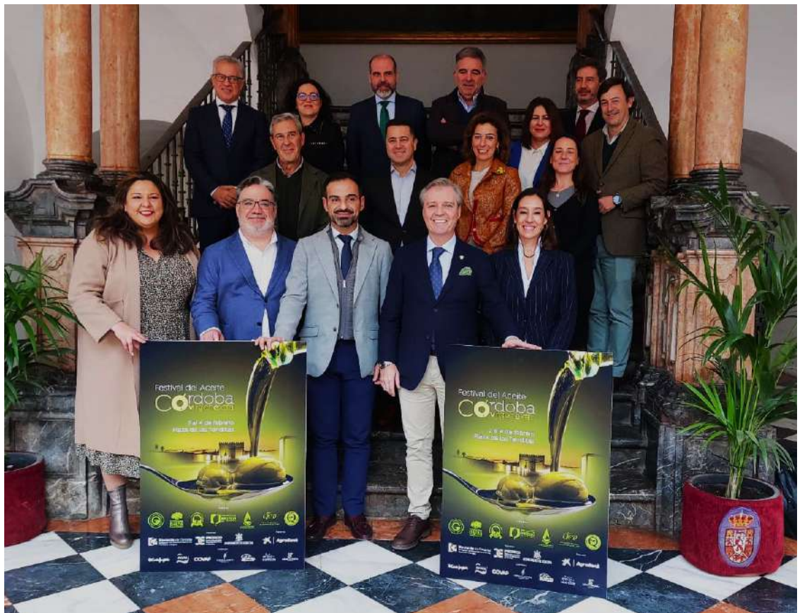
Presidentes de las distintas denominaciones de origen y responsables políticos

Córdoba Virgen Extra es más que un festival; es un nuevo concepto que destaca la excelencia histórica de nuestra tierra en la producción de aceite de oliva. Este proyecto, respaldado por la Diputación de Córdoba, "busca comunicar al mundo que somos líderes en calidad desde tiempos romanos hasta hoy" Así lo manifiesta la propia DEO de Priego en su comunicado.