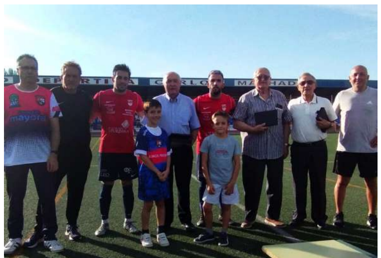
Homenajeados por el Priego

Sirvan estas líneas para unirnos a ese merecido homenaje a estos ilustres veteranos que pasearon el nombre de Priego por toda la geografía andaluza.