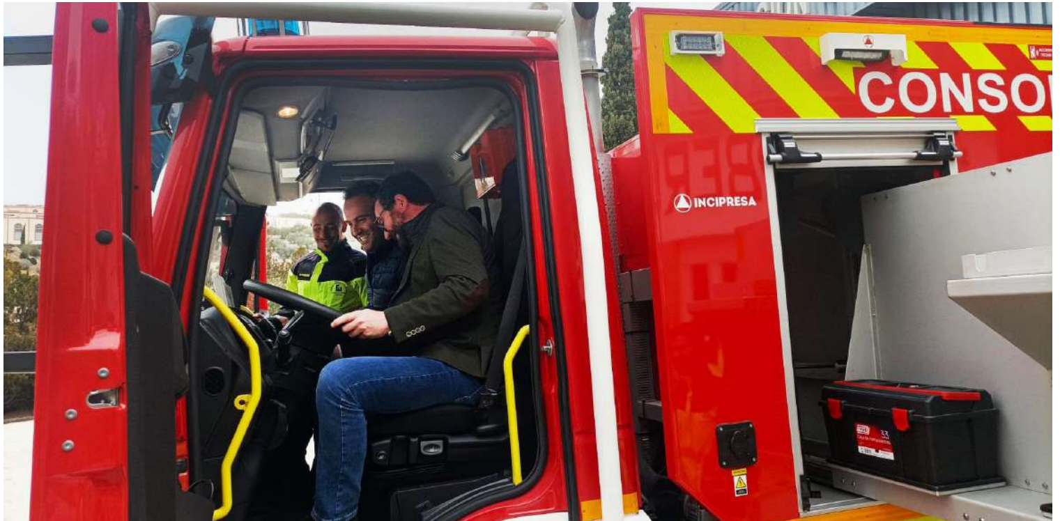
Eñ Diputado y el alcalde Valdivia observan detalles del nuevo camión