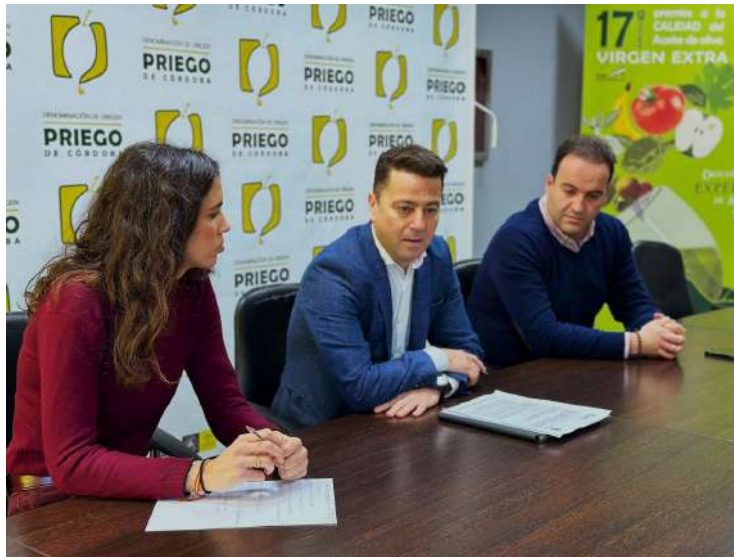
La Senadora Lorena Guerra con el presidente de la DO Rafael Muela

Guerra, en declaraciones a los medios de comunicación, mostró el apoyo del Partido Popular al sector primario en general y al sector olivarero de la provincia de Córdoba en particular. “Queremos conocer de primera mano los problemas que se encuentran en su día a día, y las necesidades que debemos salvar para que el sector crezca y genere riqueza y desarrollo económico para nuestros municipios. Los agricultores y ganaderos son los garantes de la continuidad de la vida en el