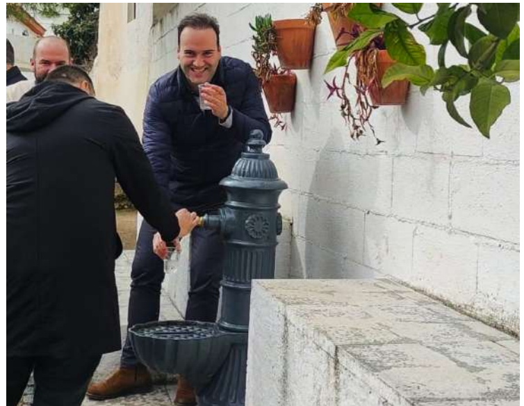
El alcalde bebiendo la primera agua del nuevo nacimiento

los vecinos, lo que le estaba suponiendo a las arcas municipales de Priego un gasto anual de 9.000 euros -según declaró el alcalde en el acto inaugural-. Por tal motivo se encargó un estudio -tanto por parte de un arquitecto como de una empresa dedicada a la prospección de sondeos- que finalmente dio su fruto satisfactoriamente, ya que a finales de mayo de 2023 se pudo conseguir en un lugar cercano a las dos aldeas un nuevo pozo con capacidad para poder suministrar agua potable. Desde el pasado mayo hasta el día de ayer, viernes 19 de enero ha transcurrido el tiempo necesario para comprobar que todas las analíticas realizadas eran aptas para su consumo y por tanto para poder legalizar el mismo. El total de gatos que se han derivado durante los casi 11 años para consumo humano en agua embotellada ha sido de 100.000 euros. Durante el último año