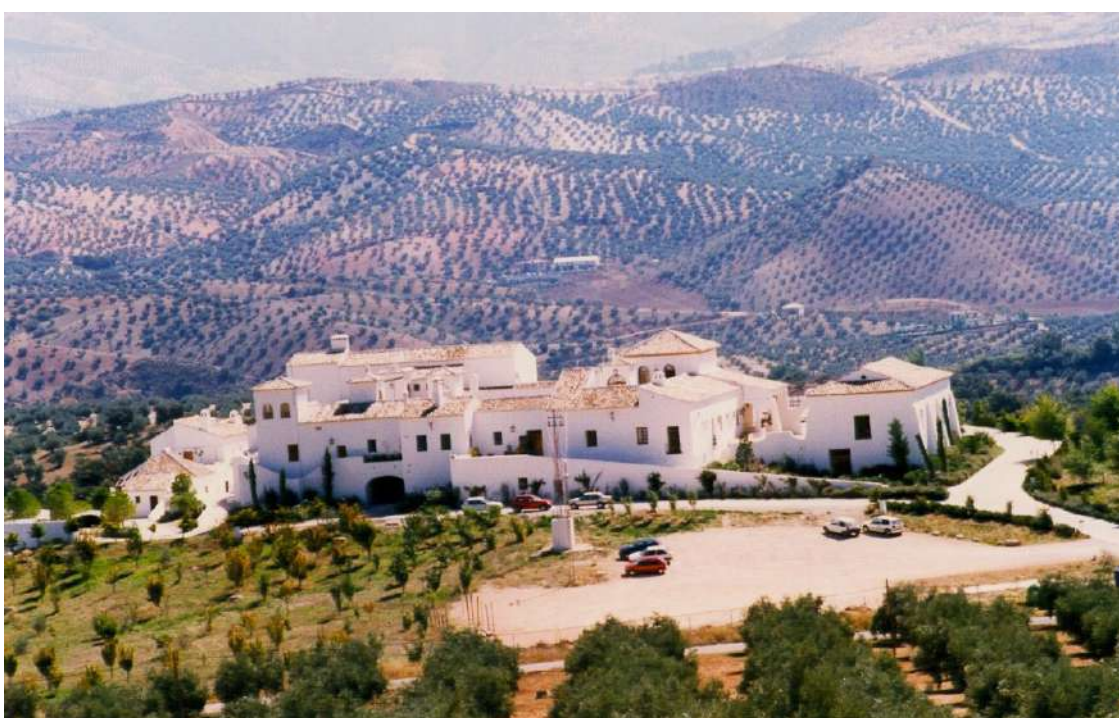
Vista panorámica de la Villa turística de Priego

paredes. Disfruta de una panorámica piscina de temporada, parque infantil y amplia zona de aparcamiento gratuita.