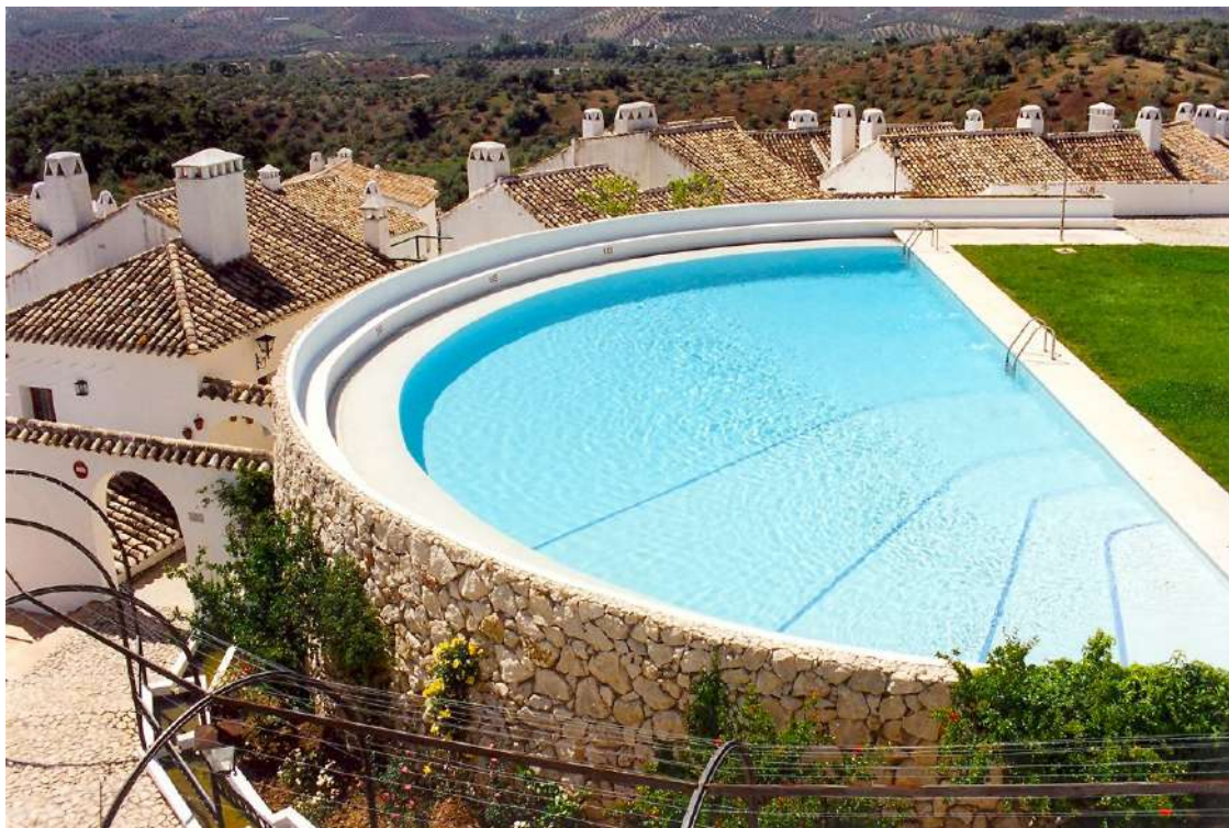
Villa turística de Priego

La villa turística de Priego -como todos sabemos ya se encuentra en el Parque Natural de las Sierras Subbéticas. El edificio principal impresiona por su arquitec-