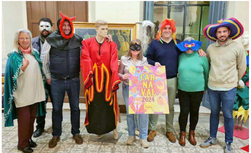
Autoridades y componentes de la Asociación Carnavalesca caracterizados para la presentación del Carnaval

Como es habitual, también se llevará a cabo el concurso de disfraces y desfile de carnaval, previa inscripción que concluirá el próximo día 6 de febrero, para ello hay que descargar el formulario desde la página web del ayuntamiento de Priego de Córdoba y presentarlo en el mismo registro municipal, dónde se facilitarán los dorsales para el desfile. Los premios