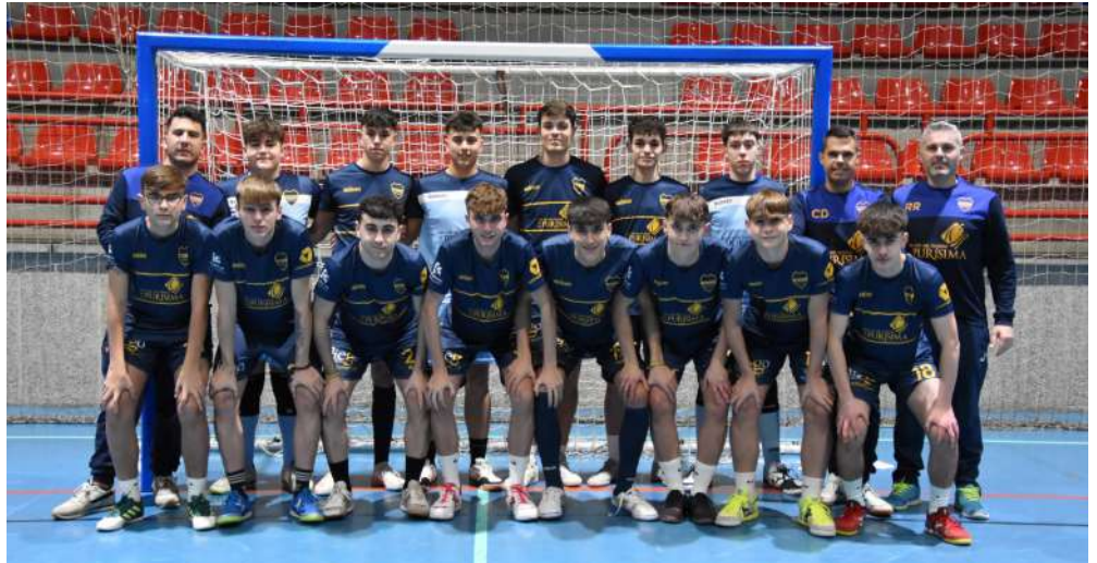
Boca Juvenil de 1ª Andaluza FS

Por su parte, El equipo femenino de la 2ª División Andaluza Senior Femenino, salía derrotado de la cancha del Hinojosa