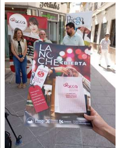
Presentación de la Noche Abierta.