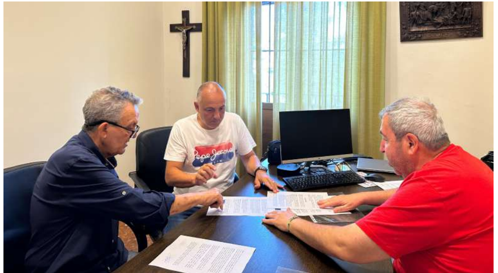
Los presidentes de ambos clubes junto al Concejal de Deportes.

de negociaciones entre los responsables de los distintos clubes que funcionaban en el municipio, con la intención de no duplicar iniciativas y esfuerzos y aprovechar las ventajas de constituirse en una sola entidad.