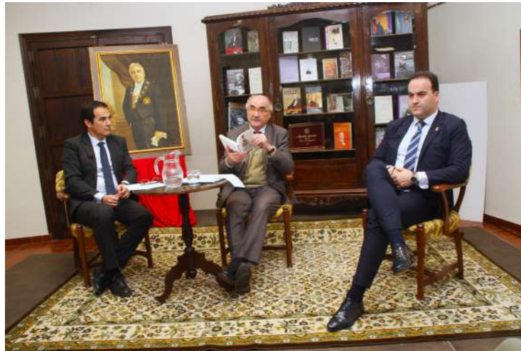
El Alcalde en una de sus últimas conferencias sobre Alcalá-Zamora.