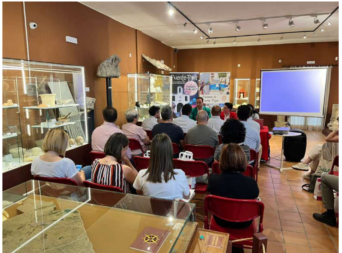
Presentación de las mejoras en las páginas web de turismo.

Además, se presentó a todos los ayuntamientos, un reportaje fotográfico por