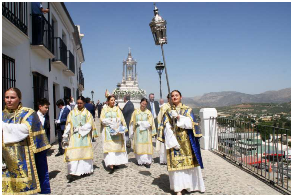
El Corpus por el Adarve por primera vez en su historia.

Christi en Priego comenzaron el pasado lunes 27 de mayo, con el triduo y la exposición del Santísimo Sacramento, rezo de vísperas y oración personal y Santo Rosario, dando paso a continuación a la Santa Misa. El martes y miércoles continuaron los mismos actos