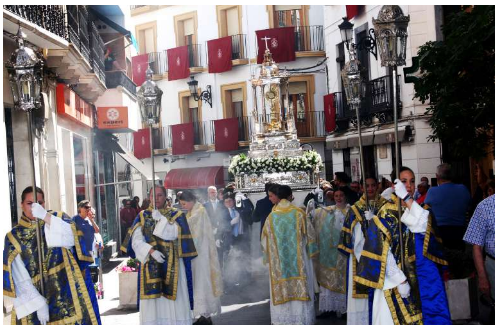
Instantes de la procesión a su paso por la Ribera.

Otras actividades paralelas a la religiosa son las que organiza la Asociación de Vecinos del Barrio de la Villa, actividades, como reconocimiento ya tradicional de homenajear al bebé más joven y a la persona más mayor del barrio. El acto tuvo lugar a las 10 de la noche del miércoles y tras el mismo, comenzó una "veraniega" verbena popular con música en directo en un barrio de lo más fresquito y encantador de Priego al que como cada año asistió un gran número de vecinos. Por último, cabe destacar que junto con Granada, Toledo y Sevilla y pocas más, somos los que mantenemos la tradición de celebrarlo el jueves.