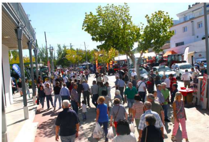
Imagen de la pasada edición de Agropriego 2023.

Con una superficie de exposición de 14.000 m 2 , la Feria Agropriego es el lugar ideal para que profesionales del sector agrario se reúnan, establezcan contactos y descubran las últimas tendencias. Especialmente relevante es el enfoque en la maquinaria del olivar, un