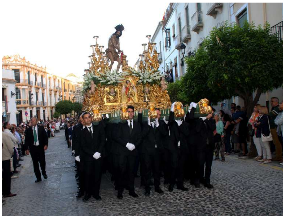
Jesús en la Columna en su desfile procesional.

Ya el lunes, 10 de junio, la sagrada imagen estaba expuesta en besapié en su capilla, mientras que por la noche se finalizaba la Rifa de regalos en el Compás, dándose por concluidas las fiestas columnarias.