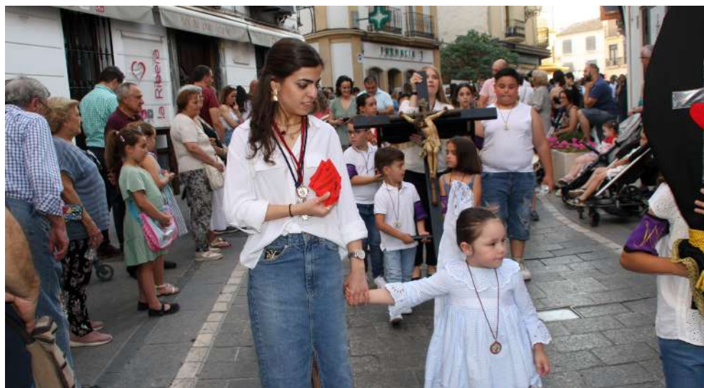
Momentos de la Procesion a su paso por la Ribera.