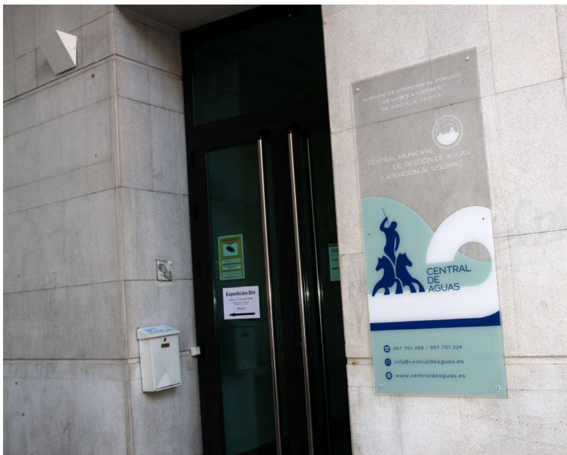
Fachada de la empresa municipal Central de Aguas.

Las intervenciones en Priego y sus aldeas, con sus correspondientes presupuestos han sido las siguientes. Plan de Fomento del Empleo