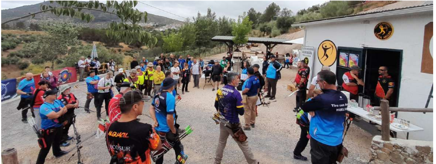
Participantes instantes antes de empezar la competición.