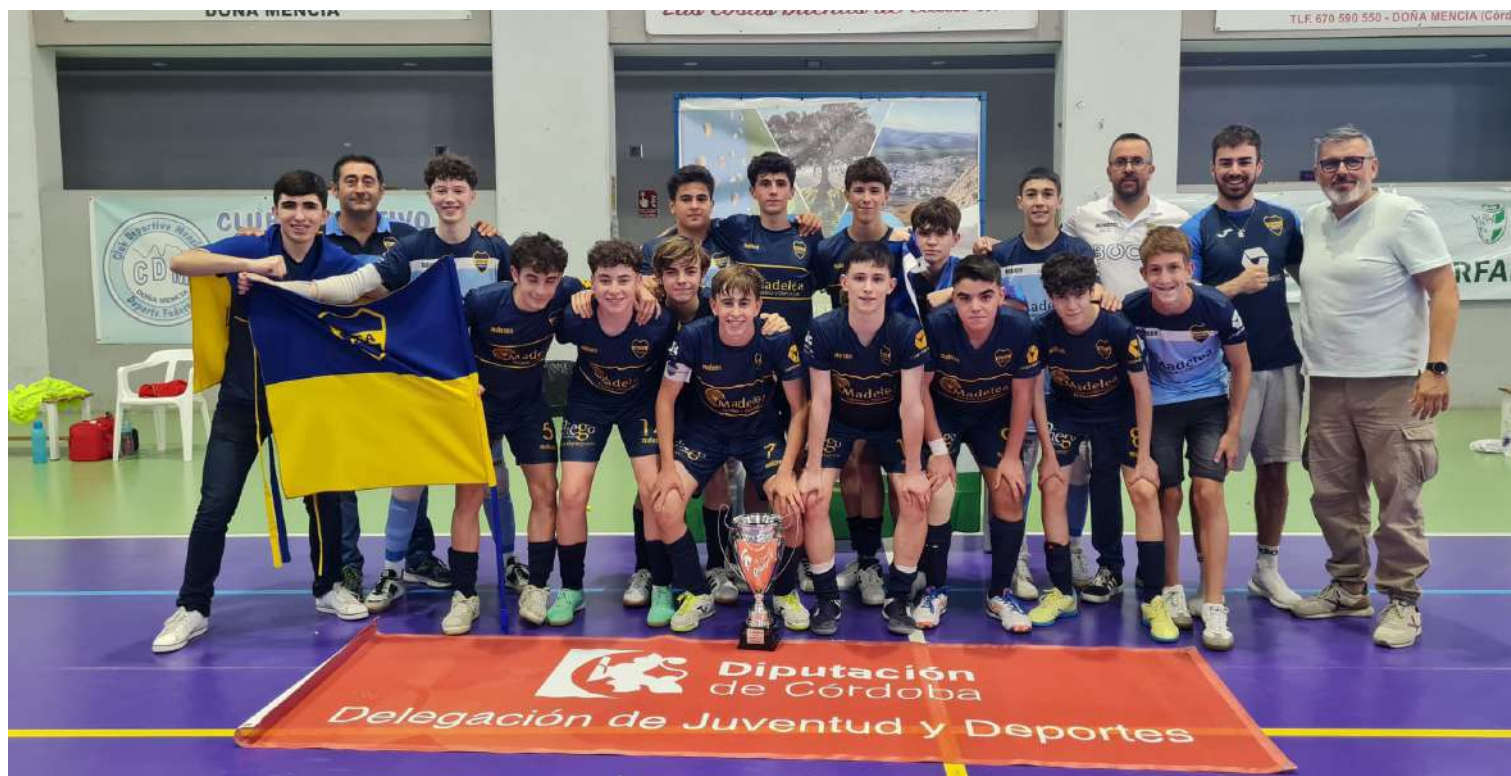
Boca FS Priego Cadete.