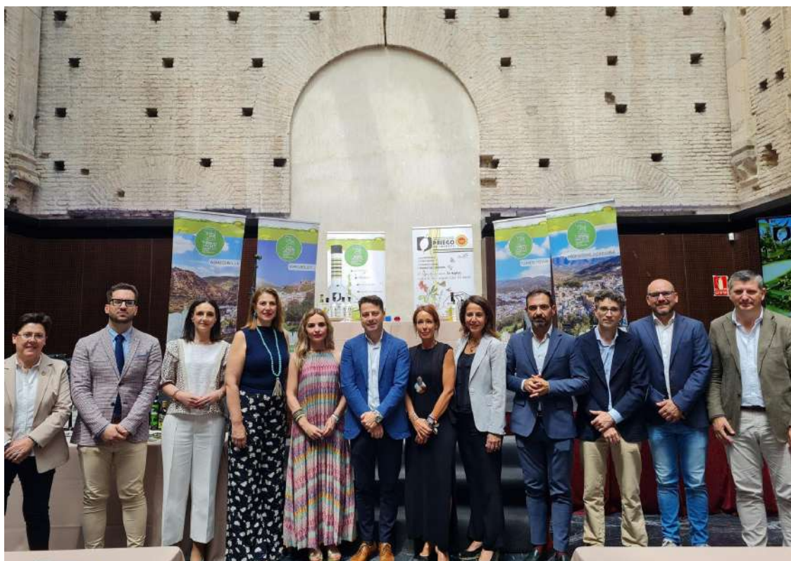
Autoridades provinciales, presidente de la DOP y alcaldes de Almedinilla, Carcabuey y Fuente Tójar.

Tras el protocolo tuvo lugar una cata maridaje en la que se dio a conocer las singularidades y características de los aceites de oliva virgen extra de la Denominación