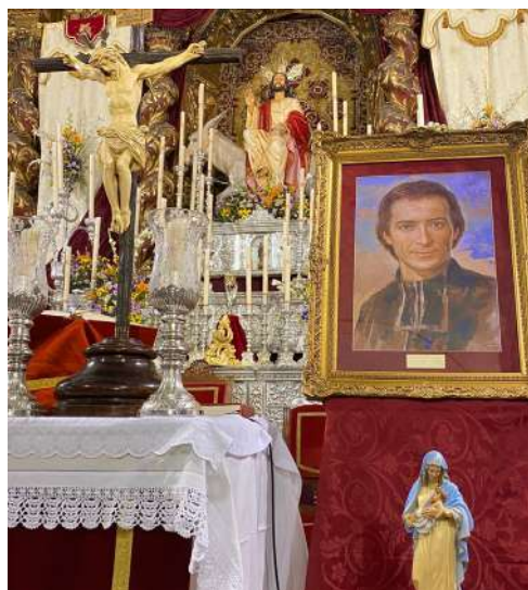
Retablo de las Fiestas Pollinicas.