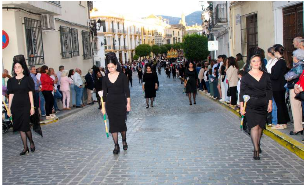
Mantillas delante de Jesús en la Columna.