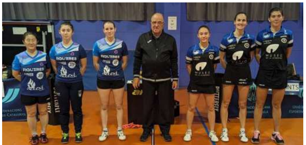
Los dos equipos antes de iniciar el último partido de la temporada.

queda en modo testimonial. El Museo de la Almendra Francisco Morales se quedará con la sensación de haberse quedado muy cerca de la gloria en tres competiciones.