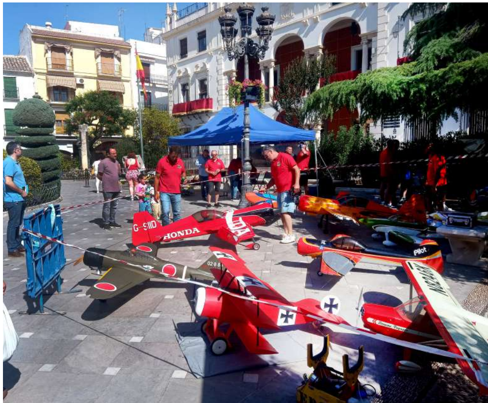
Instantes de la exposición.