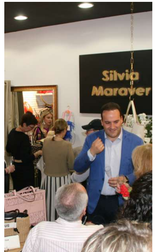
El Alcalde durante la inauguración.