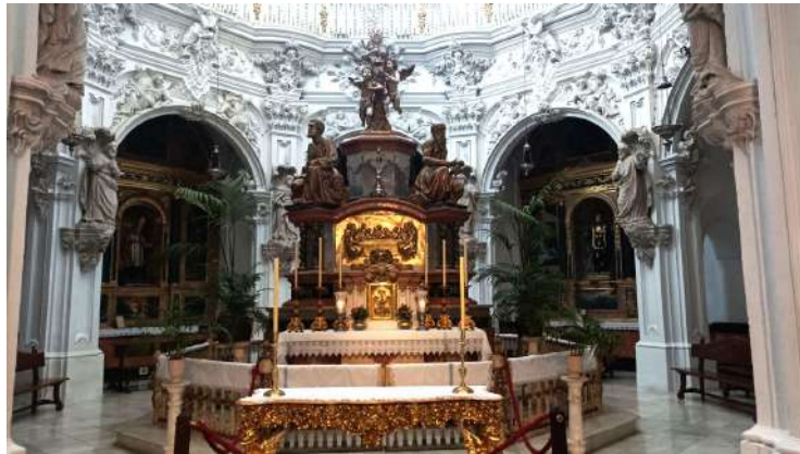
Monumento central del Sagrario.