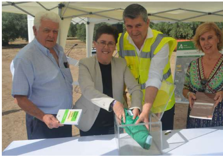
La alcaldesa de Fuente Tójar y representantes de la Junta de Andalucía.

se ubicará en el margen izquierdo del arroyo al que evacuará el efluente depurado, en el margen derecho de la carretera A-3225. Los terrenos se encuentran a más de un kilómetro de cualquier zona habitada, tanto del núcleo de población del municipio, situado al sur de la parcela, como de Zamoranos, perteneciente al término municipal de Priego de Córdoba.