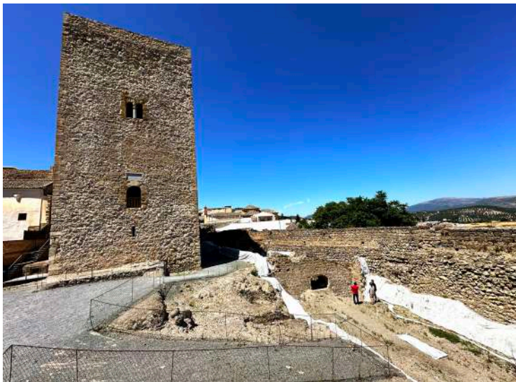
Murallas donde se intervendrá.

La subvención para la ejecución del proyecto se encuentra en fase de resolución. Será financiado al 100% con fondos Next Generation por un total de 1,5 millones de euros, mejorando la accesibilidad y realizando el atractivo turístico del castillo mediante la incorporación de nuevas tecnologías y la musealización.