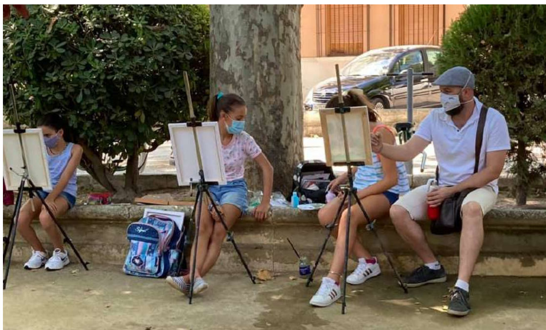
Profesor con sus alumnos de los Cursos de Paisaje.

Esta 37 edición de la Escuela Libre de Artes Plásticas, contará también como actividad complementaria de alto nivel, con la exposición de esculturas de Alice de Wil-