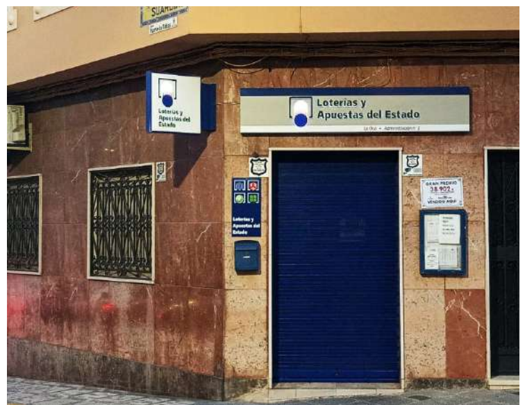
Administración que dio el premio de Bonoloto.

Desegunda categoría hubo cuatro acertantes, y además de Priego de Córdoba, en la administración número 2, de la calle República Argentina, se sellaron en despachos de Barcelona, Vilagarcía de Arosa (Pontevedra) y Orense.