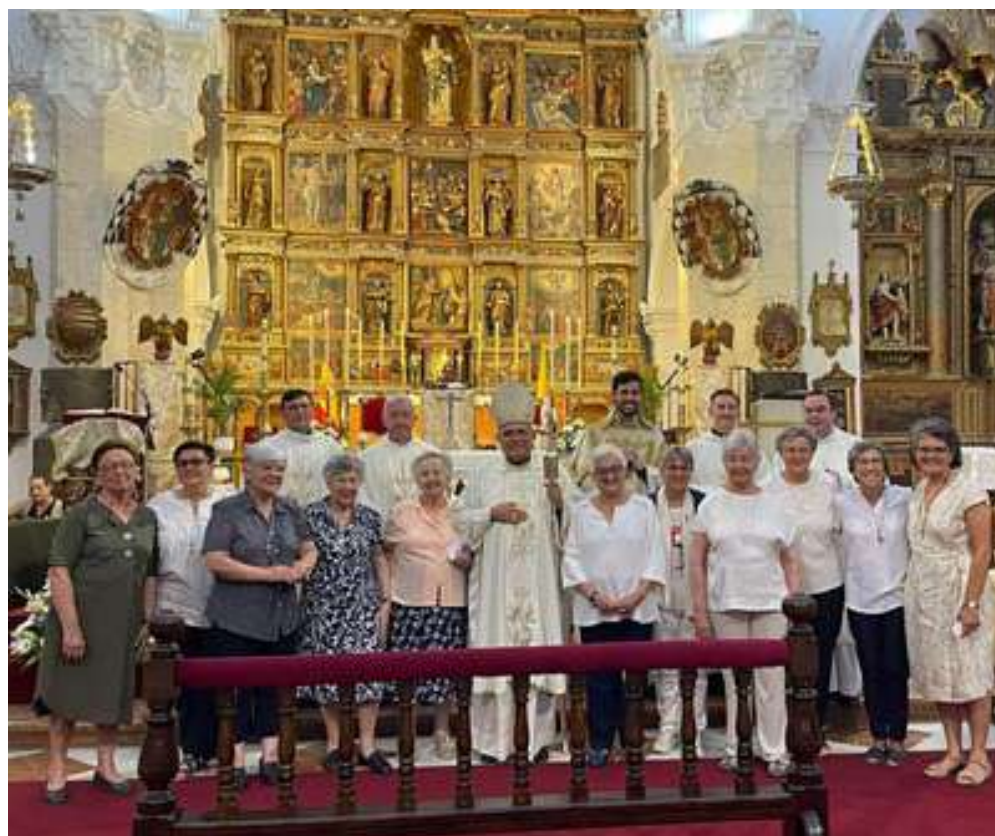
Priego despide a las religiosas del Sagrado Corazón junto al Obispo tras la misa de Acción de Gracias.

las religiosas fue el que le dedicó la hermandad de la Paz, participando en la celebración de la festividad de Santa María Sofía Barat, fundadora de esta