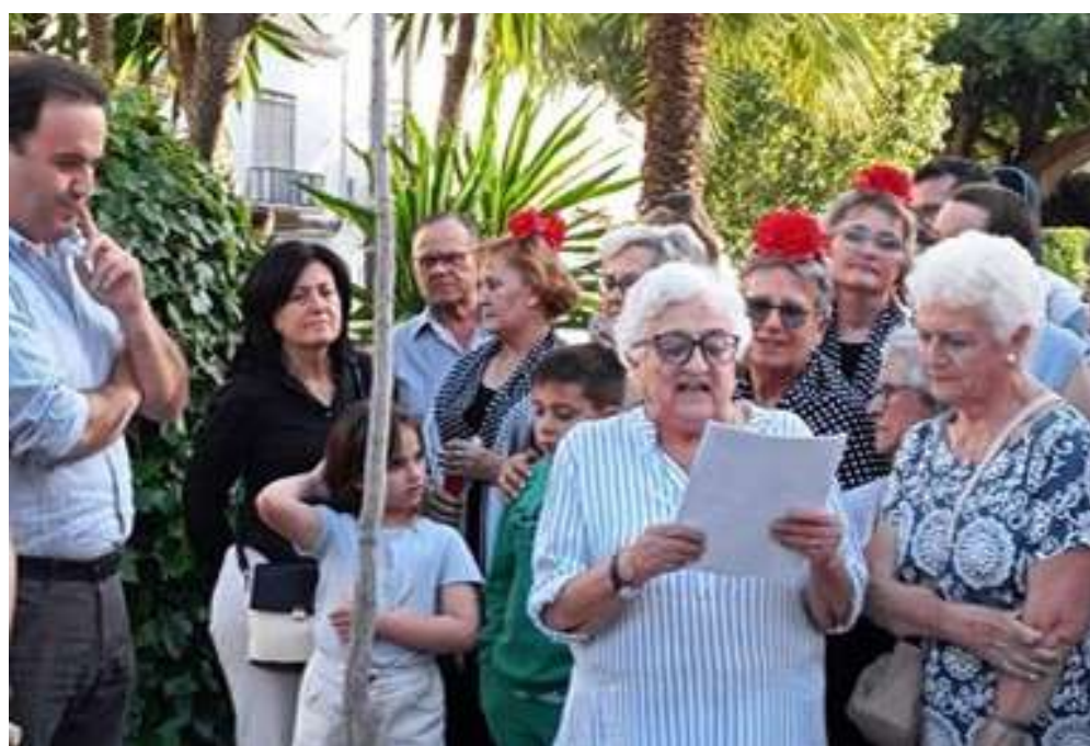
La Superiora despidiéndose de los vecinos del barrio junto al alcalde.

congregación. En el parque Virgen de la Paz, se plantó un árbol y se colocó una placa conmemorativa por la gran labor que han realizado durante tantos años.