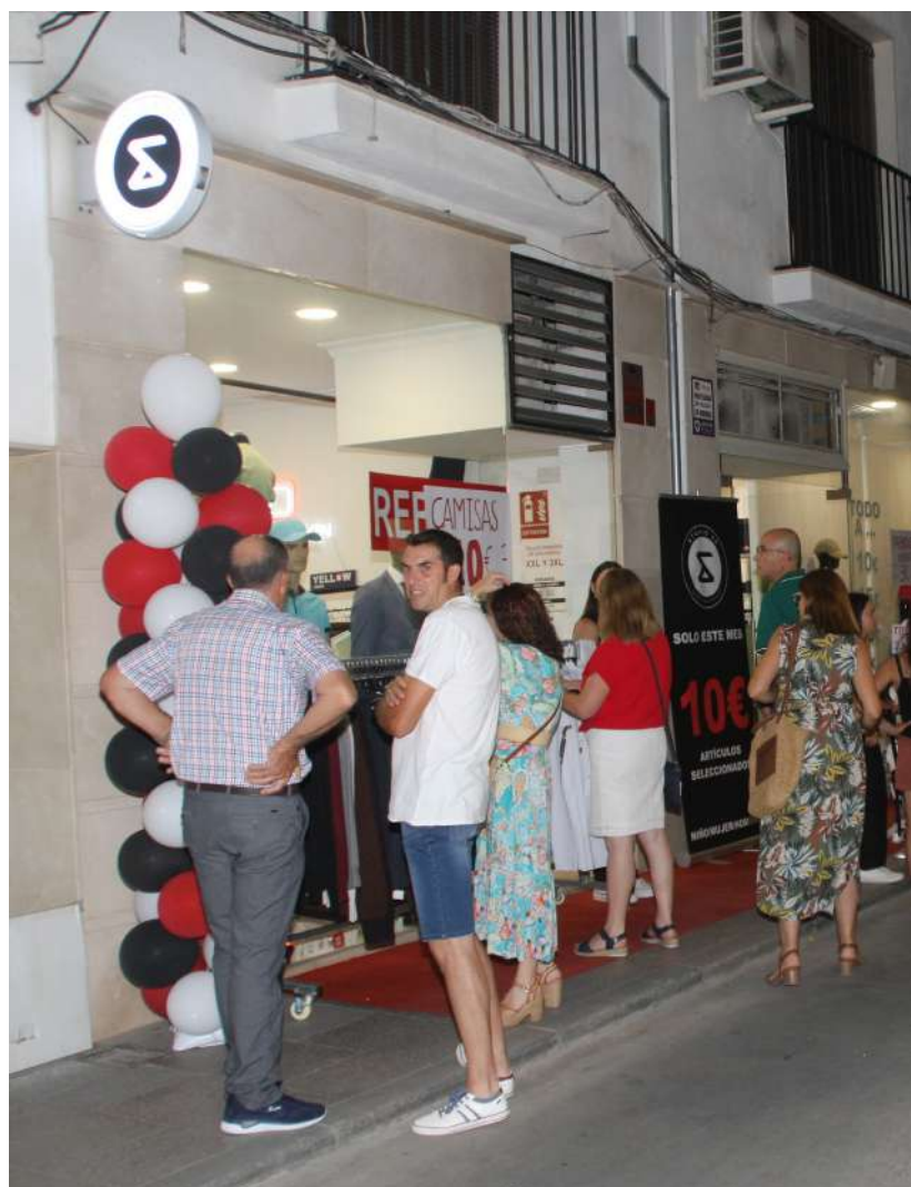
Distintas imágenes de la Noche Abierta

Hay que destacar que, la asociación ha puesto en esta ocasión dos autobuses para que los vecinos de nuestras aldeas también tuviesen la posibilidad de participar del evento. El pasado año solo se utilizó un taxi y en esta adi-