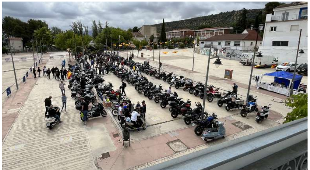
Moteros en el Recinto Ferial previo a la inauguración del 50 aniversario.

La celebración del 50 aniversario continuó en la mañana del domingo con un desayuno molinero, ofrecido por la Denominación de Origen Priego de