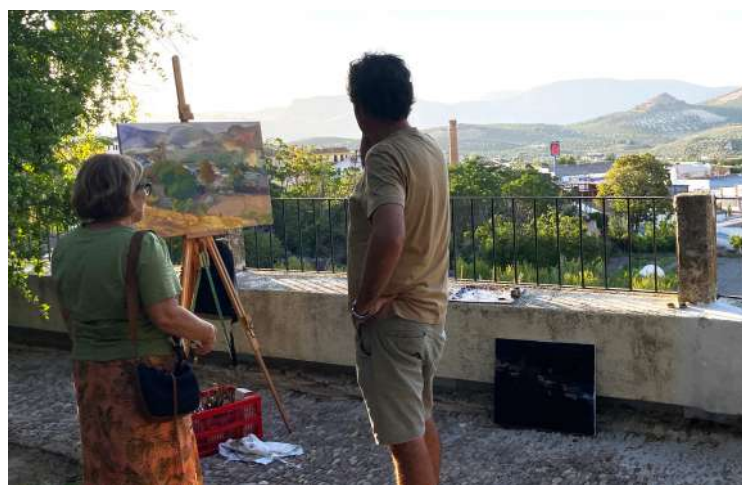
La profesora supervisando una pintura del alumno.