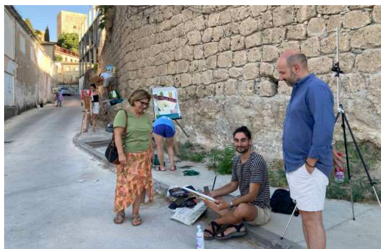
Imagen familiar ya en Priego con los alumnos del curso de paisaje.