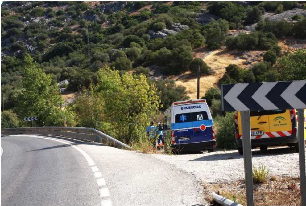
Carril de acceso al lugar del accidente.

El hombre, de 47 años, habría fallecido tras sufrir un accidente de tráfico en un el término municipal de Carcabuey, en las proximidades de la estación de servicio La Zamora