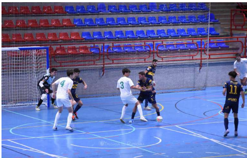
Partido de Pretemporada ante el Córdoba Patrimonio.

El senior femenino continuará un año más en la competición provincial, afianzando el proyecto del año anterior y manteniendo casi la totalidad del bloque que tan buenos resultados acabó obteniendo.