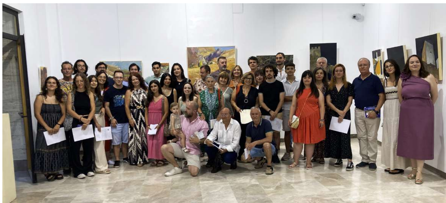
Alumnos que han participado en esta edición en la Escuela de Artes Plásticas en Priego.