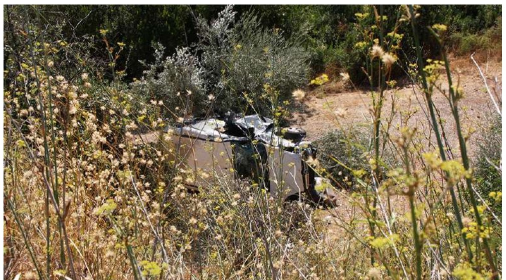
Así quedó el coche tras el fatídico accidente mortal.

Finalmente, el cuerpo sin vida y el vehículo fue encontrado en el paraje carcabulense denominado "La Raja", en el kilómetro 13 de la A-339, siendo necesaria la actuación de los bomberos del parque de Priego para la exhumación del cadáver el cual fue posteriormente trasladado al Instituto Anatómico Forense de la capital cordobesa. Por el momento se desconocen más detalles sobre el suceso.