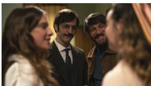
Protagonistas de la película durante una escena.

El cine no se había acercado aún al 23F, como lo ha hecho Guillermo Rojas, desde el punto de vista de los ciudadanos, y