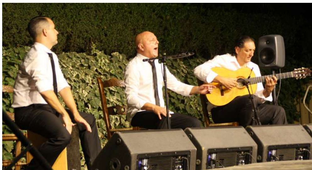
Instantes de la actuación del Festival Flamenco.