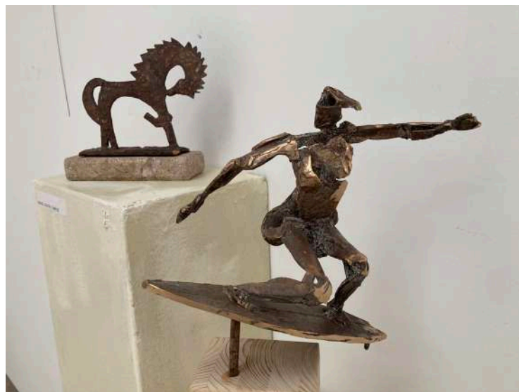
"Forja", una de las esculturas realizadas en el curso.