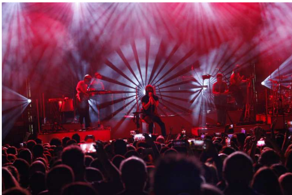
Momentos del concierto de Izal ante su numeroso público.

En total, unas dos mil personas aproximadamente se dieron cita en el concierto celebrado en el recinto ferial Niceto Alcalá-Zamora de Priego. No obstante, la polémica surgió días después, cuando a través de las redes sociales, se conoció que la productora del concierto había regalado dos entradas a todas aquellas personas que habían asistido días antes al concierto de Antoñito Molina en la vecina localidad de Cabra. De igual modo la polémica se acrecentó cuando desde el ayuntamiento se emitía una nota aclarando que nada tenían que ver con lo sucedido con respecto a las entradas regaladas a través de una página de venta de entradas que ofrecía dos entradas con tan solo solicitarlas por correo electrónico. En la