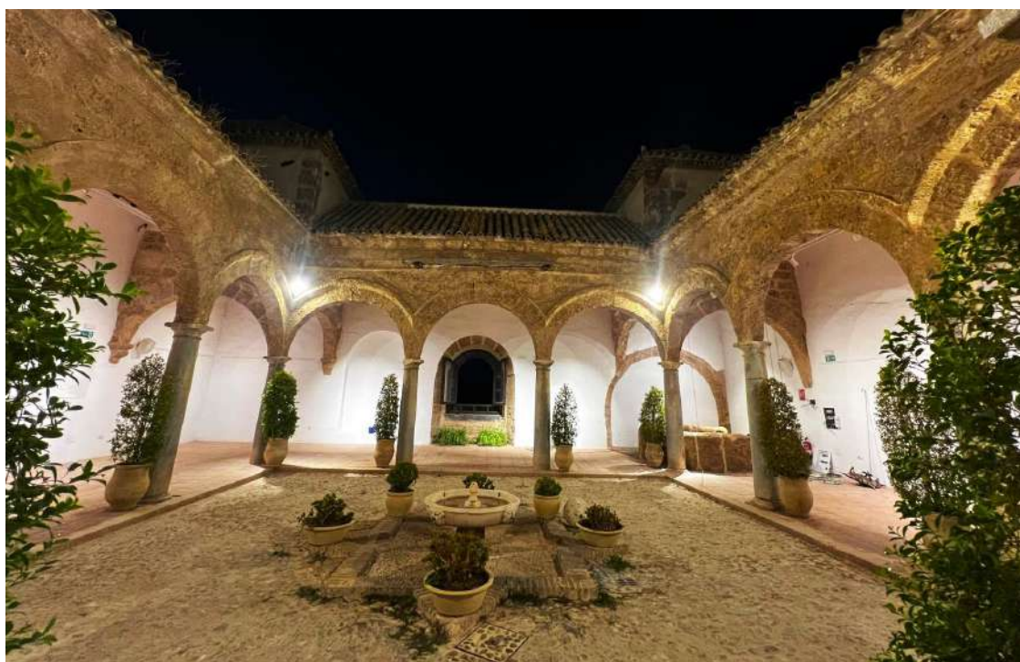
Panorámica de las Carnicerías Reales con su nuevo alumbrado.

Pero lo más interesante de todo es el acceso a la parte inferior, que era donde realmente se realizaba el sacrificio de animales. Este