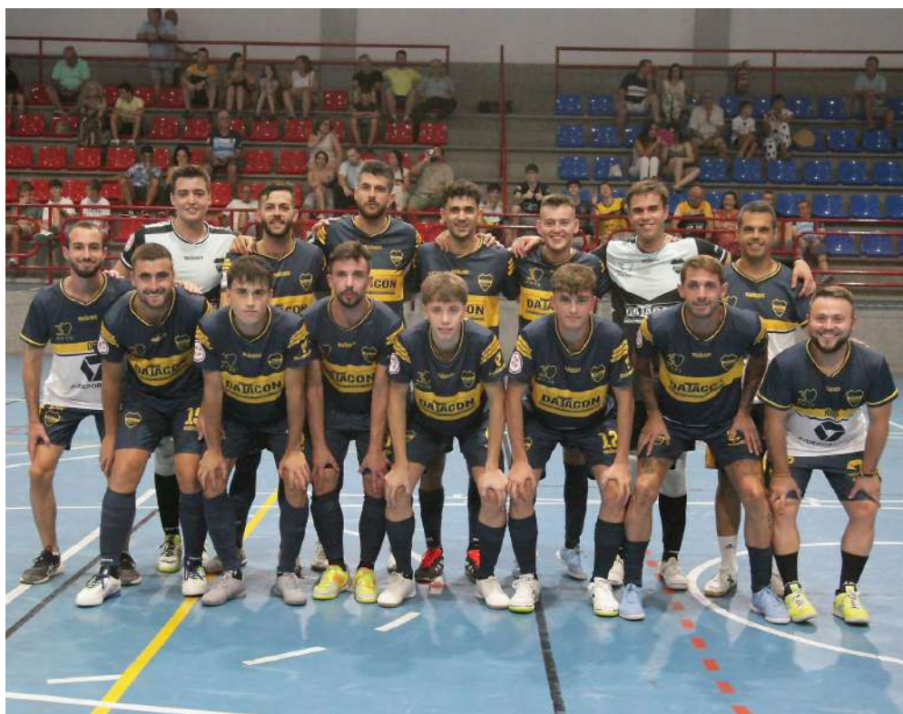
Jugadores del Boca Fs Priego antes del partido.

El club agradece la gran colaboración de patrocinadores privados con nuestros equipos, los cuales este año son para el equipo senior masculino Datacon, Atlet y Pintamanía, para el equipo senior