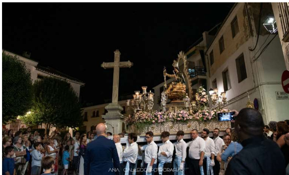
Procesión de la Virgen de la Aurora llegando a su ermita.