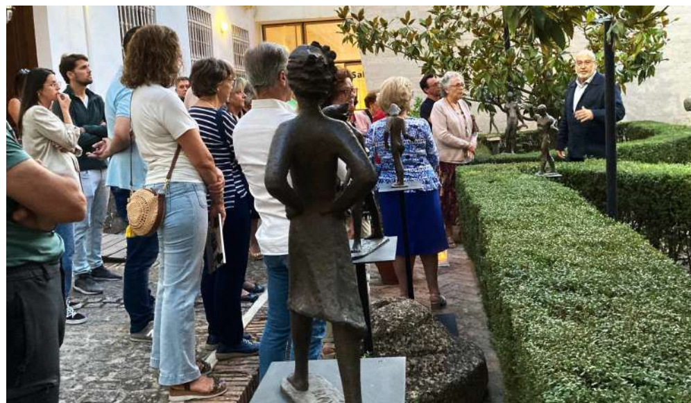
Momentos de la visita guiada.