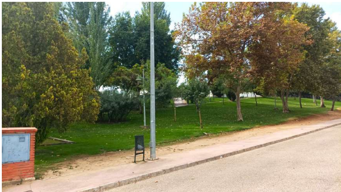
Zona donde se pretendía hacer el jardín botánico del olivo.

Según informaba el alcalde en su Facebook, "el fin principal era educativo y no turístico, buscando el poder formar a los visitantes del