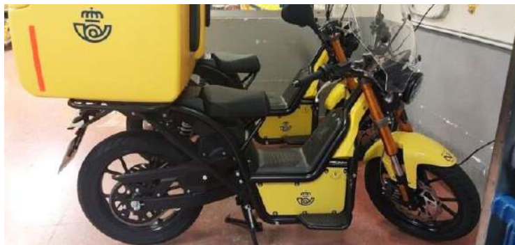
Modelo de moto energética que está utilizando correos.

La empresa ha ampliado en todo el país su flota de motos eléctricas ciberseguras con unidades de este modelo considerado como el primer vehículo ciberseguro tras haber superado el test que avala el suficiente grado de ciberseguridad conforme a los requisitos especificados en la normativa UNECE/R155, según el procedimiento y metodología ESTP desarrollado por Eurocybar.