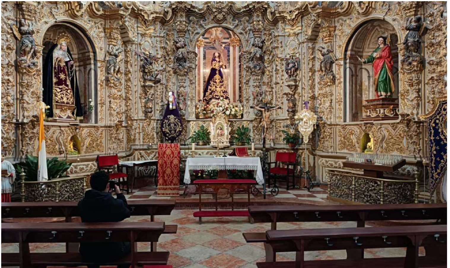
Capilla de Ntro. Padre Jesús Nazareno.

La Hermandad de Jesús Nazareno gestionará el espacio que se ubicará bajo el camarín de su capilla