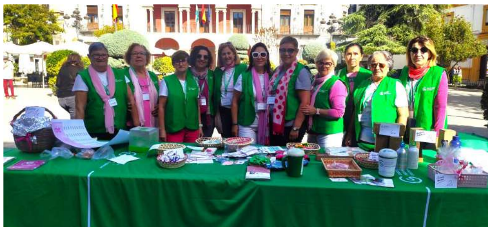
Miembros de la Junta local de Priego en la mesa informativa del Paseillo.