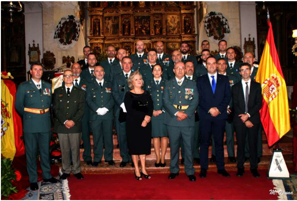
Agentes de la Guardia Civil de Priego en la celebración del día de su patrona.