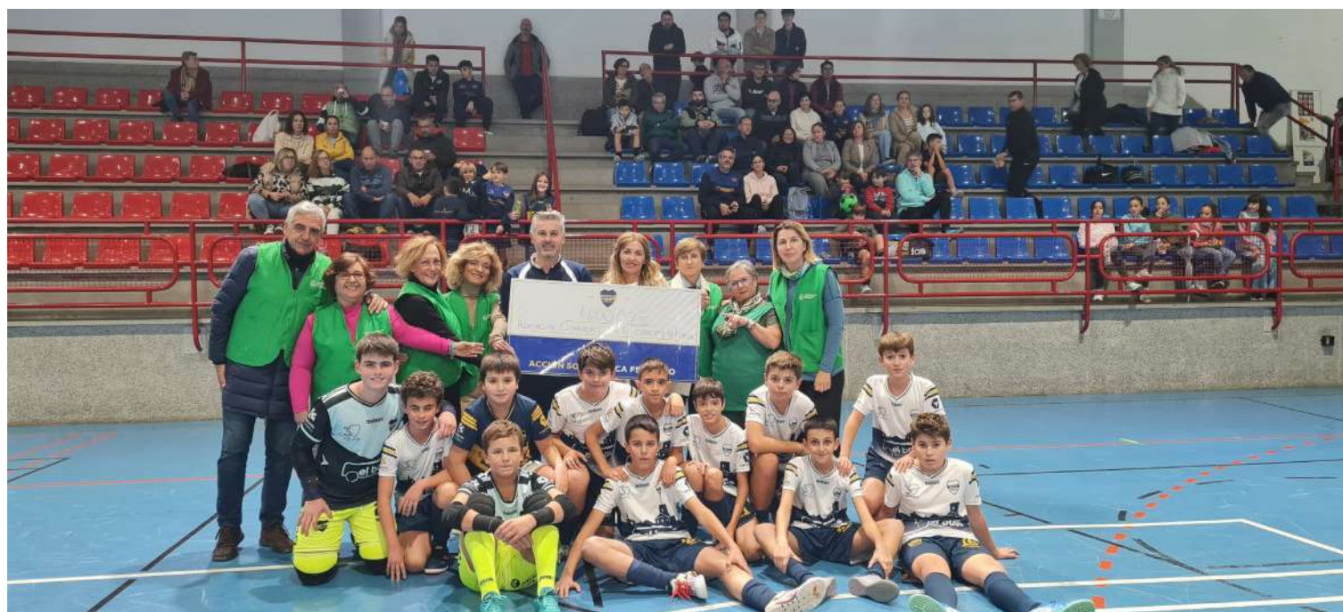
El equipo infantil junto con los responsables de la Asociación contra el Cáncer de Priego.

El Club Deportivo Boca Fútbol Sala Priego sigue realizando acciones de carácter social y en esta semana pasada coincidiendo con los actos de la Asociación Española Contra El Cáncer – Junta Local de Priego de Córdoba, el club prieguense quiso colaborar realizando una serie de sorteos de productos y servicios de diferentes establecimientos de la Comarca, para recaudar fondos para dicha asociación, en donde pudieron conseguir 1.600,00 € gracias a familiares, jugadores/as y aficionados del club que adquirieron diferentes papeletas para los sorteos de las cestas.