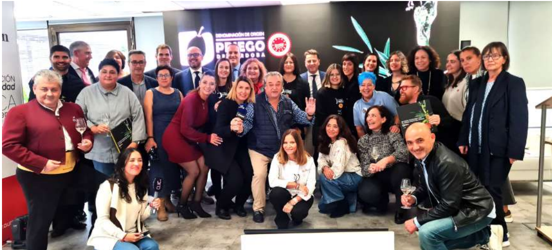
Representantes políticos y técnicos que asistieron a la presentación del recetario.

“25 Chefs cocinando con el mejor aceite del mundo”, una obra culinaria que exalta las bondades del Aceite de Oliva Virgen Extra con Denominación de Origen Protegida Priego de Córdoba.