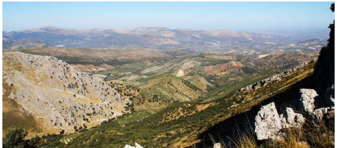
Vistas desde la Sierra de la Horconera.

De igual modo añaden que, “este volteo y enterramiento de la superficie del suelo perjudica gravemente a los microorganismos que viven en él; hongos, líquenes, bacterias, etc., que proporcionan la fertilidad natural del mismo, la