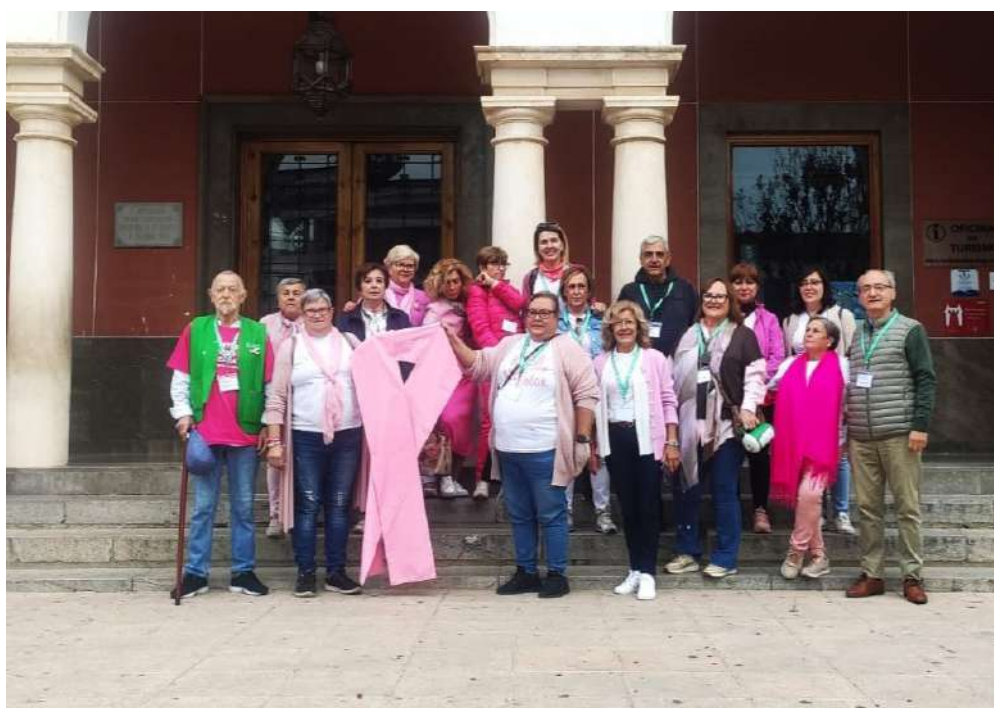
Miembros de la Junta local de Priego en la puerta del Ayuntamiento.

Para finalizar este mes de octubre rosa, la junta local de Priego se trasladó hasta Córdoba capital, donde un año más y en el vial, participó en la carrera contra el cáncer bajo el lema “la marcha que engancha”. De esta forma concluían las actividades programadas por las responsables de la junta local de Priego, la cual ha querido agradecer la ayuda y colaboración recibida año tras año por parte de entidades y empresas que desinteresadamente donan una cantidad importante de sus productos para poder celebrar la gran mayoría de actividades celebradas, éstas son: la Denominación de Origen Protegida “Priego de Córdoba”, la Flor de Mayo, Panadería Díaz y Panadería Adela y la colaboración del ayuntamiento de Priego.