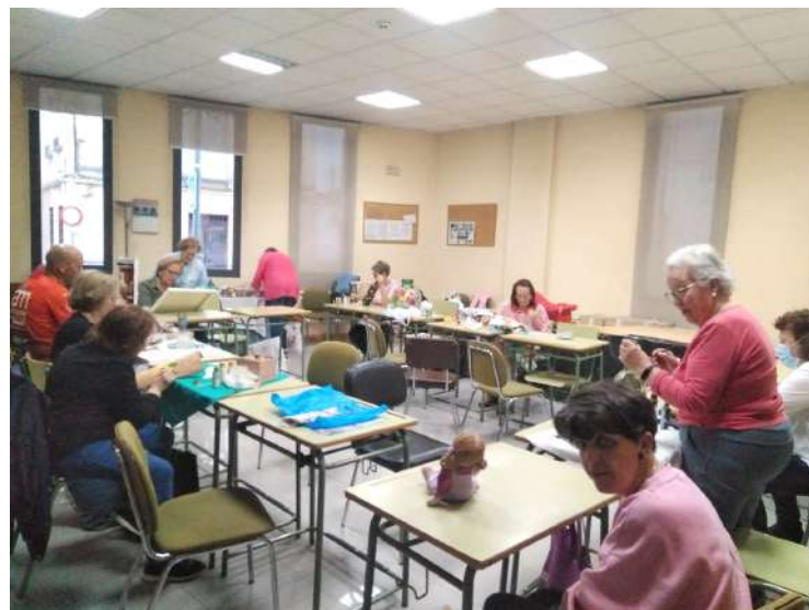
Alumnos del taller de manualidades (foto de archivo).

Una de las principales medidas que ha tomado el ayuntamiento este año es la regularización de los precios, lo que ha supuesto una reducción significativa en la mayoría de los casos, con bajadas de hasta un 65%. Por ejemplo, el taller de corte y confección, que