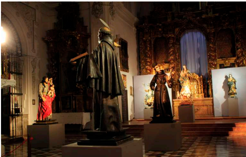
Imágenes de la exposición de José de Mora.