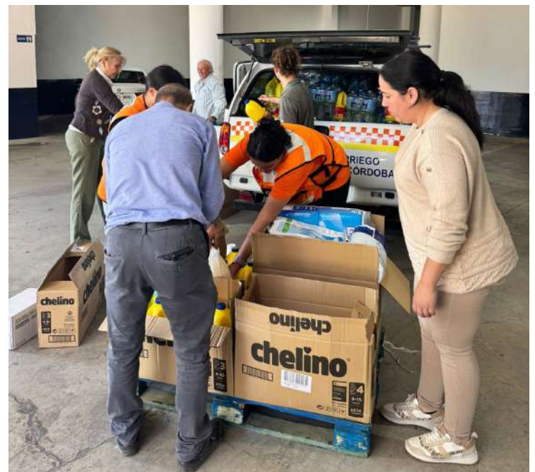
Voluntarios de Protección Civil de Priego cargan suministros de un supermercado local para trasladarlos a Valencia.

En palabras de Juan Ramon Valdivia, el esfuerzo de Priego de Córdoba y de toda la Subbética se ha centrado en “canalizar nuestra solidaridad de manera eficaz y segura”, con una aportación inicial de 15.000 euros por parte del ayuntamiento, reafirmando su compromiso de brindar apoyo a través de las organizaciones más implicadas en esta crisis.