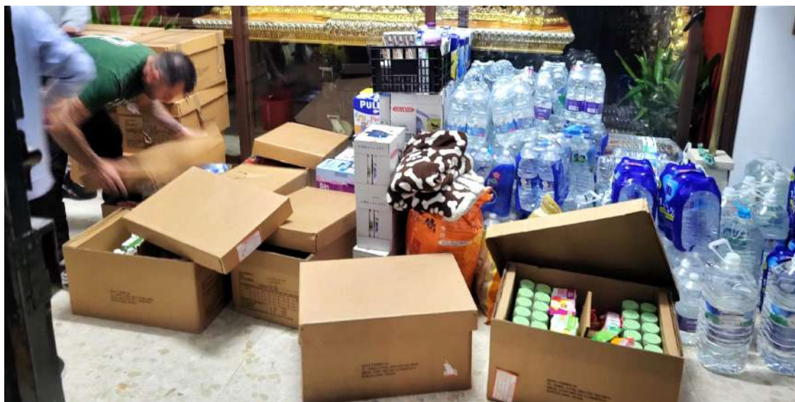
Voluntarios de la Hermandad de los Dolores organizando la mercancía.