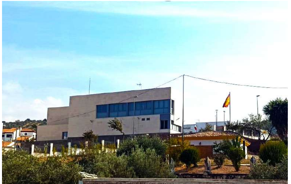
Cuartel de la Guardia Civil.

En virtud de la nueva Ley de bienestar animal, que entro en vigor en septiembre de 2023, se modificó el código penal incluyendo el delito contra los animales, el cual contempla la utilización de veneno como maltrato animal, que está