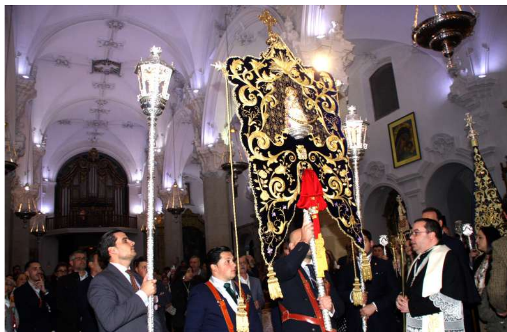
El Simpecado de la Hermandad de Priego en la Parroquia de la Asunción.

Dicho acto ha dejado ver a cientos de personas que atraídas por este encuentro de hermandades rocieras nos han visitado estos días, la gran calidad artística, cultural y devocional que alberga nuestra ciudad