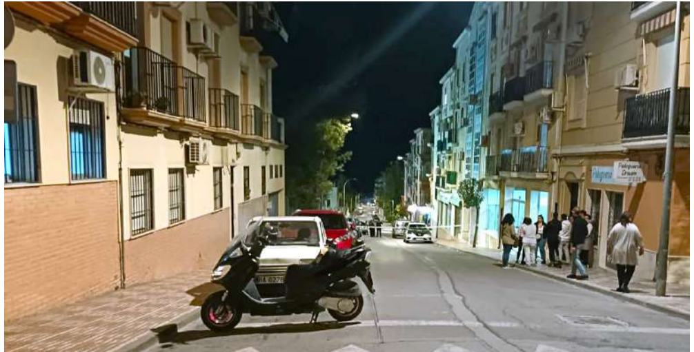
Lugar del fatídico accidente.

En el momento del suceso, una profesional sanitaria que pasaba por el lugar, de inmediato le practicó los primeros auxilios hasta que se personó el equipo del servicio de urgencias de Priego, quienes trataron de reanimar a la víctima durante más de veinte minutos, sin que fuese posible salvarle la vida. Finalmente, confirmaron el fallecimiento de esta persona y se procedió a activar el protocolo obligatorio en estos casos como es el acordonamiento de la zona, la espera de policía judicial para iniciar la investigación y también del médico