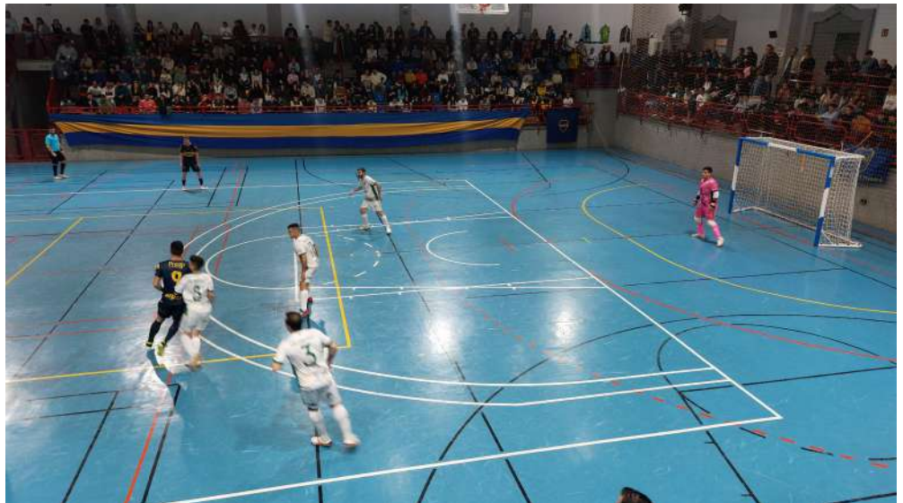
Instantes del partido.

Por su parte, el equipo juvenil volverá a la competición, después de un pequeño parón, debido a las jornadas de descanso y la retirada de un equipo sevillano. Vuelven así tras las 2 primeras victorias cosechadas en los dos partidos disputados, lo que refrendan el nivel competitivo que están dando. El siguiente partido será