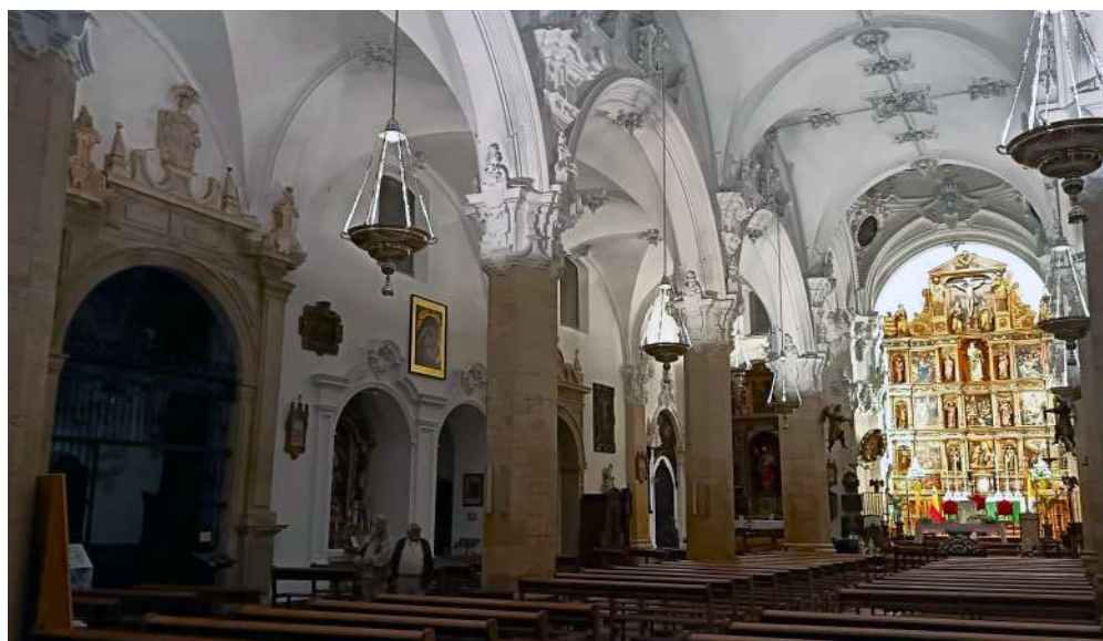
Nave central y entrada al sagrario lateral izquierdo.