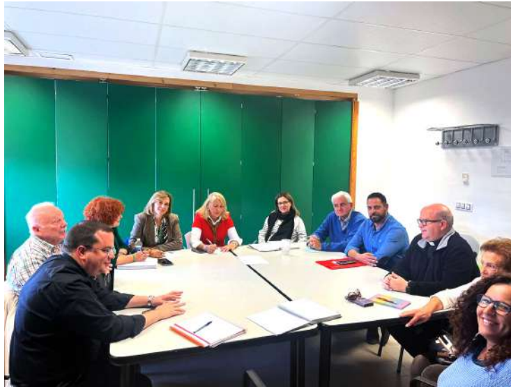
Instante de la reunión de la mesa de protección laboral de inmigrantes.

Desde hace años, Priego cuenta con un programa específico de atención a la población temporera, gestionado por la Red Social de Inmigración, (RSI), que agrupa a las parroquias de Nuestra Señora del Carmen, Nuestra Señora de la Asunción y María Santísima de la Trinidad, junto a entidades privadas