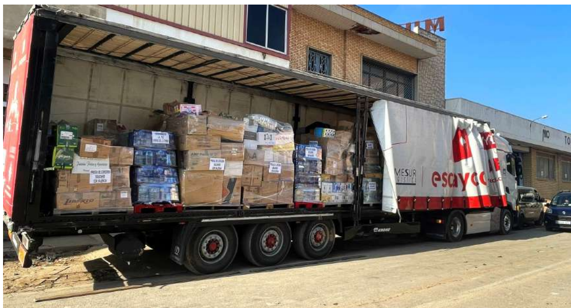
Camión de víveres para los afectados en Valencia por la Dana.