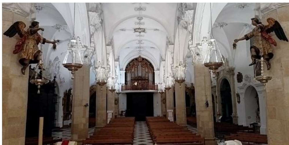
Nave central desde el Altar Mayor.

de pintura en tabla de San Pedro vestido de pontifical, la pila de bautismo con su tapa de madera, guarnecida de hierro, con candado y llave.