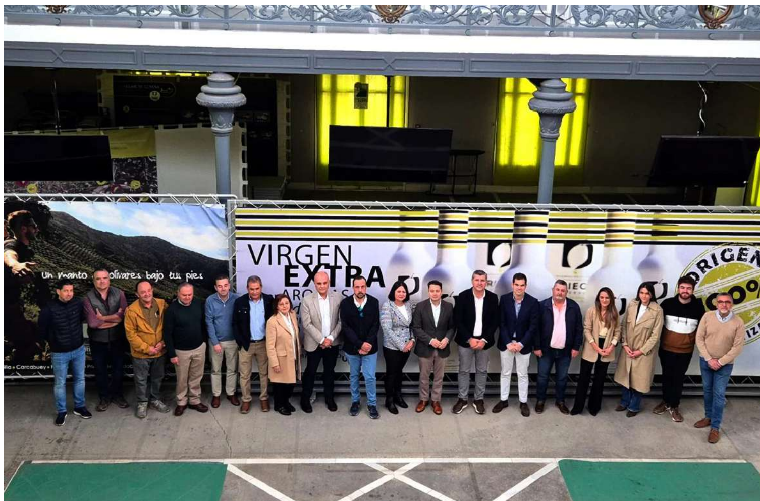
Miembros de la Junta Directiva.