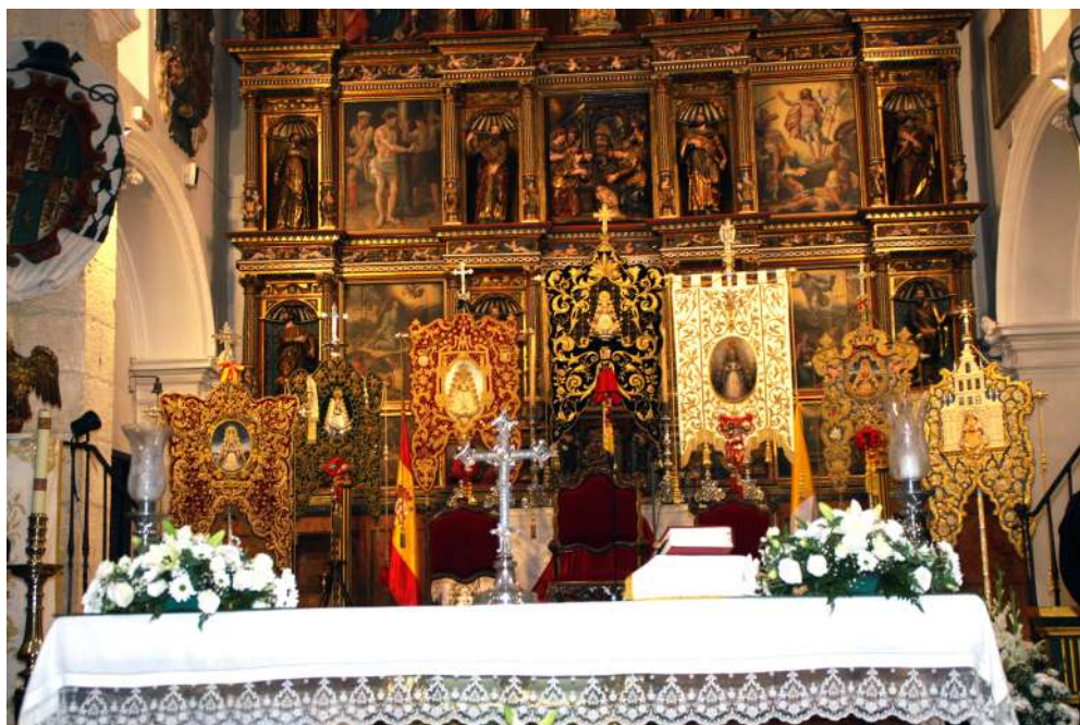
Los 7 Simpecados en el Altar Mayor.