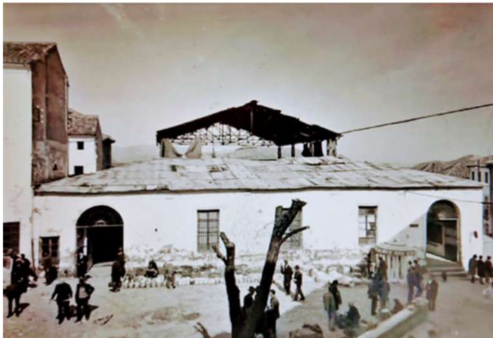
Ilustración 1. Plaza de Abastos construida por una sociedad a partir del 1904. Archivo Municipal Histórico de Priego. Vista desde el Compás de San Pedro.