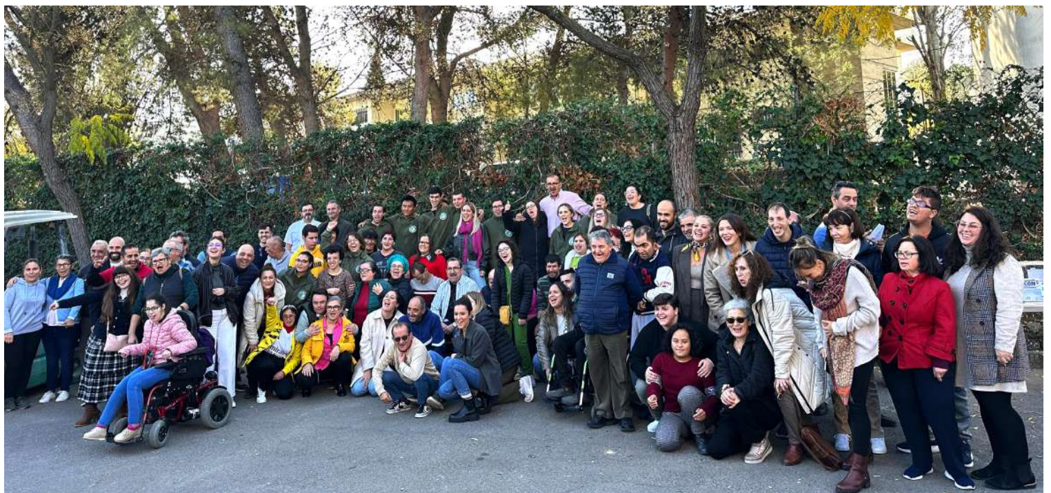
Comunidad de residentes y miembros de Albasur en el acto de colocación de la primera piedra del nuevo edificio.

socialización, fundamentales para mejorar la calidad de vida de las personas atendidas y fomentar su autonomía. El proyecto refleja el compromiso de la Junta de Andalucía con la inclusión social y la mejora de los servicios para las personas con discapacidad intelectual. Fue en julio de 2024 cuando la Junta de Andalucía aprobó destinar 19,2 millones de euros a 15 proyectos en Córdoba para la construcción y mejora de centros para personas mayores y con discapacidad, donde se incluía este proyecto en Priego. Estas ayudas, financiadas por los fondos europeos Next Generation, incluyen el proyecto de Albasur y otros proyectos como la construcción de residencias y centros de día para diferentes municipios y entidades, sumando un total de 26,5 millones de euros.