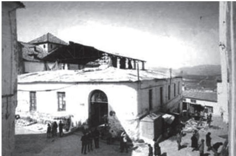
Ilustración 2. Plaza de Abastos vista desde la calle República Argentina, a la izquierda la iglesia de San Pedro. Archivo Histórico Municipal de Priego.