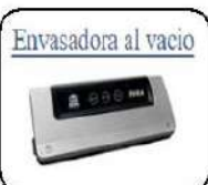
Envasadora al vacío