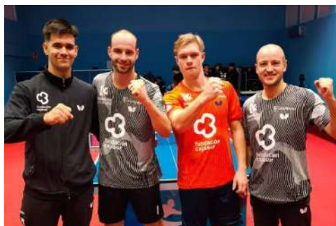
Equipo del Cajasur TM que ganó el partido.

En momentos donde los nervios están a flor de piel, es importante que den un paso al frente los palistas con mayor experiencia en este tipo de contextos, y ahí estaba un Diogo Carvalho que comenzó el duelo como primer espada de un Real Cajasur Priego TM que sumó su primer punto en el general des-