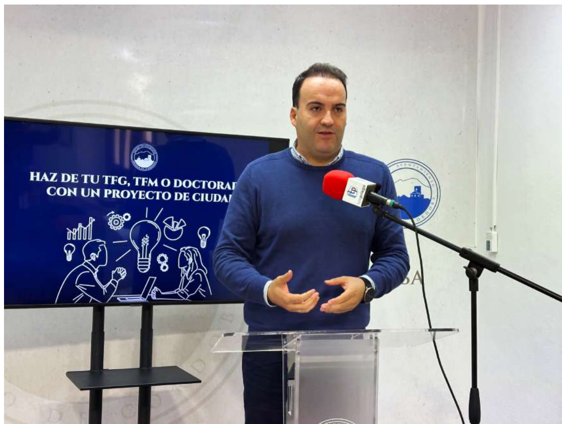
El alcalde Juan Ramón Valdivia, presentando el programa “Un proyecto de ciudad”.

Se trata de un programa que permitirá presentar proyectos finalizados cada mes de septiembre, ofreciendo a los estudiantes apoyo técnico y material desde el Ayuntamiento de Priego de Córdoba, con la posibilidad de hacerlos realidad.