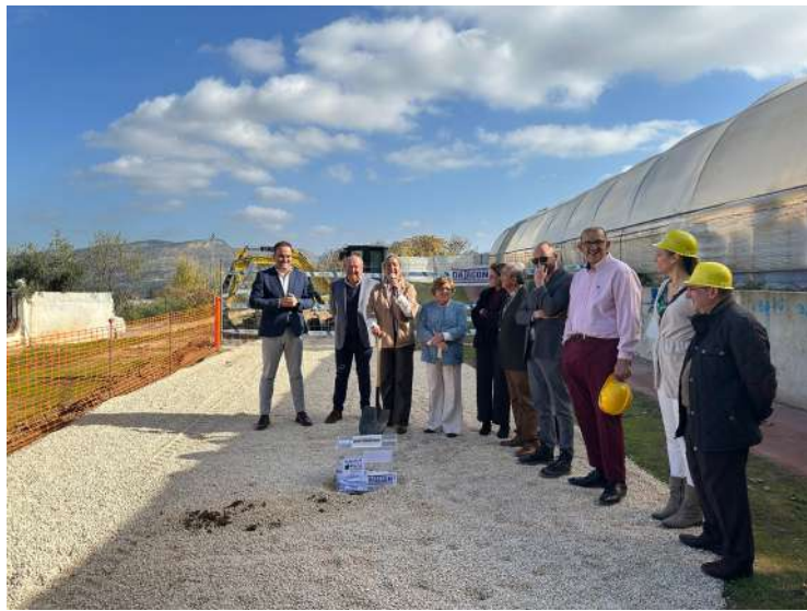
Acto de la primera piedra con las autoridades y responsables de Albasur.