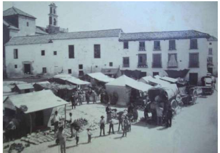
Ilustración 3. La Plaza situada en el Paseillo hasta la construcción de la Plaza de Abastos, a la izquierda el convento y hospital de San Juan de Dios.