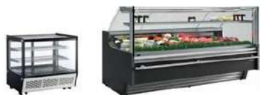
Maquinaria de Frio comercial