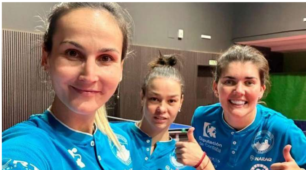
Jugadoras del Museo de la Almendra "Francisco Morales" que vencieron en dicho encuentro.