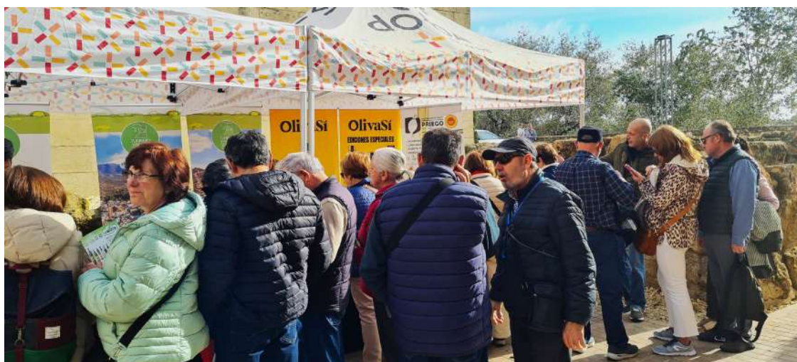
Visitantes al Stand de la DOP en la capital.

En esta ocasión, desde cordobeses hasta turistas de todas partes del mundo, principalmente de Italia, Alemania y Francia, pudieron conocer los primeros aceites de oliva virgen extra con D.O.P. Priego de Córdoba de la campaña 2024/2025, elaborados a partir de las variedades de aceituna Hojiblanca, Picual y nuestra variedad autóctona, la Picuda. En este evento se dio a conocer todas las marcas amparadas, las cuales destacaron por su frescura, aroma intenso y su sabor equilibrado, características que reflejan el esfuerzo y dedicación de los olivares de la comarca. La presentación no solo sirvió para mostrar la calidad excepcional de los aceites de oliva virgen extra de la D.O.P. Priego de Córdoba, sino también para dar a conocer los municipios de la comarca, pues durante el evento, se informó a todos los visitantes sobre las numerosas actividades que tendrán lugar en