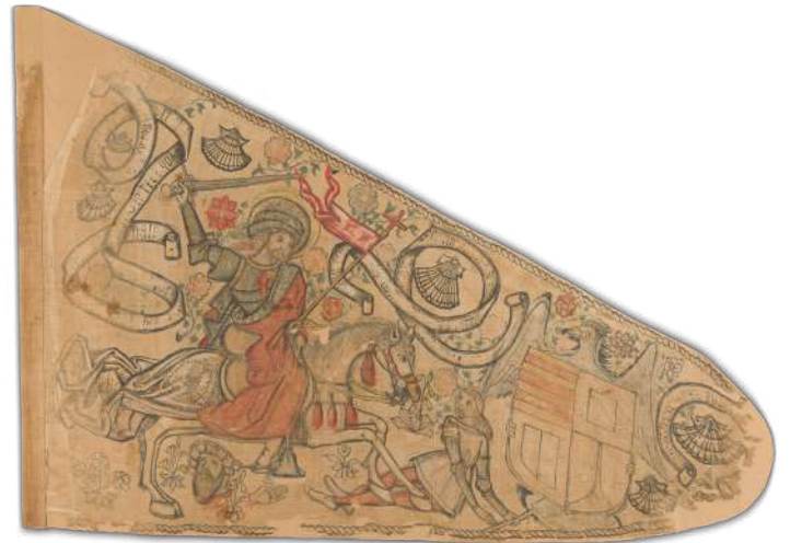
El estado del Pendón antes y después de su restauración a cargo del Instituto Andaluz de Patrimonio Histórico de la Junta de Andalucía.