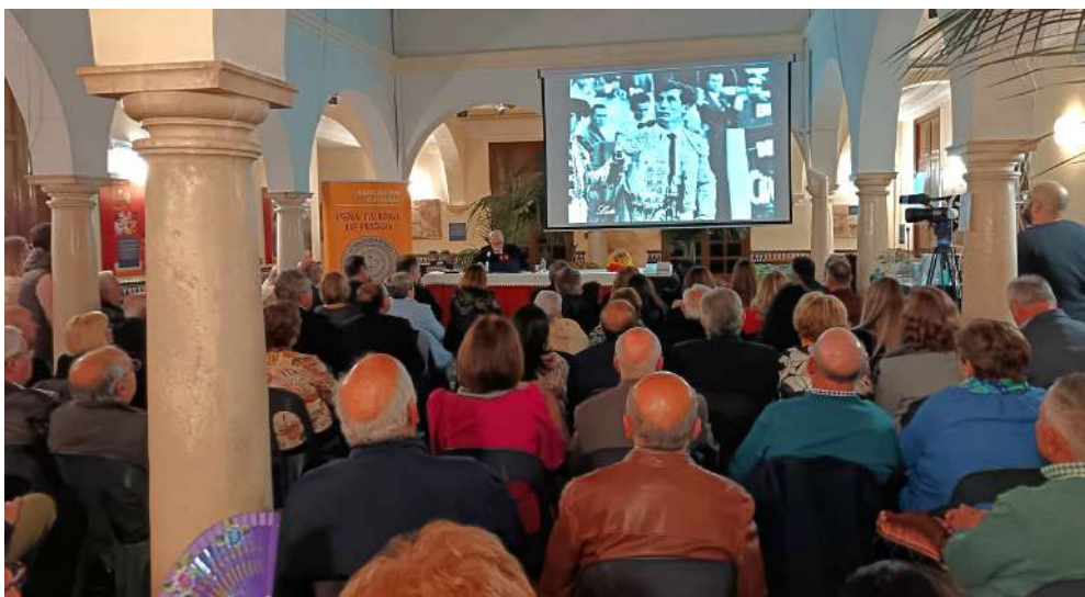
Instante de la conferencia de IADIS.