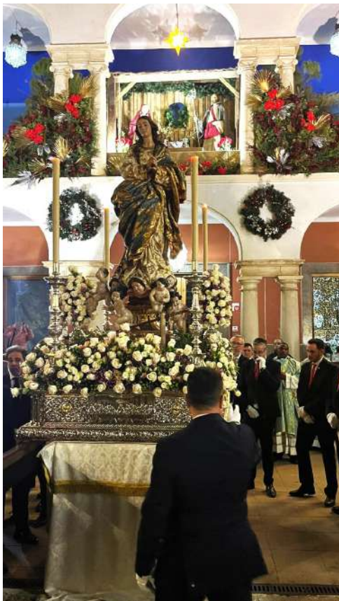
La imagen de la Inmaculada procesionando a las puertas del Ayuntamiento.