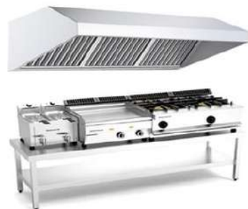
Maquinaria de Cocción