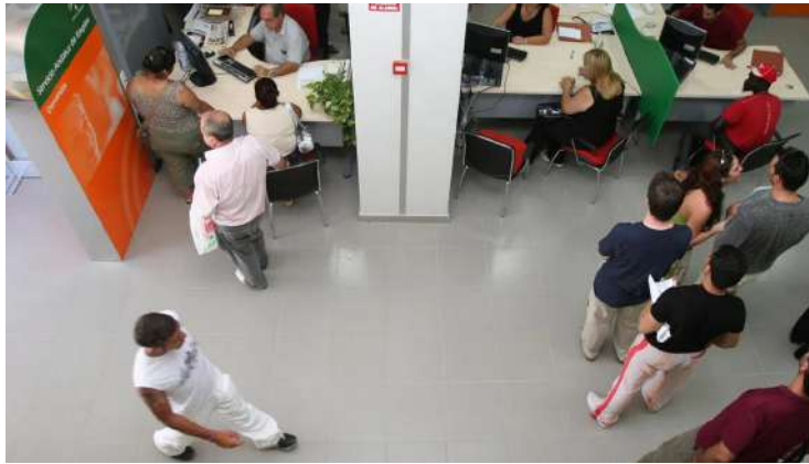
Una oficina del SAE de Córdoba.

anotó al cierre de noviembre un descenso del paro respecto a octubre del 1,4%. De contabilizarse 28.946 desempleados se pasó a 28.529. Ello supone 417 personas in trabajo más. Si la comparación se hace con la situación de hace un año, se observa que esta lacra socioeconómica ha bajado un 7,5% al contabilizarse 2.328 desempleados menos.