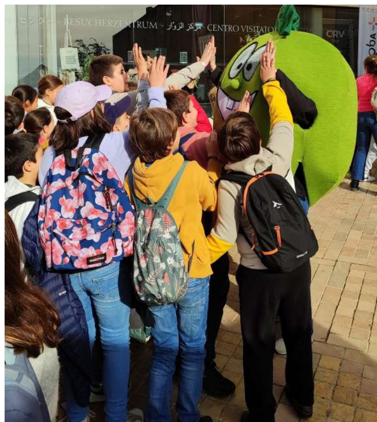
Los más jóvenes jugando con la mascota aceituno.

ellos a lo largo del mes del aceite que concluirá con el último día de año, donde los asistentes podrán disfrutar de experiencias gastronómicas, culturales y educativas, entre las que se encuentran catas dirigidas, degustaciones populares, rutas de senderismo donde descubrirán los paisajes de la subbética, desayunos molineros, conferencias sobre el aove y sus beneficios y mucho más. Por último, no pudo faltar la presencia de la mascota de la D.O.P. Aceituno, que causó furor entre jóvenes y no tan jóvenes. Los asistentes no dudaron en hacerse fotos con él, compartiendo un momento divertido y especial en esta celebración dedicada al olivo y al producto que se obtiene de él, el aceite de oliva virgen extra, conocido popularmente como nuestro oro líquido.