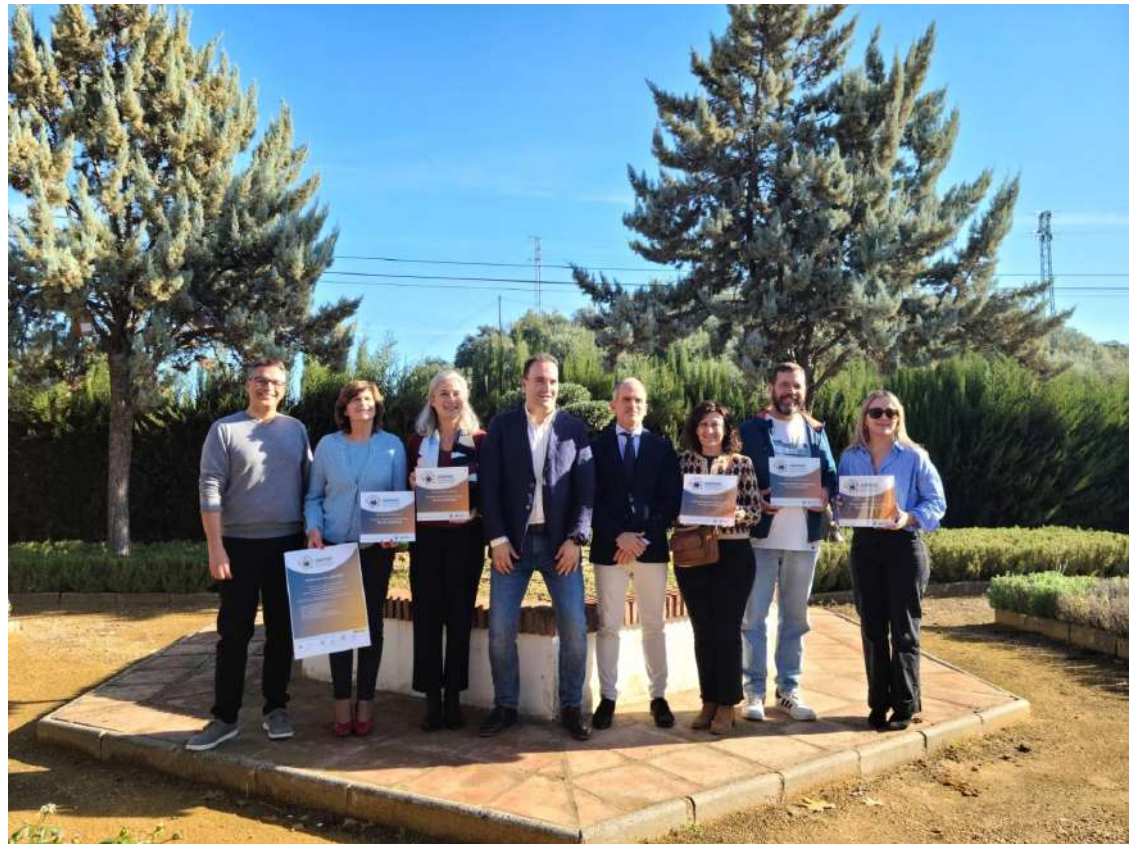
Representantes de las seis empresas mostrando su certificado junto a las autoridades.

Con estas nuevas incorporaciones, el Parque Natural Sierras Subbéticas se posiciona como el cuarto espacio natural de Andalucía en número de empresas acreditadas con