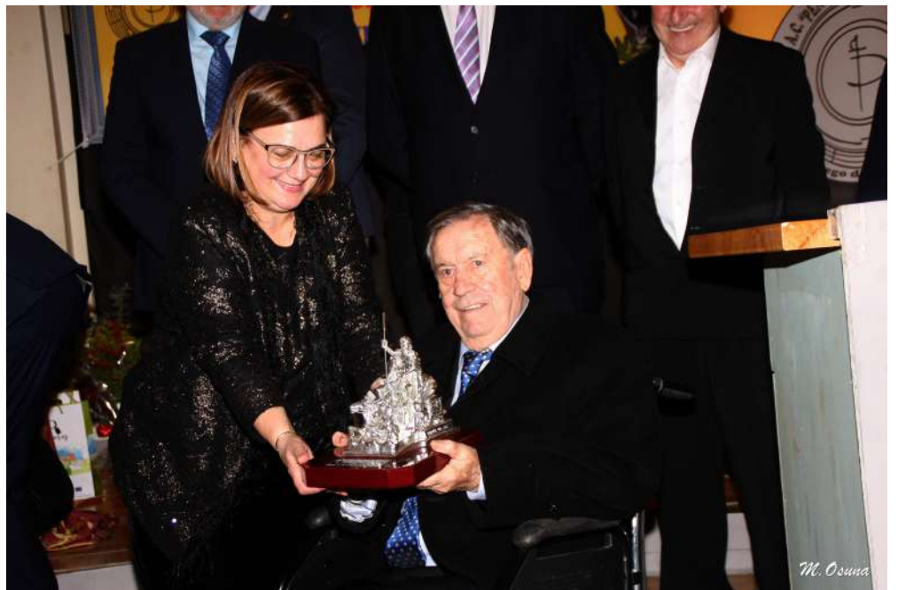
La Presidenta entregando el premio.