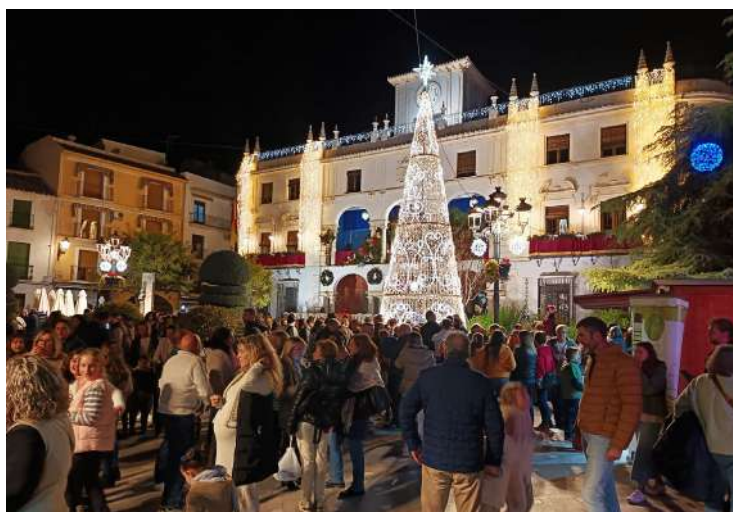
Asistentes a la inauguración del alumbrado extraordinario de Navidad.